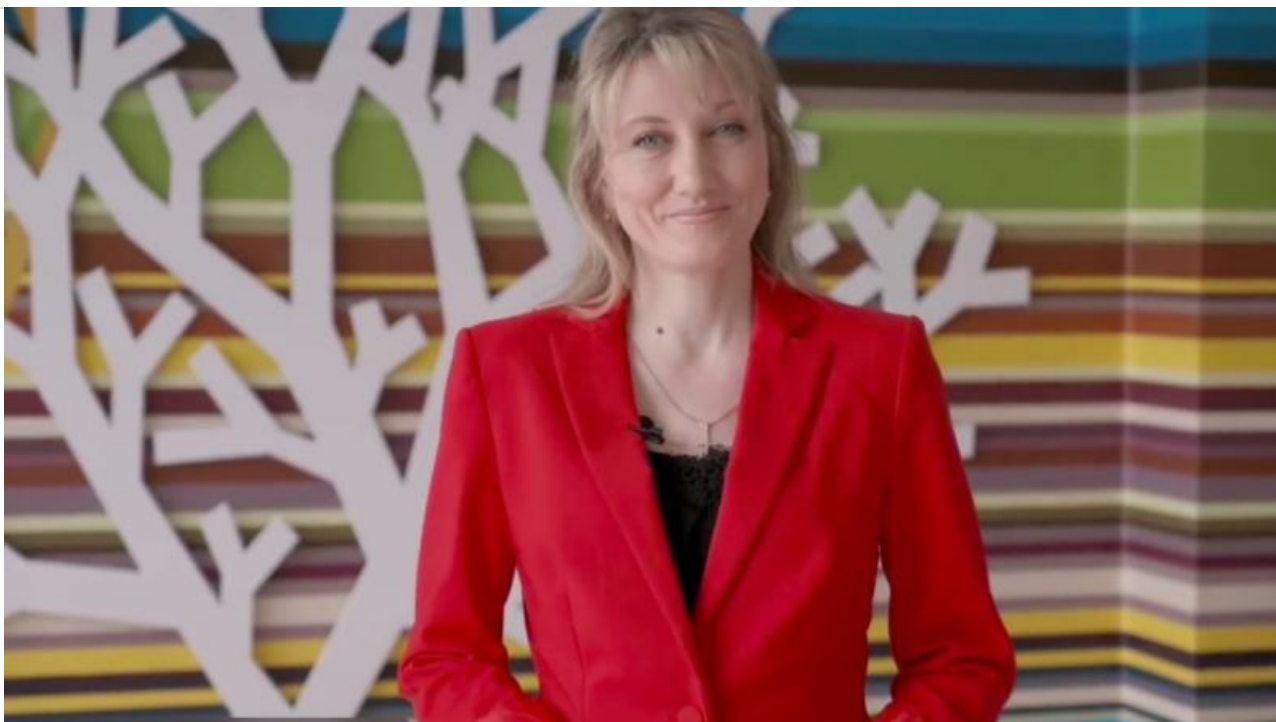
Фото: nashedelo.ru , Babr24.duma.tomsk.ru

Автор: Соня Совушкина © Babr24.com ОБРАЗОВАНИЕ, МОЛОДЕЖЬ, ОБЩЕСТВО, ТОМСК 👁 58278 28.02.2023, 18:03 📄 604