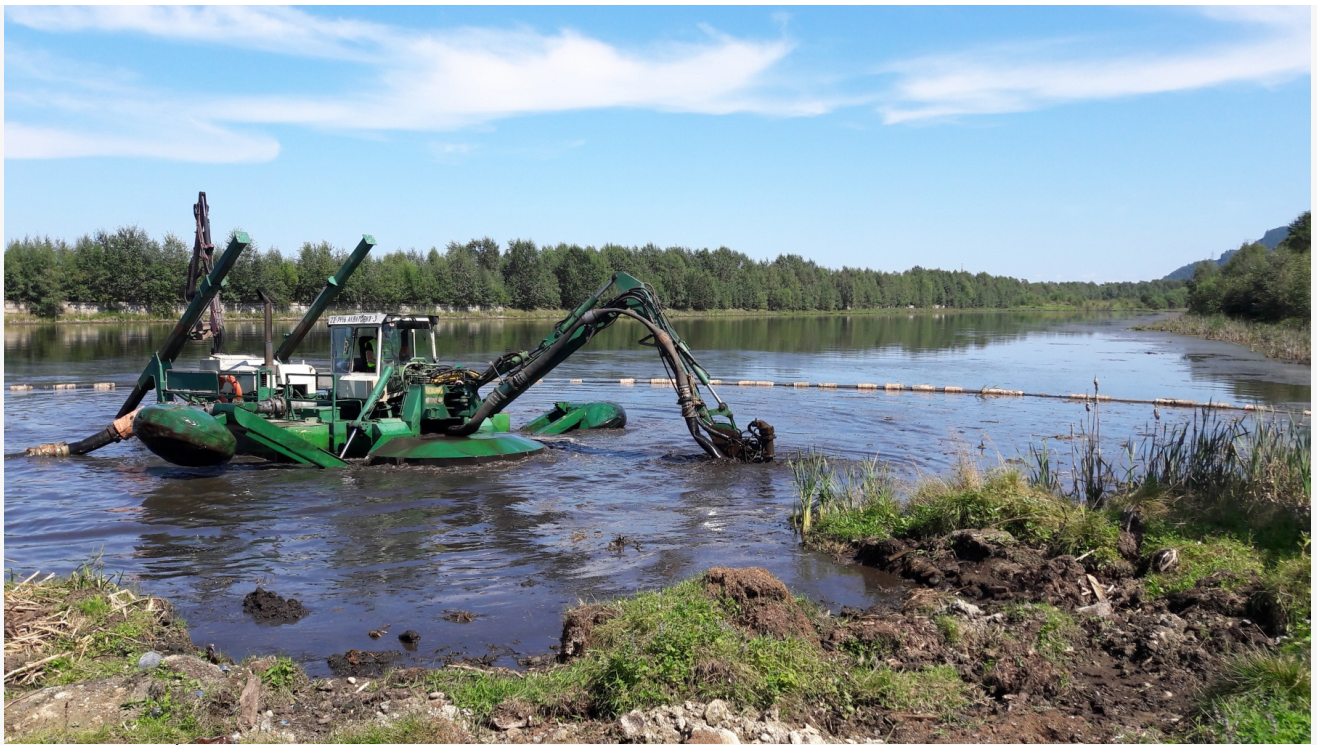
Фото из альбома "Иркутская область. Байкальск. БЦБК" © Фотобанк "RuVabr"

Байкальск — уникальный город. Когда-то он был промышленным от и до, существовал для нужд и за счет БЦБК, но после закрытия комбината стал искать себя. Теперь благодаря особому климату в этой точке Байкала и усилиям людей он создает себе новую репутацию — «клубничного рая» летом (выращивание клубники здесь стало повсеместным и чуть ли не основным способом заработка для жителей после ликвидации БЦБК) и горнолыжного центра региона с видом на озеро зимой.