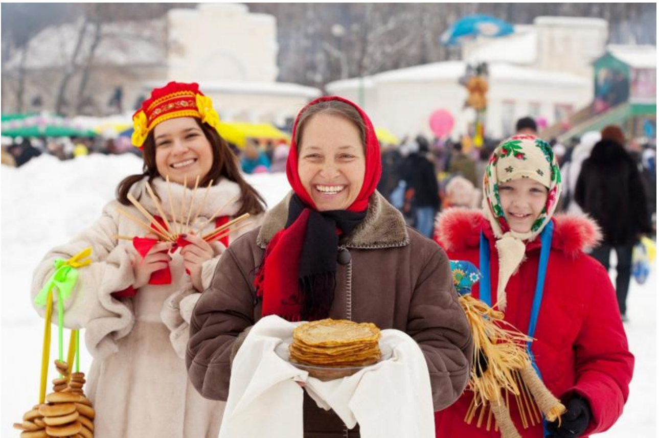
Воскресенье, или Проводы

Прощёное воскресенье в 2023 году празднуется 26 февраля. В этот день люди отпускают обиды и грехи всем тем, кто перед ними кается. А также сами просят прощения у ближнего и ходят в церковь. К этому дню, как правило, уже проведены все пышные гуляния и забавы, поэтому люди занимаются мирскими спокойными делами, а после обеда собираются на площади для проведения обряда сжигания чучела, хороводов, песен и совместных угощений. Воскресенье для всех считается самым главным днём масленицы, так как именно оно является переломным моментом для прощания с зимой и встречи весны.