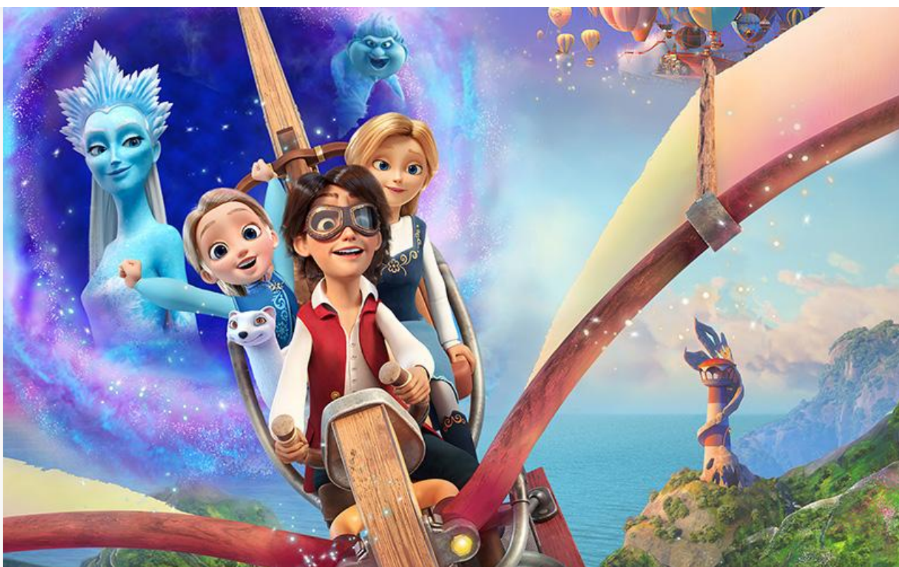
Постер к фильму «Снежная королева: Разморозка»

Также 16 февраля на российские экраны вышли мелодрама Романа Михайлова «Снег, сестра и росомеха» с Фёдором Лавровым и Кириллом Полухиным, драма Тины Масафовой Тембот (18+), комедийная мелодрама Элизы Мартиросян « Эта любовь », британский хоррор Риса Фрейк-Уотерфилда « Винни-Пух: Кровь и мёд » (18+), американская мелодрама Стивена Чейза « Любовь не купишь за деньги », американская фантастическая драма Когонады « После Янга », участвовавшая в программе «Особый взгляд» Каннского кинофестиваля, и фэнтезийная комедия Александра Лукина « Бугун-былыр ».