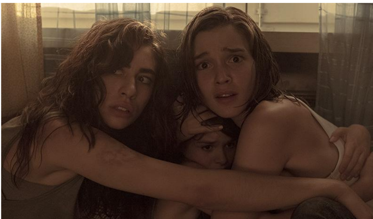
Кадр из фильма «Заклятье. Первое пробуждение»