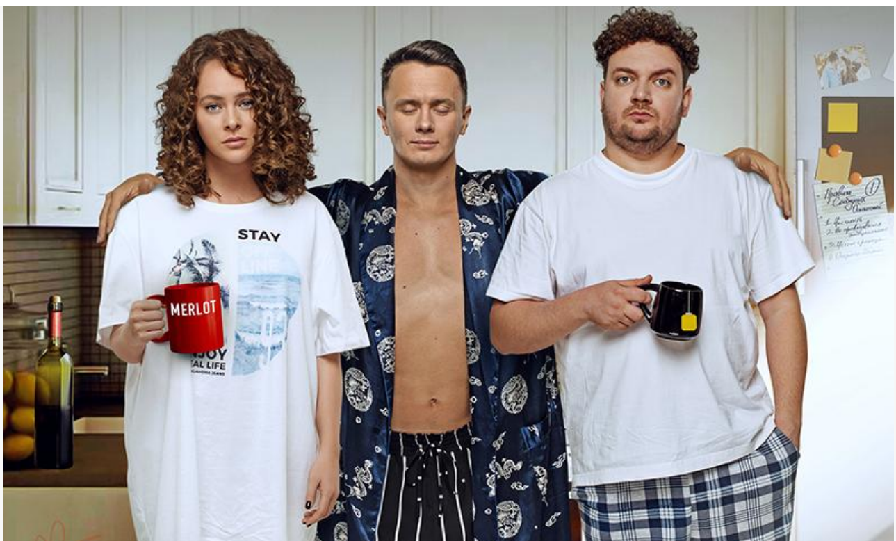
Постер к фильму «Свободные отношения»

Между ними расположился серебряный призёр прошлого уикенда – комедия Михаила Полякова «О чём говорят мужчины. Простые удовольствия» , потерявшая в сборах сразу 58 % и на 1978 экранах заработавшая 56,3 миллиона рублей.