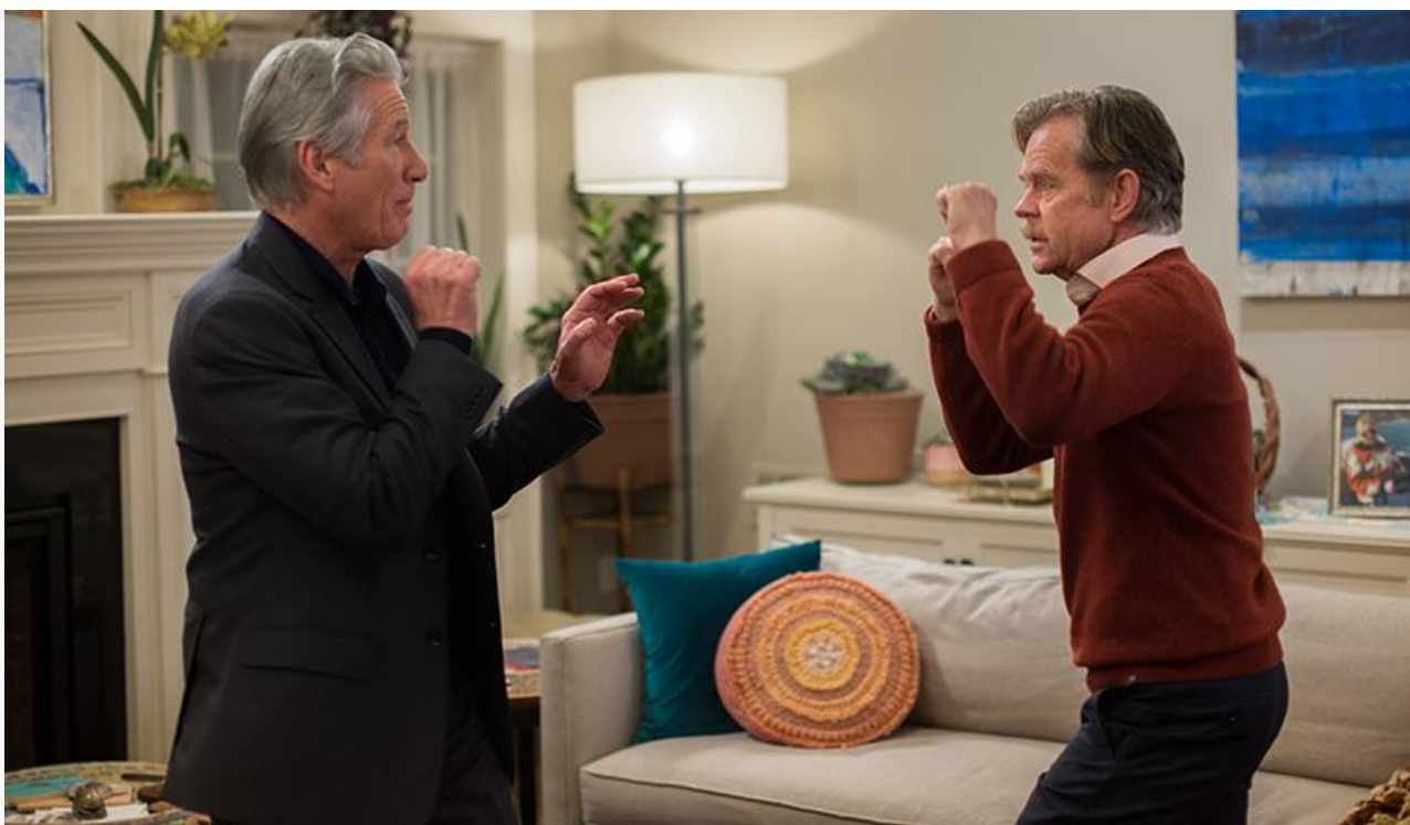
Кадр из фильма «Знакомство родителей»

Сохранили места в десятке лидеров проката мультфильм «Изумительный Морис» (35,8 миллиона и пятое место), шпионский боевик Гая Ричи «Операция „Фортуна“: Искусство побеждать» (28,8 миллиона и шестое место) и экшн-триллер «Крушение» (15,1 миллиона и восьмое место).