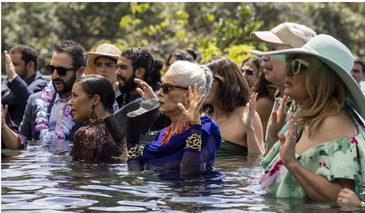
Кадр из фильма «Моя пиратская свадьба»