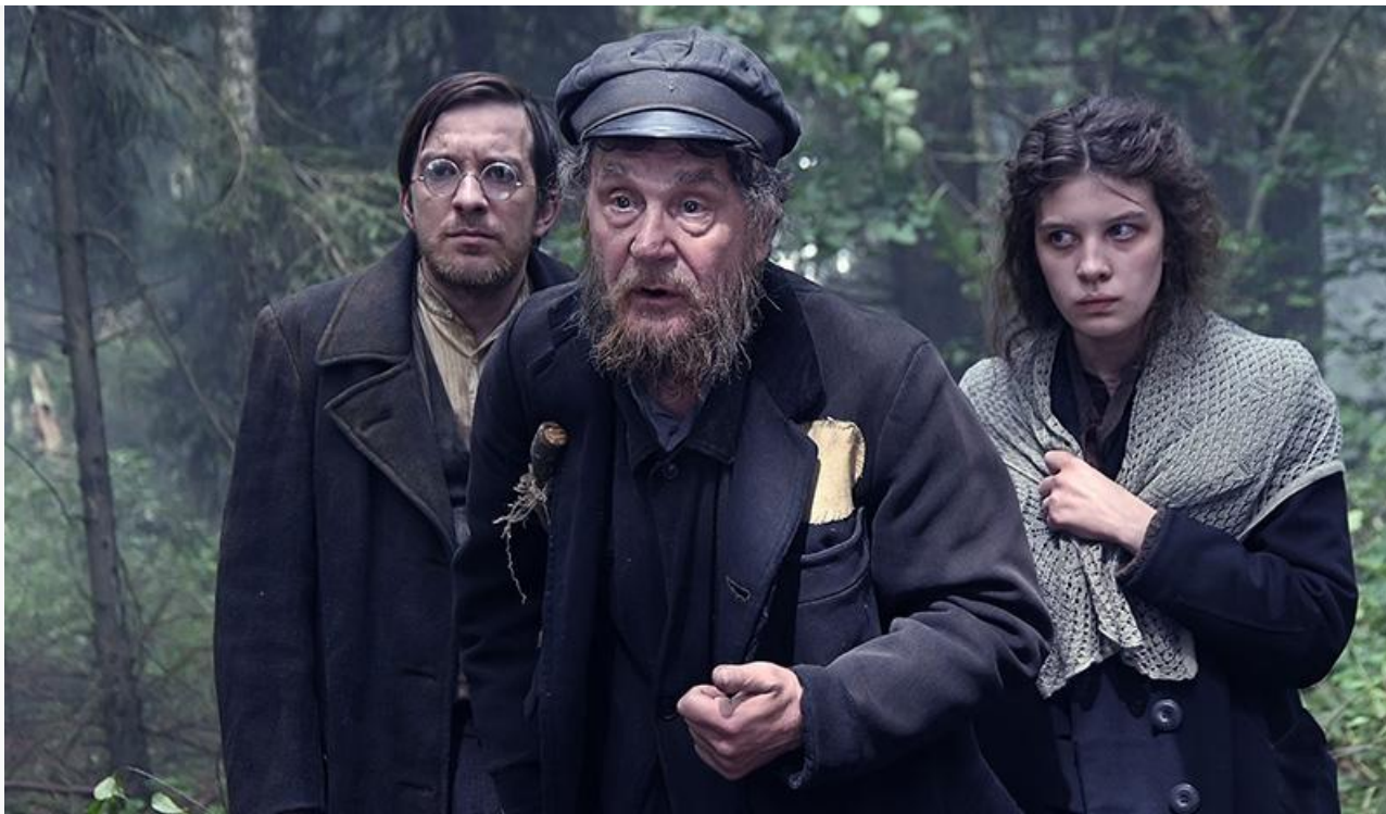
Кадр из фильма «Праведник»