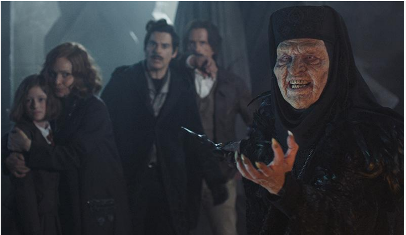
Кадр из фильма «Мой любимый призрак»

Общая касса топ-20 фильмов уикенда составила, по информации «Бюллетеня кинопрокатчика», 536 миллионов рублей. Это на 23 % меньше по сравнению с предыдущими выходными и на 24,2 % ниже показателей аналогичного уикенда прошлого года, когда на экраны вышел приключенческий боевик Рубена Фляйшера «Анчартед: На картах не значится», ставший впоследствии самым кассовым фильмом 2022 года в российском прокате.