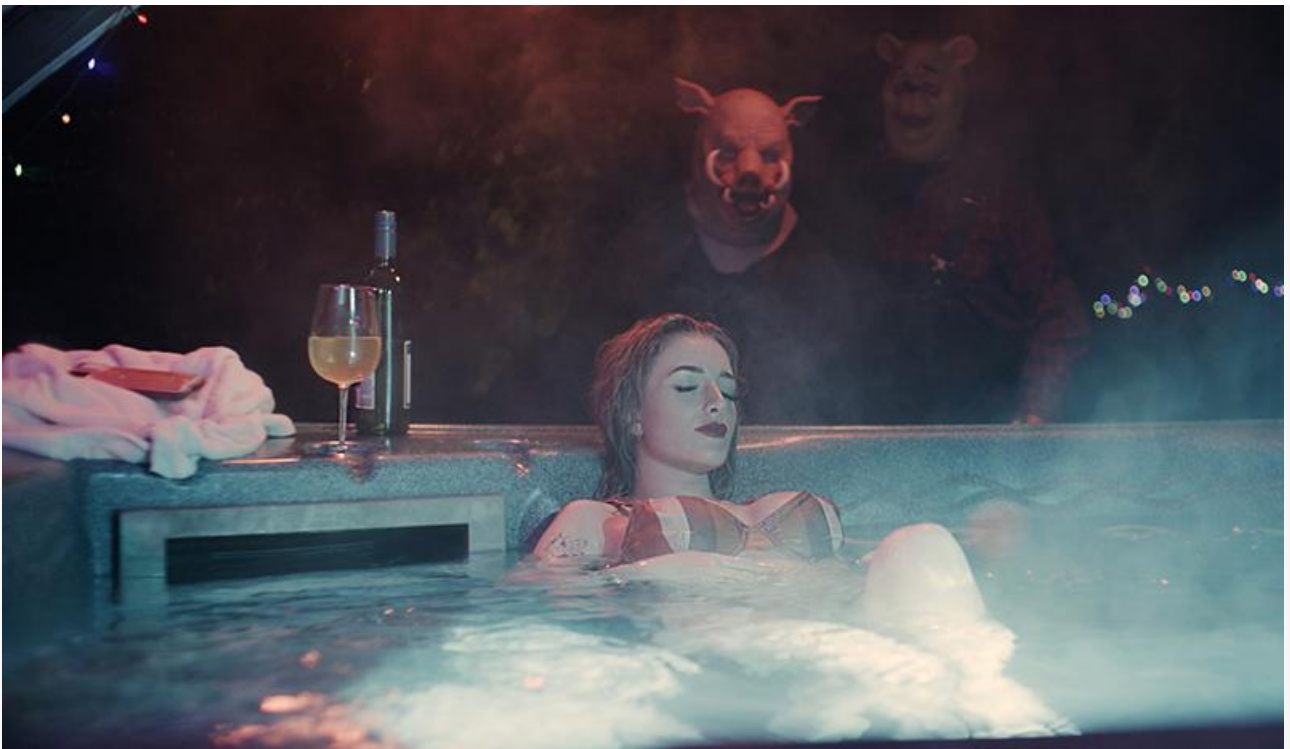
Кадр из фильма «Винни-Пух: Кровь и мёд»