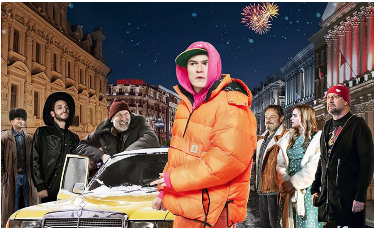
Постер к фильму «Быть»

Ещё три премьеры уикенда заняли седьмое, девятое и десятое места. Это комедийная мелодрама Майкла Джейкобса «Знакомство родителей» (23,3 миллиона), фэнтезийная комедия Себастьяна Нимана «Мой любимый призрак» (12,1 миллиона) и хоррор Оливера Парка «Заклятие Абизу» (11,3 миллиона рублей).