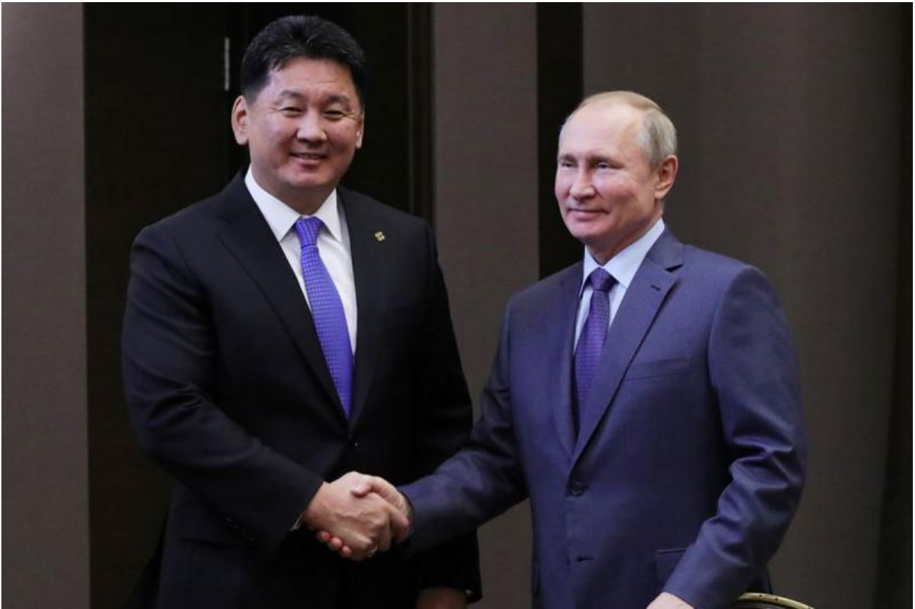
Ухнаагийн Хурэлсух с российским коллегой

И хотя по новым законам он не имеет права на переизбрание, то, как вольно правящая (и наследующая просоветским коммунистам) Монгольская народная партия обращается с Конституцией, настораживает. За неимением какой-либо исторической практики, предсказать, как поведет себя амбициозный, по президентским меркам молодой и во многом ориентирующийся на коллегу из России Хурэлсух, невозможно.