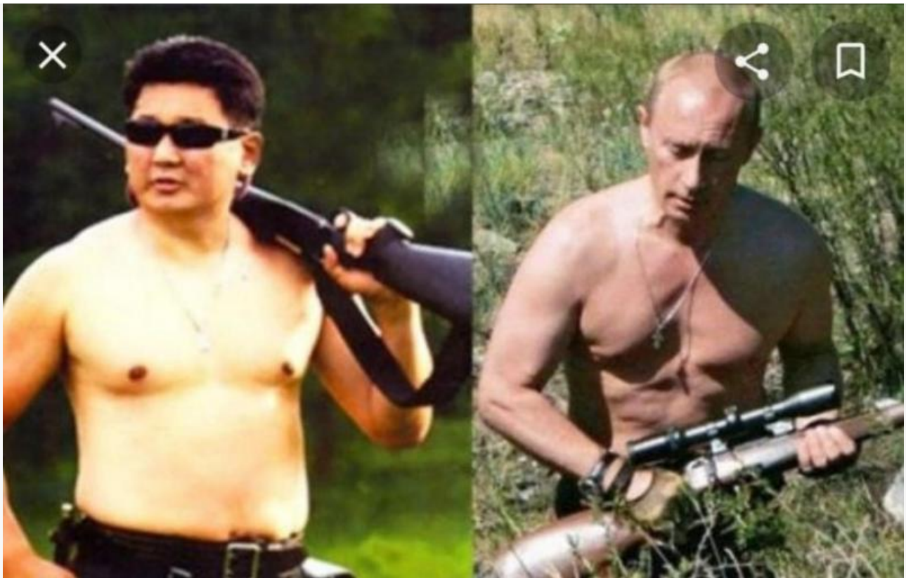
Ухнаагийн Хурэлсух косплеит российского коллегу

Судя по всему, нет большого одобрения потенциальному приезду Папы и в обществе — два опроса Бабра, в ноябре и в декабре, показали , что даже извинения не помогли Франциску вернуть себе пошатнувшуюся популярность. Несмотря на то что относиться к результатам таких опросов стоит с осторожностью, пугающая точность распределения процентов по вариантам ответов позволяет на них опираться. И вывод таков, что лишь 11% участников голосования смягчились по отношению к возможному визиту понтифика, тогда как большинство респондентов продолжает относиться к этой идее по меньшей мере прохладно.