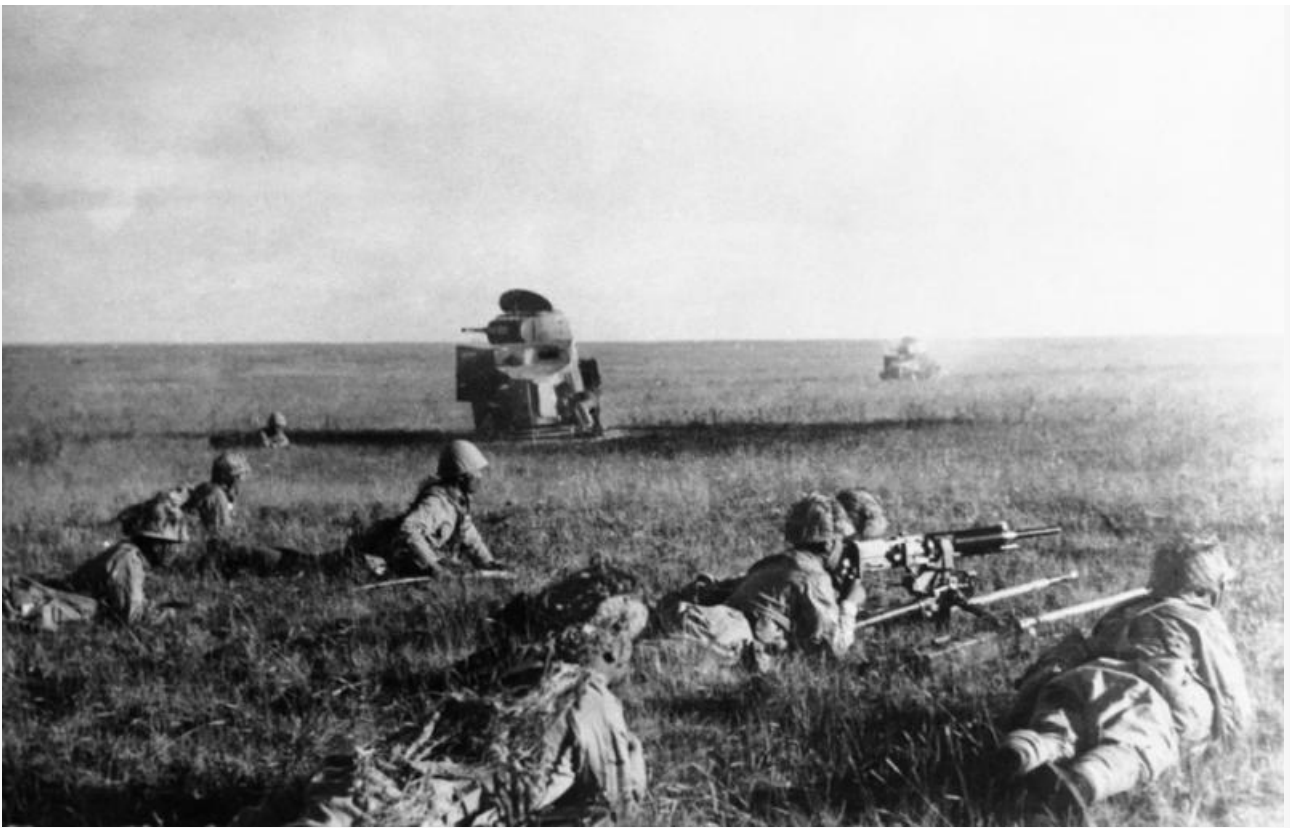
Бои на Халхин-Голе

Баргутские территории в Маньчжурии и государство Маньжоу-го во Внутренней Монголии, находившиеся под протекторатом Японии, исчезли в конце войны. Там оставалось небольшое количество японцев, но этот вопрос подняли гораздо позже, поскольку отношения между Китаем и Японией были прерваны.