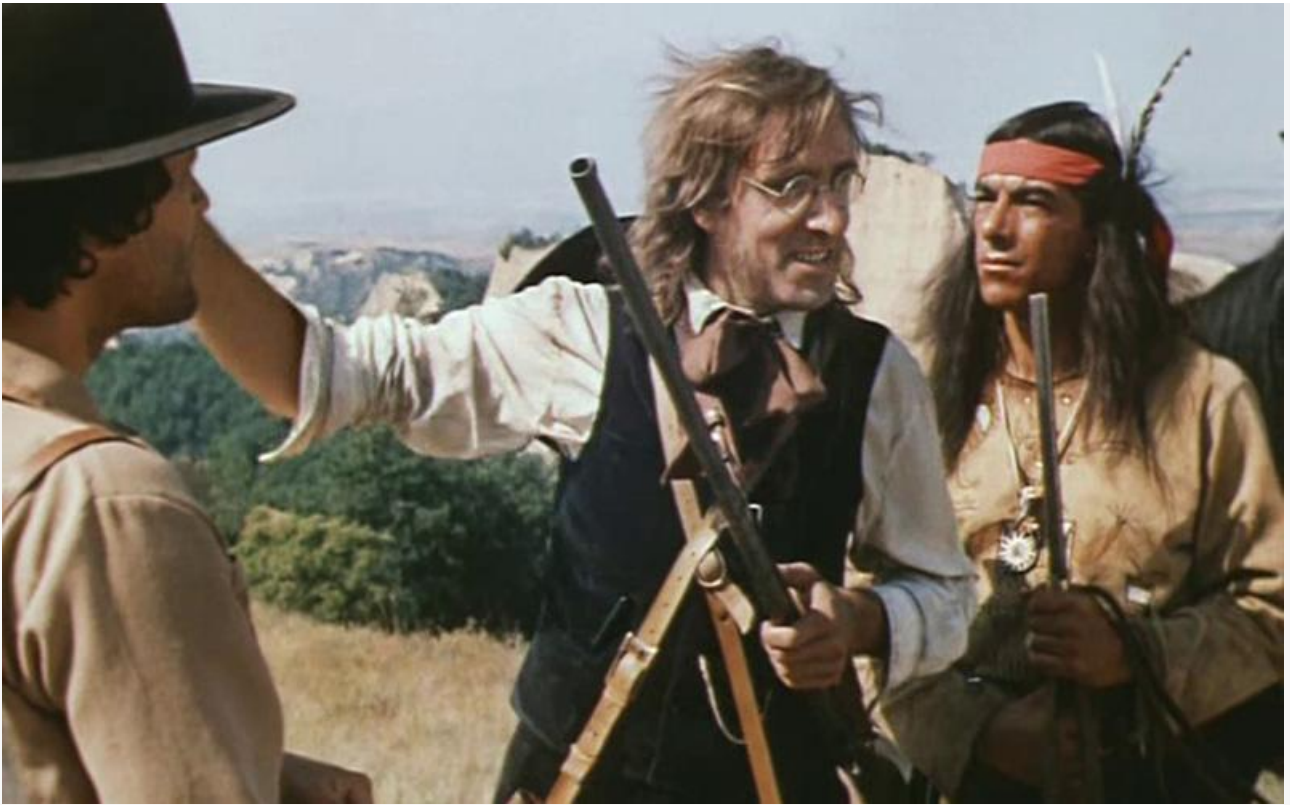
Кадр из фильма «В поисках капитана Гранта». СССР, 1985 год

Крупные воры всегда походят на честных людей... За честными-то физиономиями и надо следить в первую очередь.