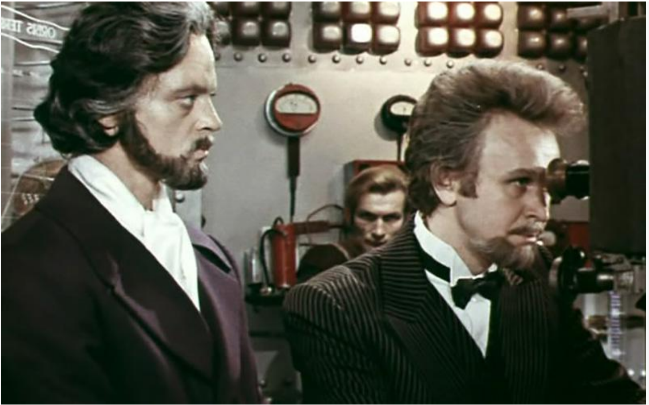
Кадр из фильма «Капитан Немо». СССР, 1975 год

Юбилеи писателей мы традиционно отмечаем публикацией цитат из их произведений. Сегодня это фразы героев книг Жюль Верна «Таинственный остров», «Дети капитана Гранта», «Двадцать тысяч лье под водой» и самого остроумного романа писателя – «Вокруг света за 80 дней».