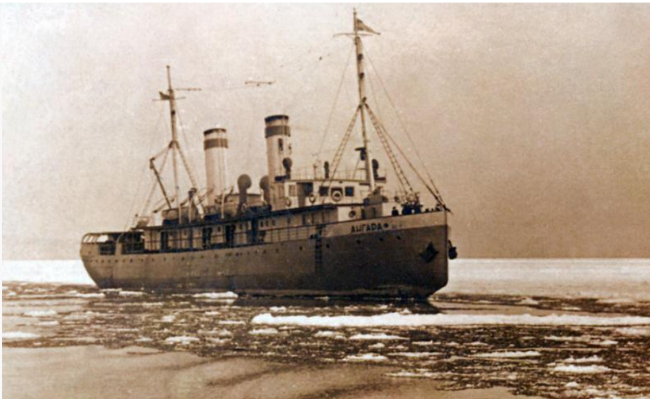
Ледокол «Ангара», начало XX века

До ввода в эксплуатацию Кругобайкальской дороги в 1905 году «Ангара» и «Байкал» ежедневно совершали по два рейса между пристанями Байкал и Мысовая. В 1903 году ледокольная пристань была переведена в Танхой. Обычно ледоколы начинали ходить во второй половине апреля и заканчивали в середине января следующего года. В остальное время – в самые сильные морозы, когда ледоколы не могли одолеть лёд – по Байкалу ходили на лошадях.