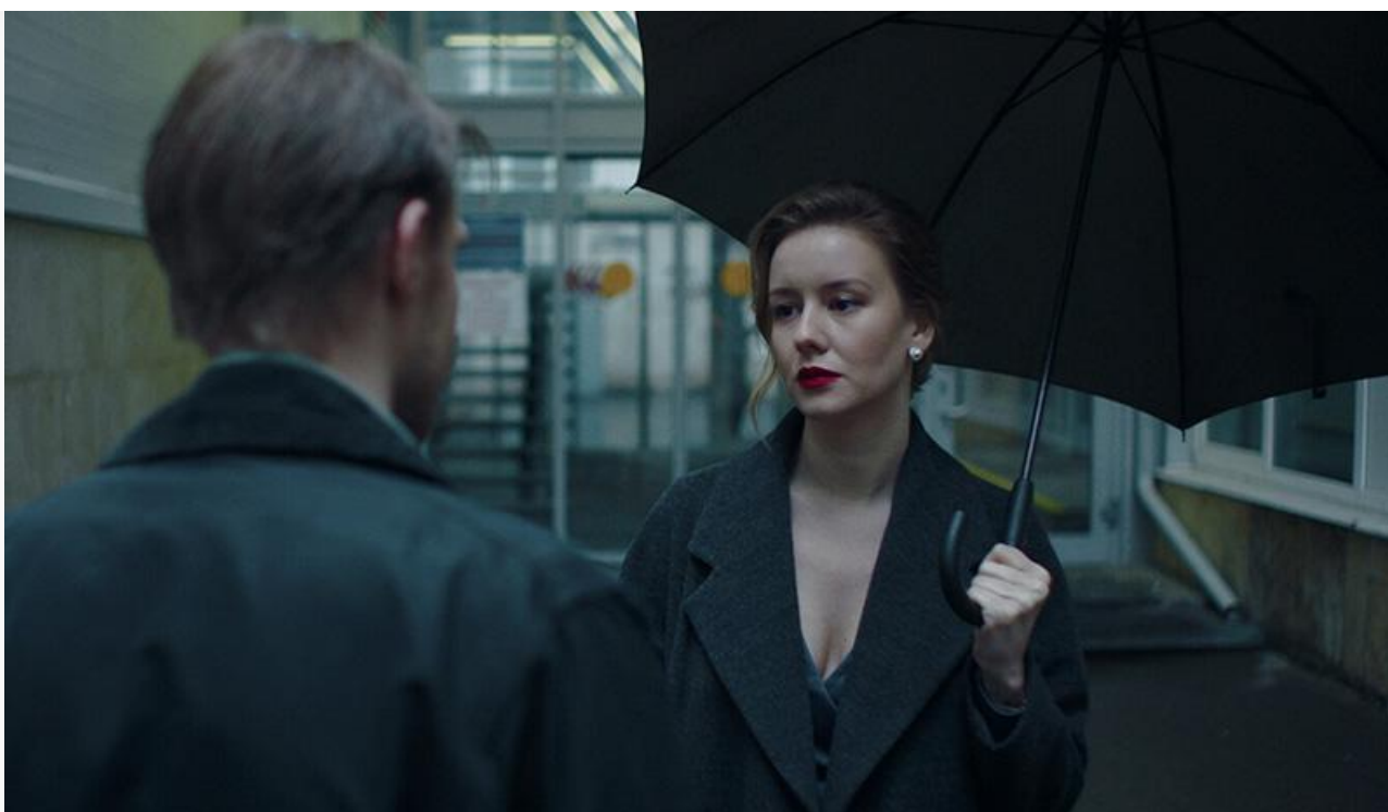
Ирина Старшенбаум в фильме «Здоровый человек»