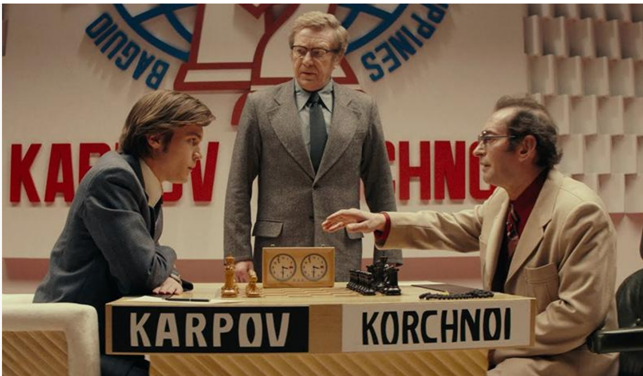
Кадр из фильма «Чемпион мира»

Примечательно, что фильм «Чемпион мира» был весьма холодно принят критиками, не смог окупиться в прокате и имеет посредственные рейтинги: зрительский 6,9 на портале «Кинопоиск» и рейтинг кинокритиков – всего 31 %. Вряд ли стоит сомневаться, что если бы картину сняла кинокомпания, не имеющая отношения к Никите Михалкову, то «Чемпиона мира» не было бы даже в номинантах.