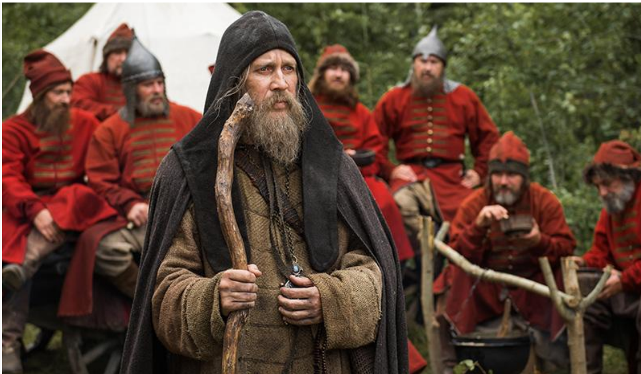
Евгений Миронов в фильме «Сердце пармы»

Драма Петра Тодоровского «Здоровый человек» выйдет в широкий прокат лишь в марте текущего года. При этом картина уже успела получить серебряного «Святого Георгия» Московского кинофестиваля в конце лета и трёх «Золотых орлов» в минувшую пятницу: за лучший сценарий ( Пётр Тодоровский ), за лучшую женскую роль ( Ирина Старшенбаум ) и за лучшую женскую роль второго плана ( Дарья Балабанова ).