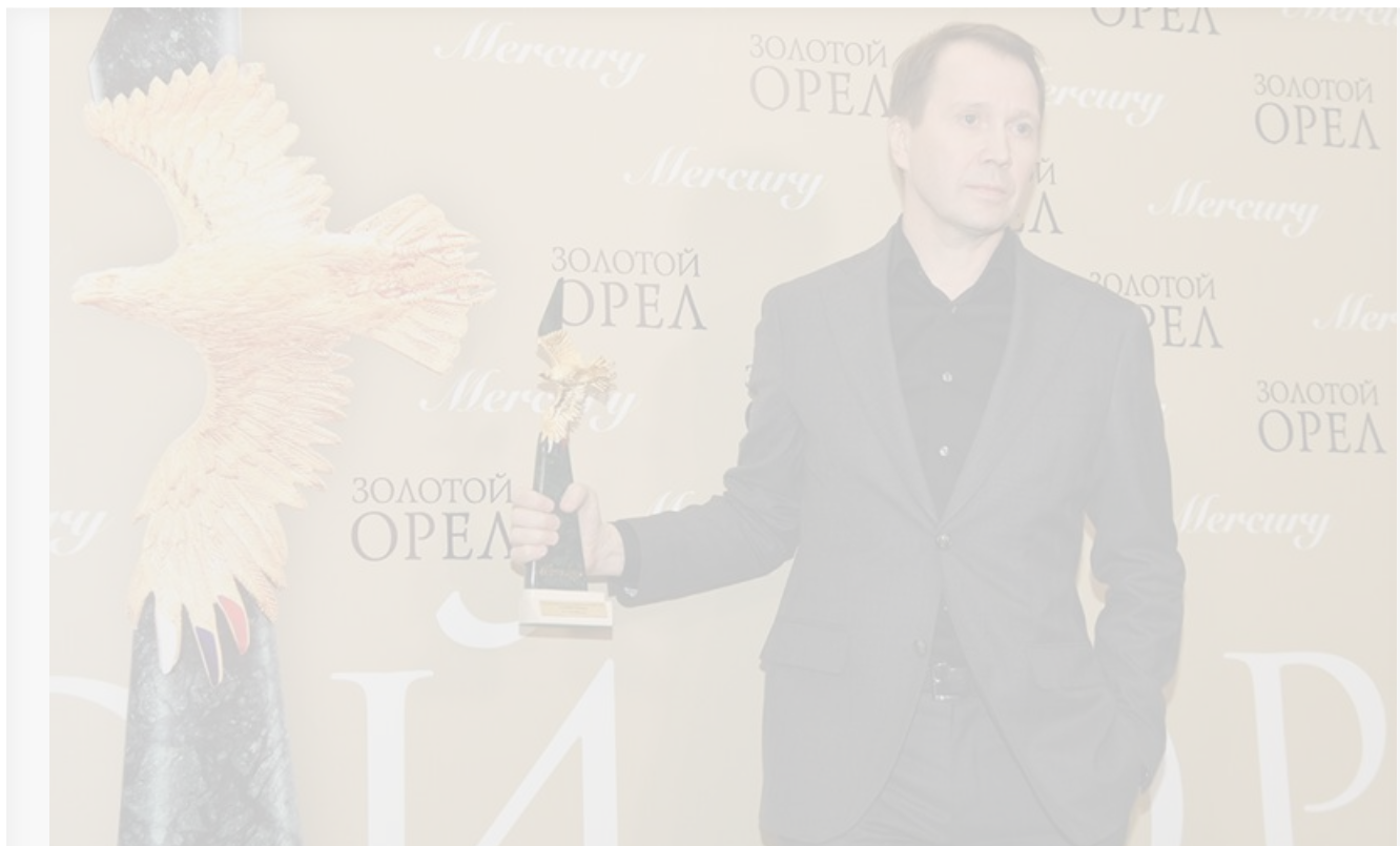
Евгений Миронов с премией «Золотой орёл»

В целом же атмосферу «Золотого орла» 2023 года как нельзя лучше передаёт выражение лица одного из самых именитых лауреатов, для которого статуэтка стала четвёртой в его блистательной карьере. Как говорится, ещё одна, и поднимется до уровня Михалковой.