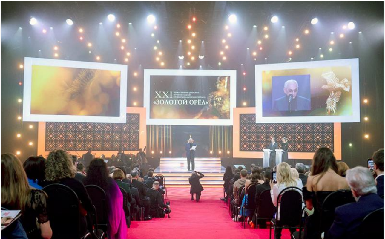
XXI церемония вручения премии «Золотой орёл»

Не обошлось и без неожиданных казусов. Некоторые «Орлы» прилетели в руки актёрам с весьма противоречивой гражданской позицией, что тут же вызвало негодование среди патриотически настроенной части общества. Возникли вопросы у «патриотов» и к некоторым личностям, вручающим награды. Если бы это была «Ника» – никто бы не удивился, но от академиков михалковского «Золотого орла» подобного вольнодумства явно не ожидали.