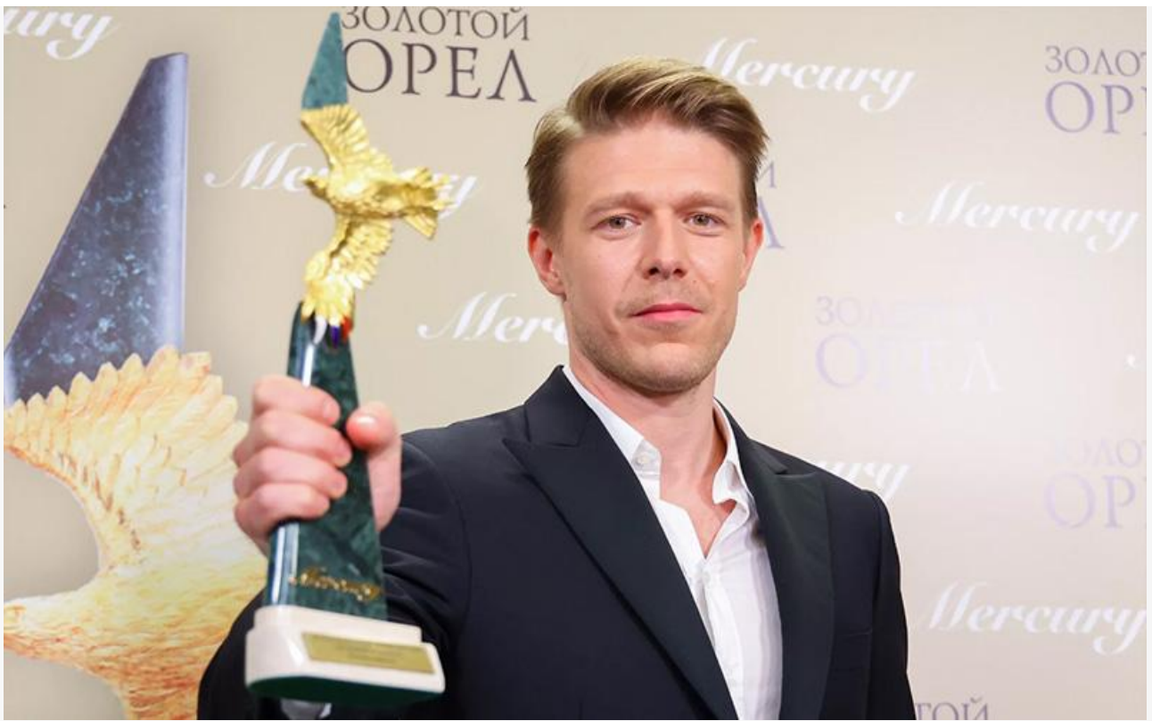
Никита Ефремов с премией «Золотой орёл»