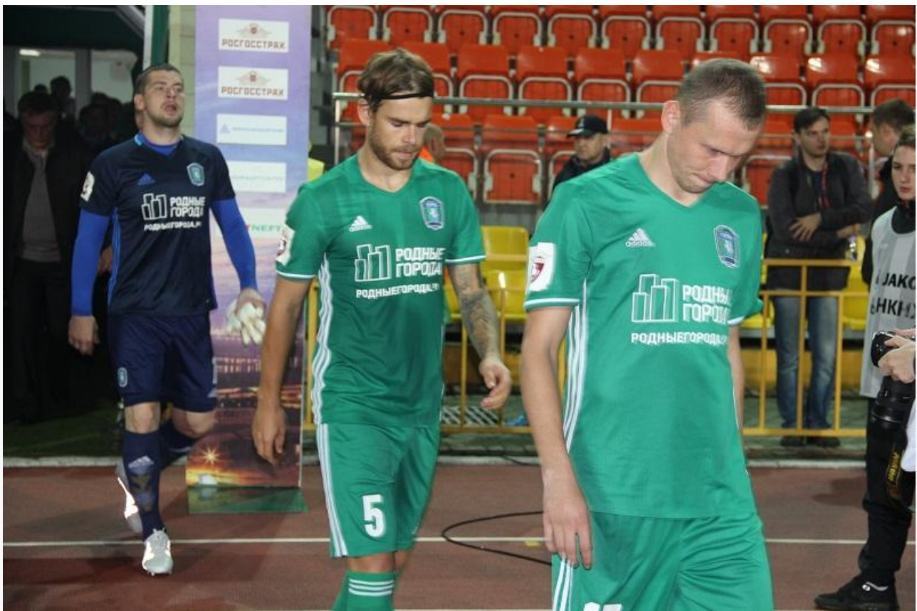
Игроки ФК «Томь» в новой форме, 2016 год

О тех самых тревожных новостях: в конце 2016 года экс-спортивный директор «Томи» Игорь Кудряшов сделал заявление о том, что футболисты клуба с 1 января 2017 года фактически могут уйти в свободное плавание. Наиболее высокооплачиваемым игрокам клуб самостоятельно подыскивал новые варианты трудоустройства, а остальных никто не держал.