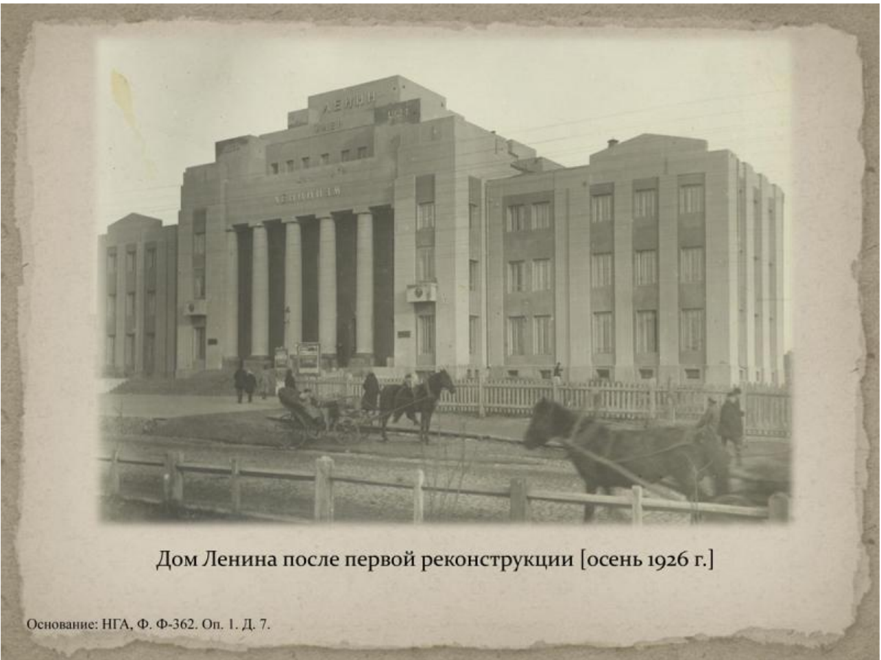
Дом Ленина после первой реконструкции [осень 1926 г.]