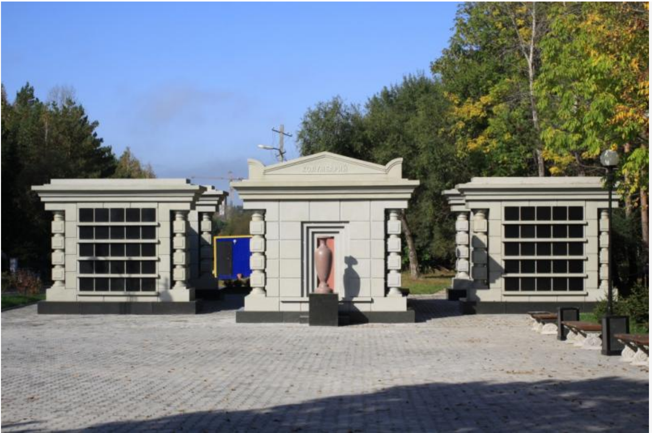
Муниципальный крематорий в Хабаровске