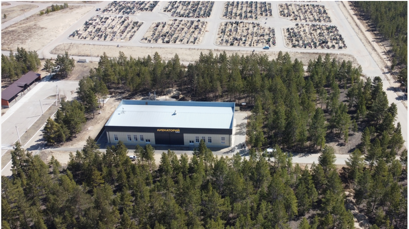
Автор: Аксель Дронов Фото из альбома "Улан-Удэ. Улан- Удэнский крематорий" © Фотобанк "RuBabr"

Но в результате бизнесмены из чиновников вышли слабоватые. Спрос на ячейки буквально нулевой. Городские депутаты, среди которых есть и предприниматели, также не предложили ничего дельного. Вместо снижения тарифов мэрия планирует построить второй колумбарий. Только тогда власти готовы снизить коэффициенты, сбалансировав их между двумя объектами. Но, скорее всего, оба объекта будут пустовать.