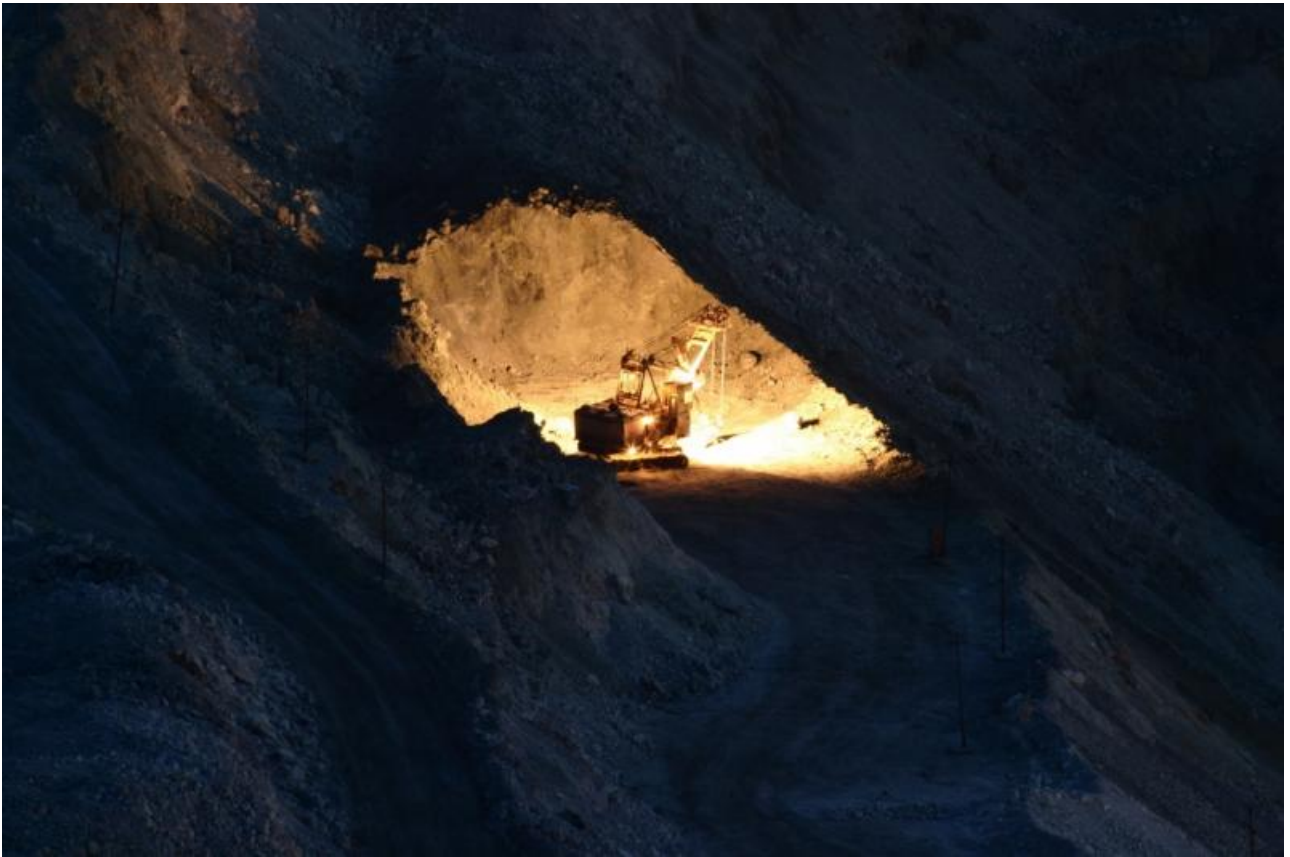
Фото: t.me/stopomerta , архив ПАО «Коршуновский ГОК»

Автор: Лилия Войнич © Babr24.com ЭКОНОМИКА И БИЗНЕС, ИРКУТСК 👁 34213 16.01.2023, 23:18 📄 427 URL: https://babr24.com/?IDE=240184 Bytes: 3827 / 3488 Версия для печати Скачать PDF