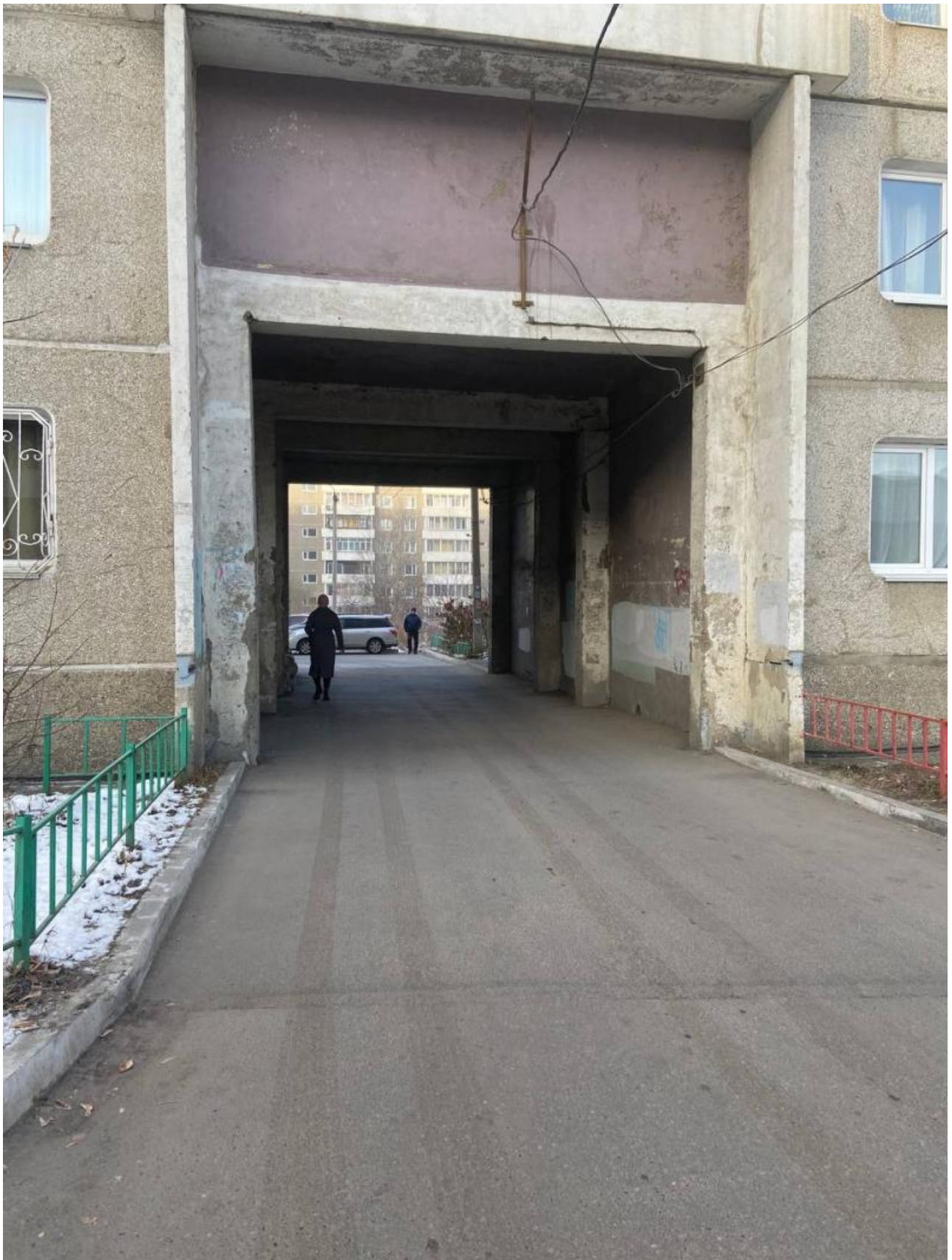
Фото со страницы Евгения Стекачёва в соцсетях

Автор: Алина Саратова © Babr24.com ОБЩЕСТВО, ИРКУТСК 👁 5191 29.12.2022, 10:49 🔄 281 URL: https://babr24.com/?IDE=239488 Bytes: 4049 / 3881 Версия для печати Скачать PDF