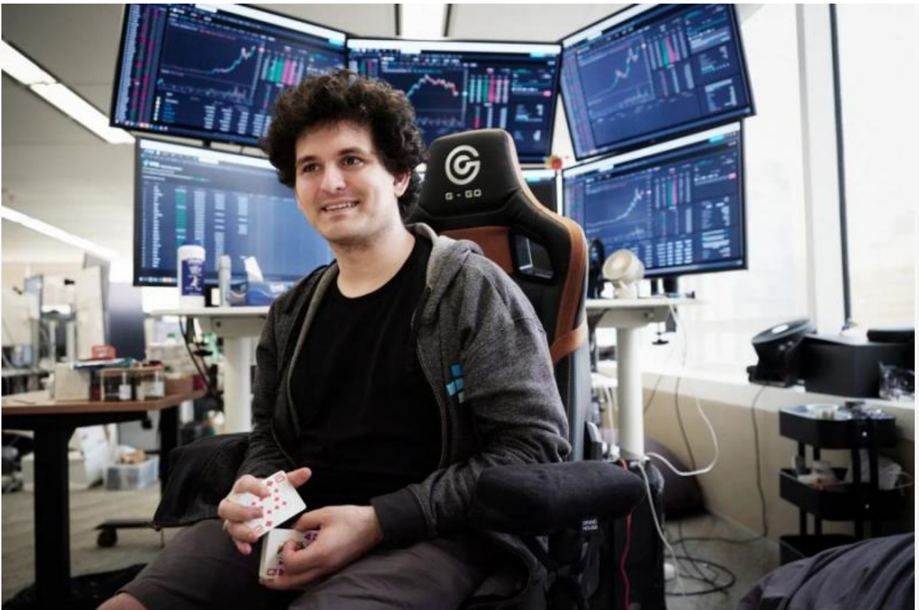
Владелец скандальной биржи FTX Сэмюэл Бэнкман-Фрид

FTX запустил цепную реакцию, и многие биржи по всему миру обанкротились. Например, 4 декабря нигерийские пользователи биржи AAX, которая ранее остановила все операции, включая снятие средств, ворвались в местные офисы и избili сотрудников. А гонконгская биржа Ноо удалила свой сайт — клиенты не могут вывести свои деньги. Подобные истории подорвали доверие инвесторов к криптоиндустрии, из-за чего криптовалютные компании сильно подешевели.