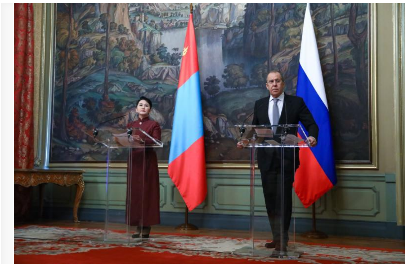
Совместная пресс-конференция министров иностранных дел Монголии и России — Батмунхийн Батцэцэг и Сергея Лаврова

Да, без российской нефти Монголии пока не прожить, но первые лица государства открыто заявляют о намерении слезть с этой иглы и готовы торговать сырьем даже с Австралией , лишь бы ослабить российское влияние, что уже довольно показательно.