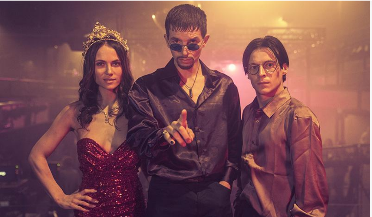
Кадр из фильма «Zillion. Клуб твоих грёз»