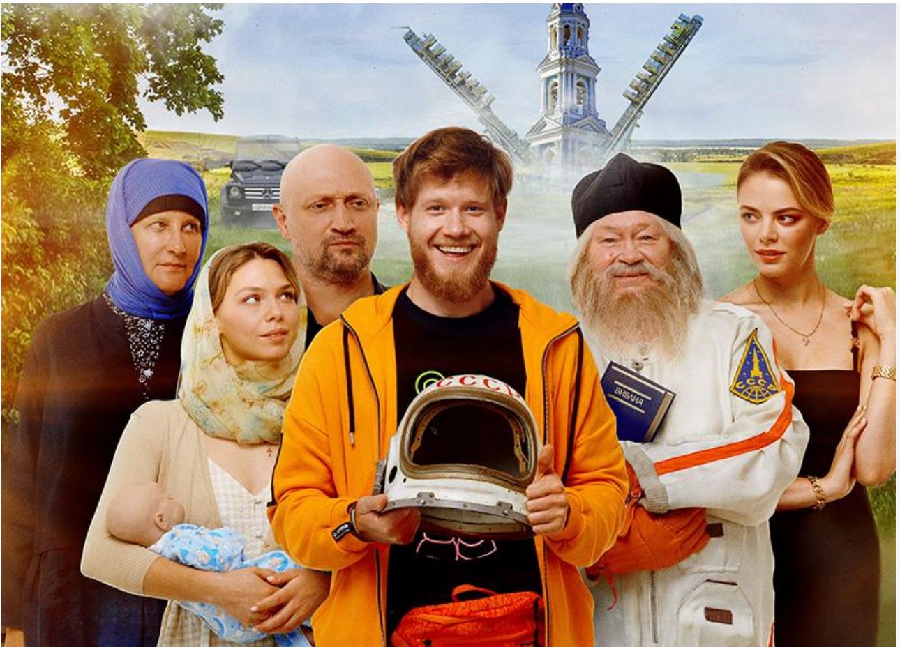
Постер к фильму «Непослушник 2»