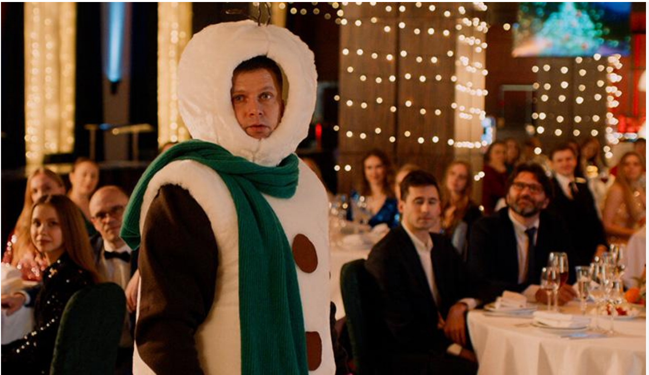
Кадр из фильма «Тайный Санта»

Продолжает удивлять «Треугольник печали» Рубена Эстлунда. В свой стартовый уикенд неделей ранее победитель Каннского кинофестиваля всего на 238 экранах заработал 15,1 миллиона рублей и неожиданно вошёл в топ-5 проката.