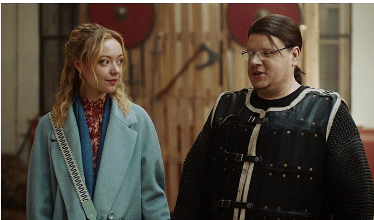
Кадр из фильма «Ёлки 9»