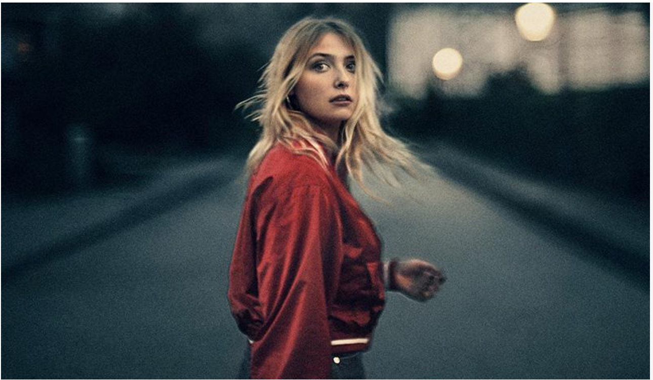
Постер к фильму «Таинственное убийство»

В формате переиздания зрители смогут вновь посмотреть на больших экранах биографическую драму Андрея Кончаловского 2019 года «Грех» с Альберто Тестоне в роли Микеланджело Буонаротти.