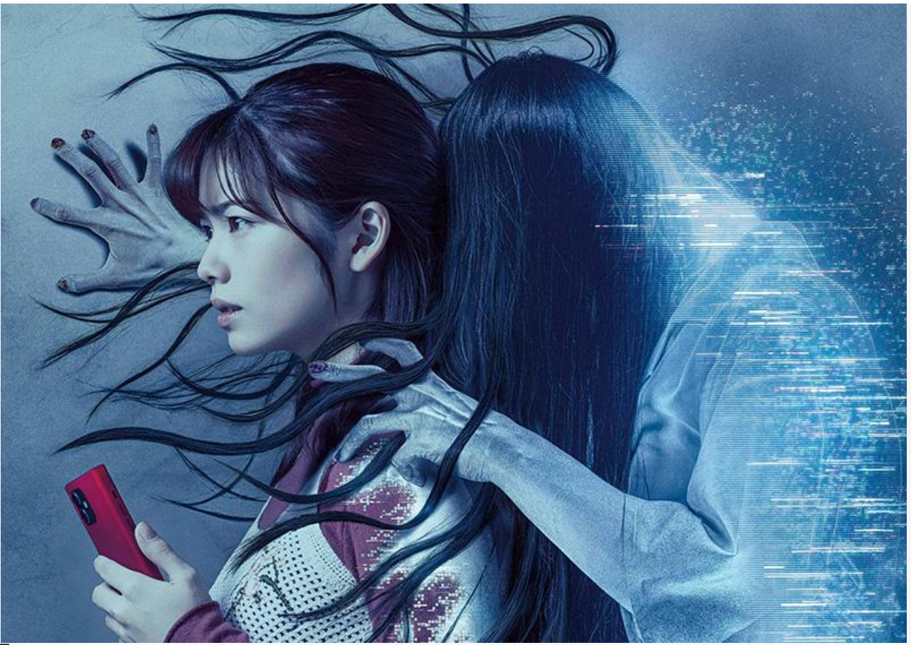
Постер к фильму «Проклятье: Разгадка»