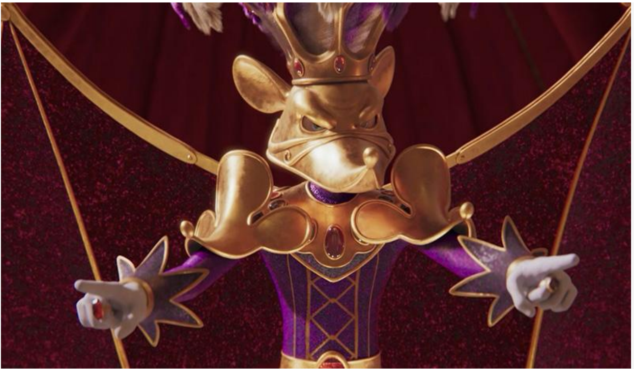
Кадр из фильма «Щелкунчик и волшебная флейта»