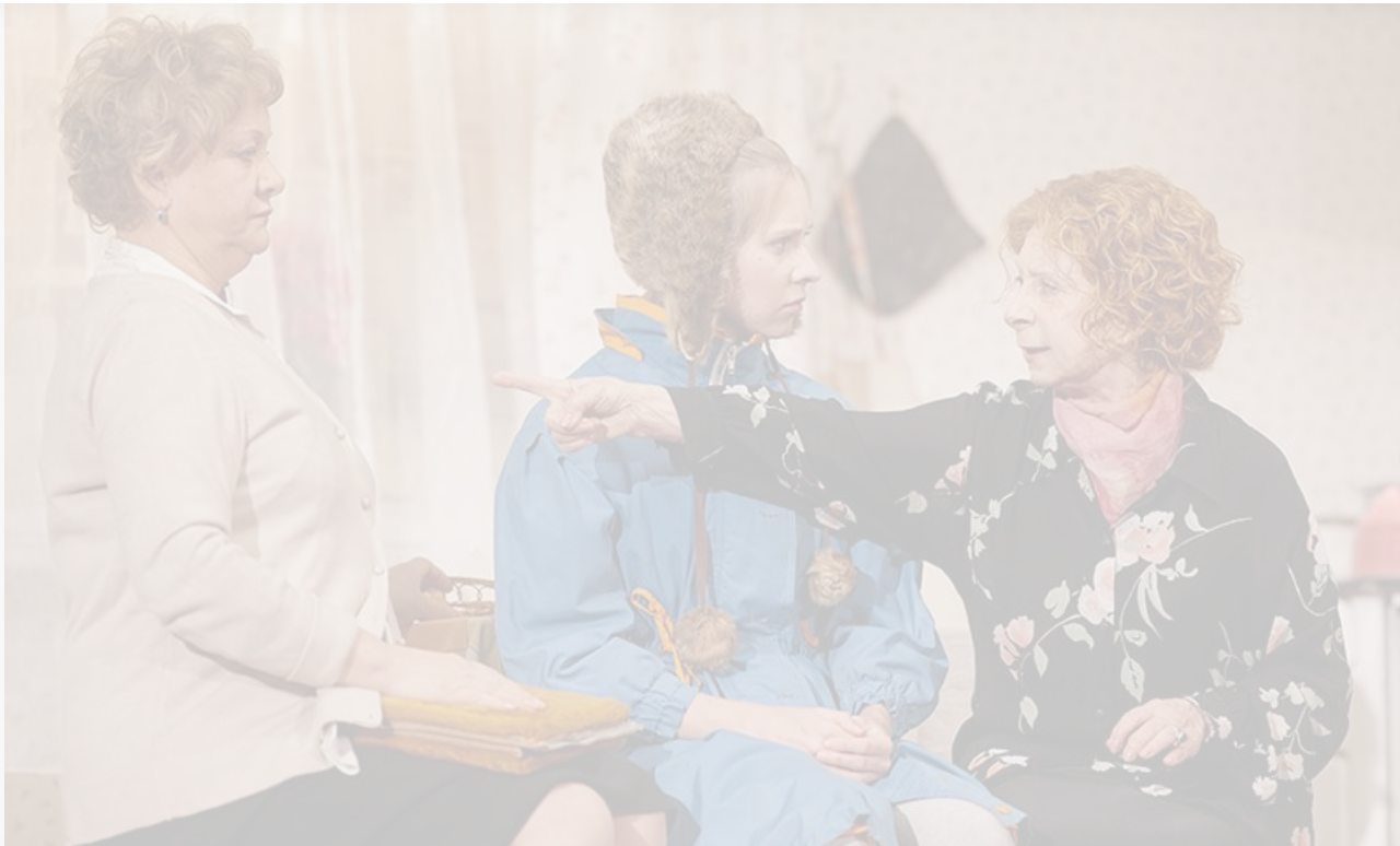
Сцена из спектакля «Мой внук Вениамин»