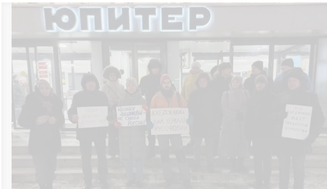
Пикет против спектакля «Мой внук Вениамин» в Нижнем Новгороде

Как сообщили местные СМИ, в постановке, заметьте, несанкционированного пикета перед Концертным залом «Юпитер», где 4 декабря игрался спектакль, было задействовано целых «более десяти человек». В качестве реквизита использовались плакаты «Позор врагам Отечества», «Лия Ах...! В России живёт – её и предаёт», «Ахеджакова как зеркало русофобии», «На Ахеджакову идут предатели Отечества» и, разумеется, «Предатели Родины, пошли вон из России».