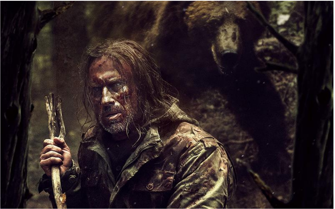
Постер к фильму «На ощупь»