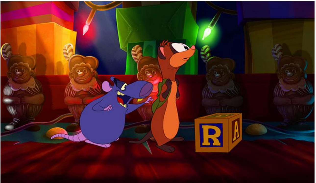
Кадр из фильма «Новогодний переполох»