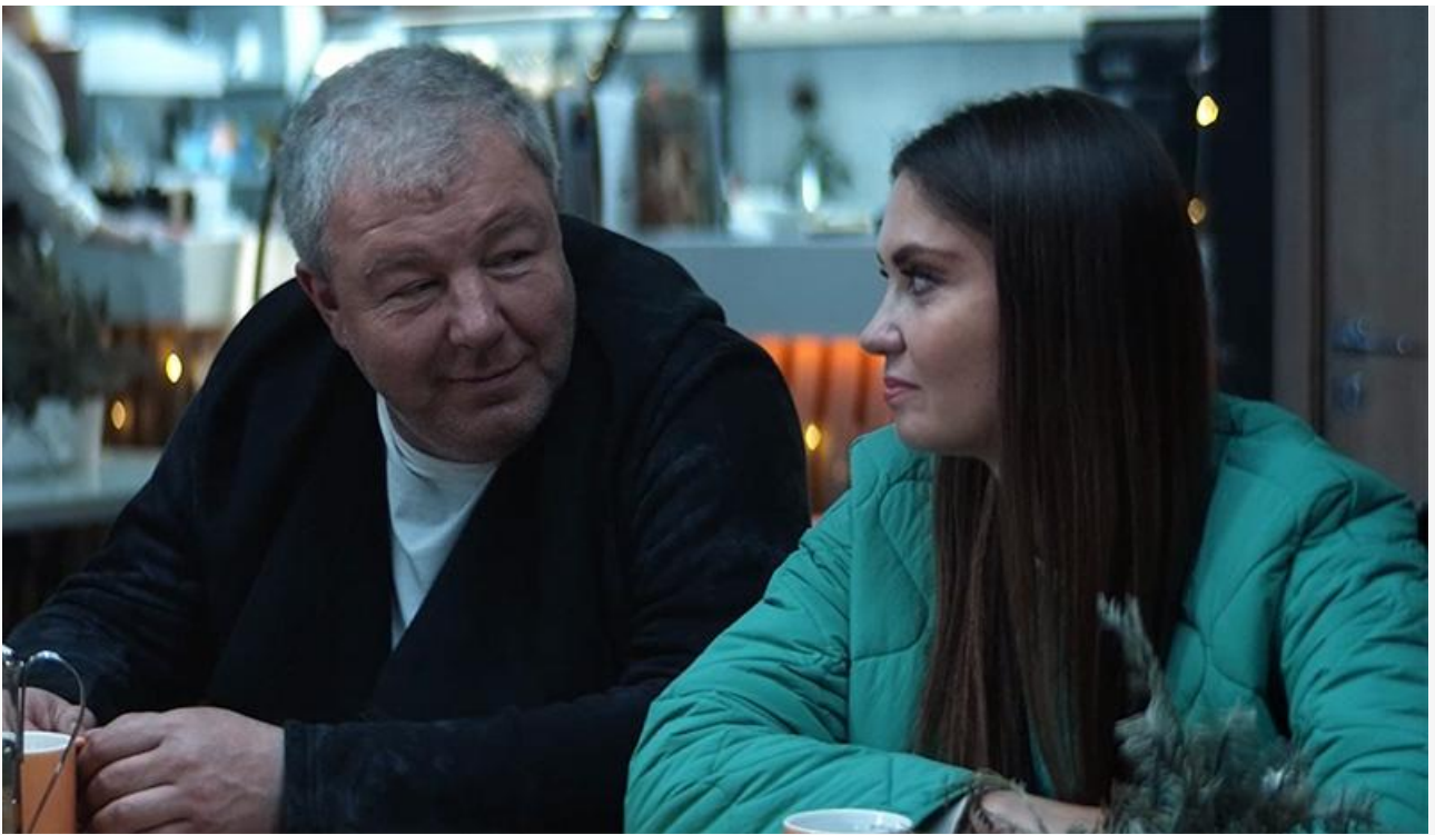
Кадр из фильма «Честный развод 2»