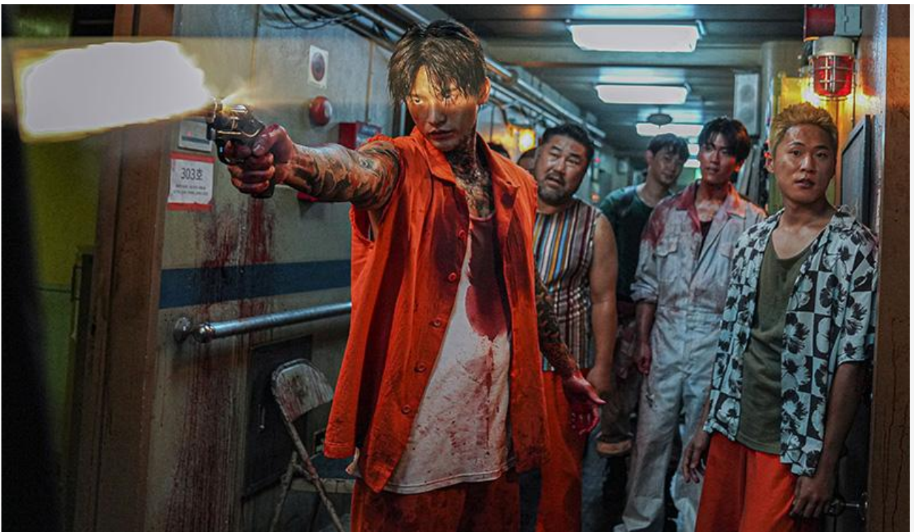
Кадр из фильма «Корабль в Пусан»