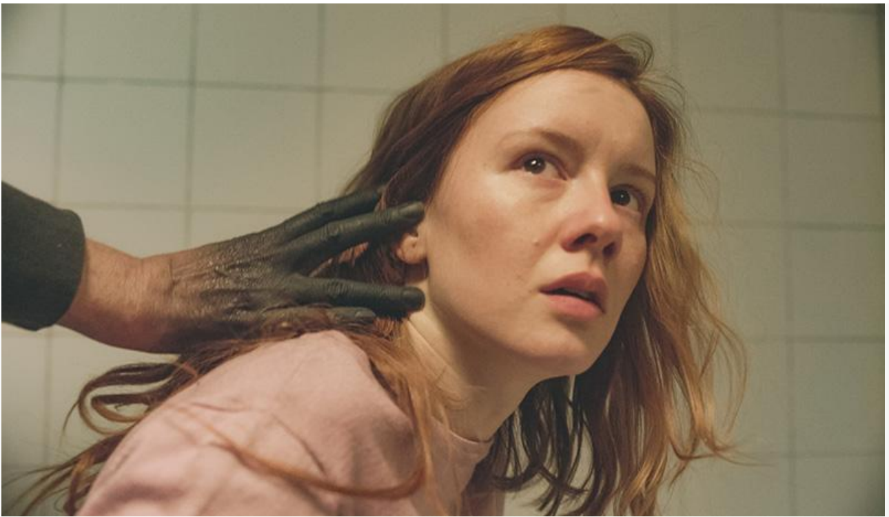
Кадр из фильма «Сёстры»