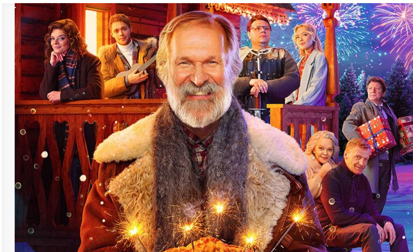
Постер к фильму «Ёлки 9»

По итогам стартового четверга на счету «Ёлок 9» уже 11,3 миллиона против 1,8 миллиона у «Сердца пармы» и 1,9 миллиона у двух других премьер уикенда, о которых будет сказано ниже.