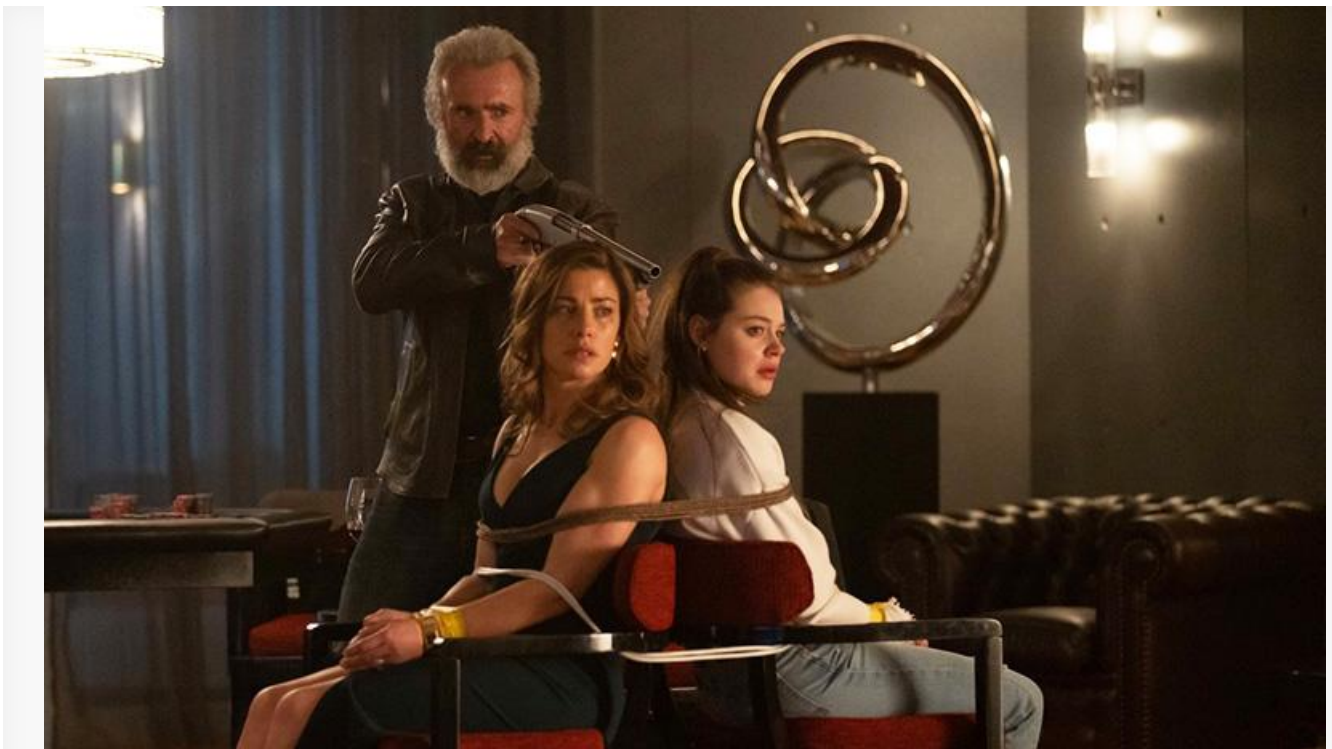
Кадр из фильма «Покерфейс»