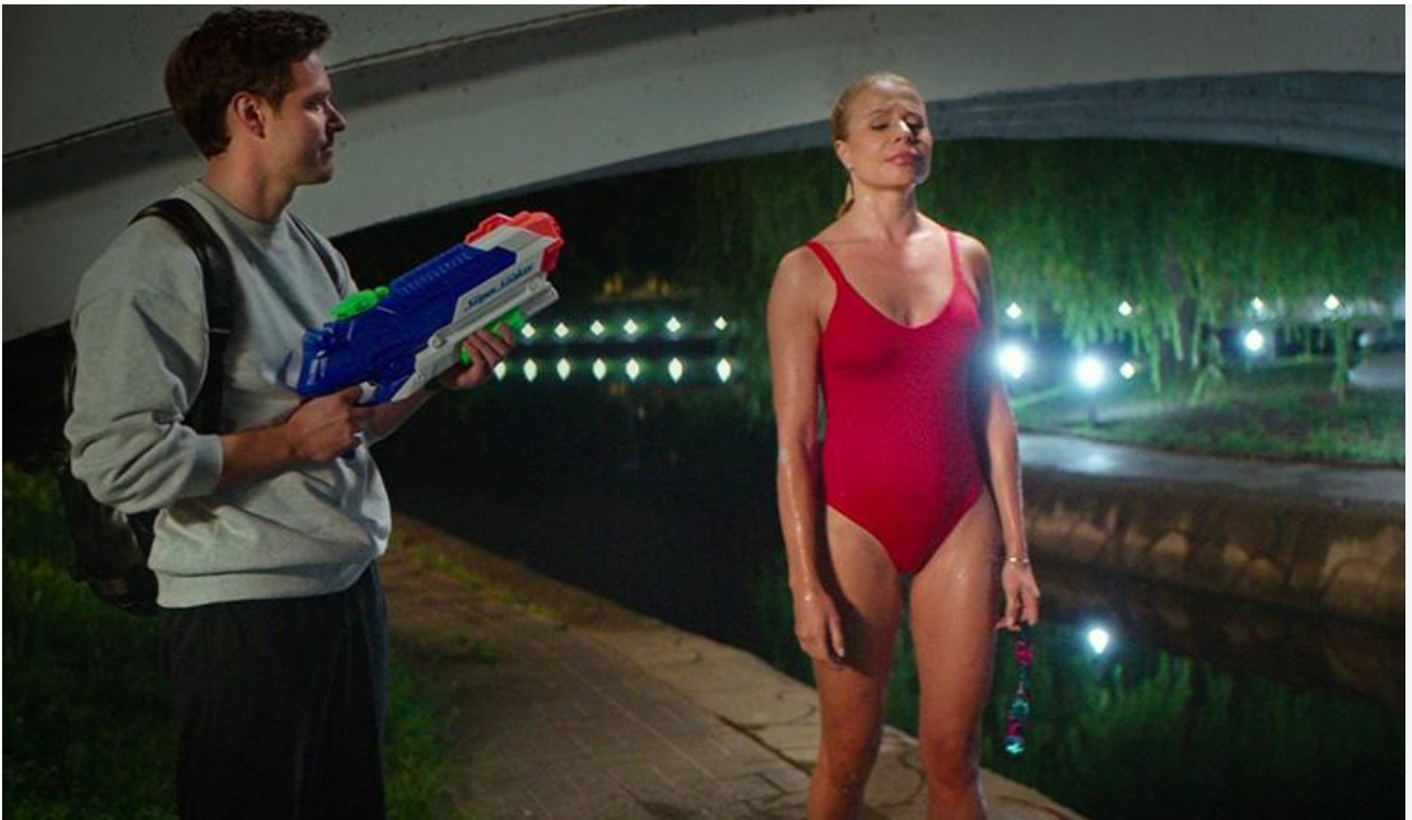
Кадр из фильма «Умная Маша»

Общая касса топ-20 фильмов уикенда, по информации «Бюллетеня кинопрокатчика», составила 239 миллионов рублей. Это на 11,4 % меньше по сравнению с предыдущими выходными и на 40,7 % ниже показателя аналогичного уикенда прошлого года.