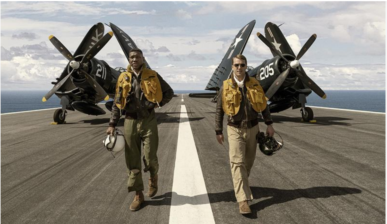
Кадр из фильма «Двойная петля»

Также на экраны 1 декабря вышли американский военный боевик Джастина Дилларда « Двойная петля », индонезийский хоррор Джоко Анвара « Заклятье: 13-й этаж » (18+), прошлогодний 47-минутный американский мультфильм « LOL. SURPRISE! Фильм », бельгийско-нидерландский мультфильм 2014 года « Новогодний переполох » и ещё один анимационный американец: « СантаМэн » Брета Штерна.