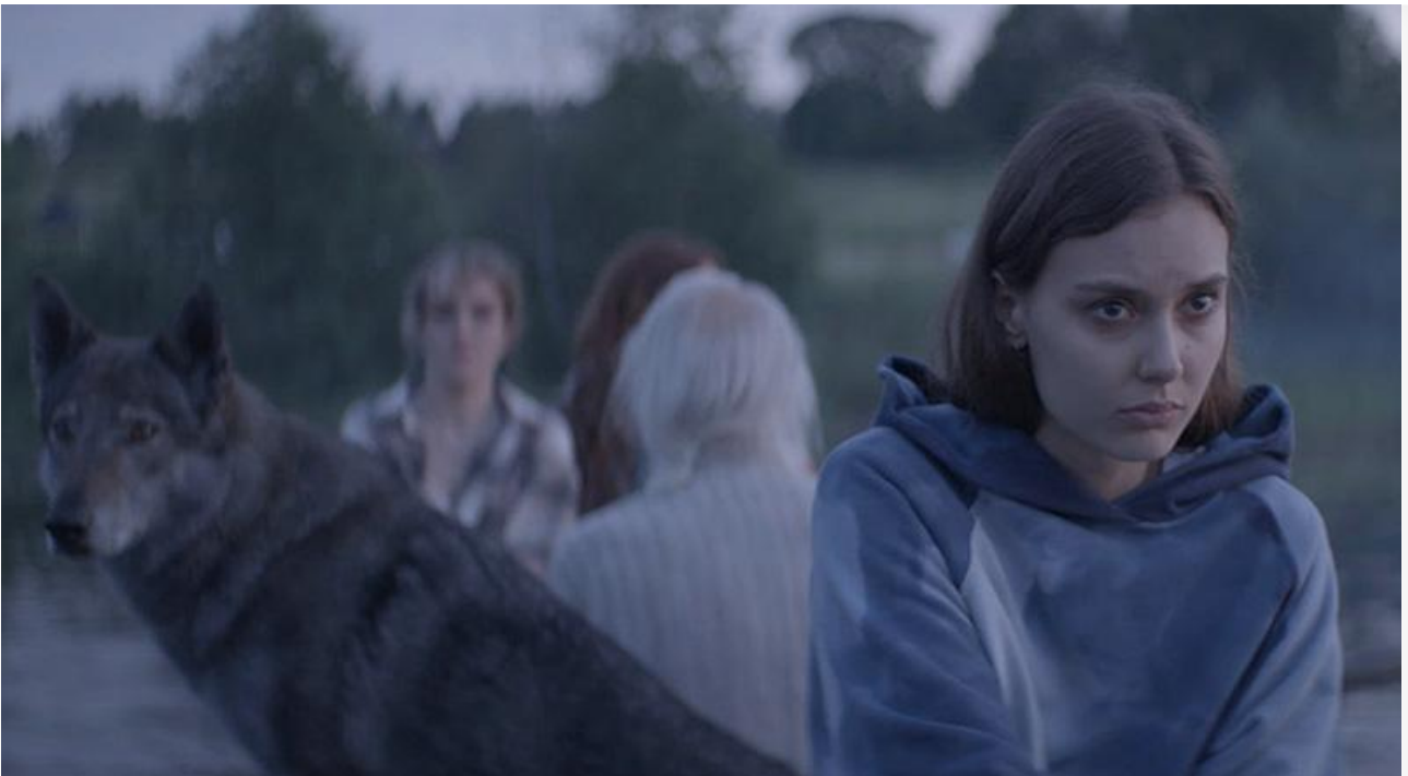
Кадр из фильма «Омут»