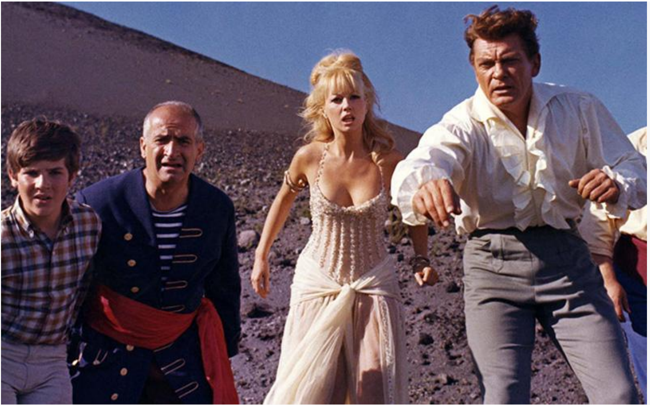
Элен в фильме «Фантомас разбушевался», 1965 год

После «Фантомаса» столь же знаковых ролей в фильмографии Демонжо не было, хотя актриса активно снималась до конца своих дней.