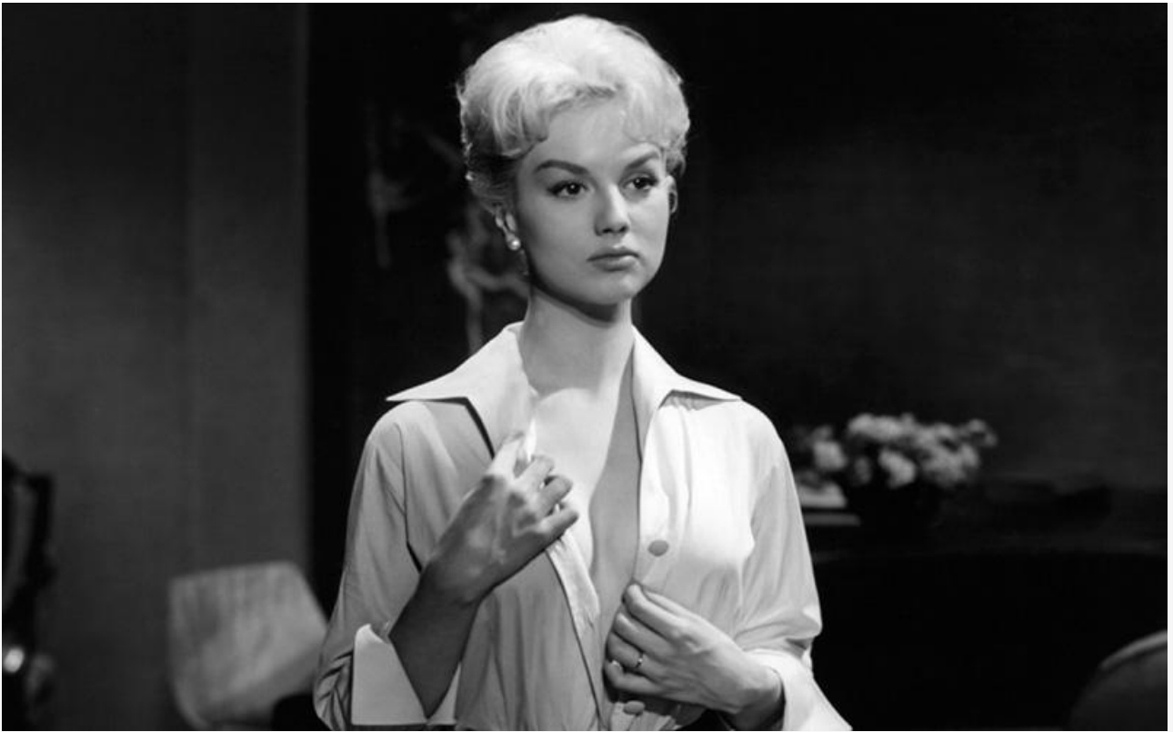
Сильви в фильме «Эта ночь», 1958 год