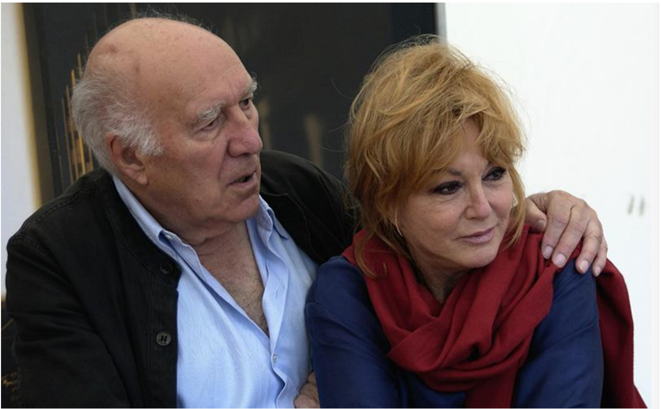
Тереза в фильме «Под крышами Парижа», 2007 год