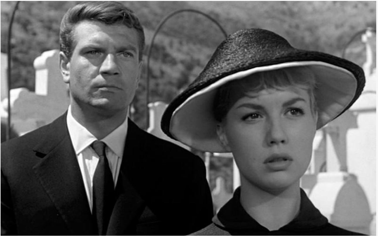
Ева в фильме «Нищий и красавица», 1957 год