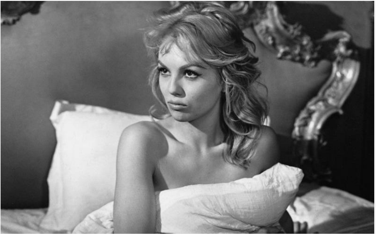
Лаура в фильме «Бурная ночь», 1959 год