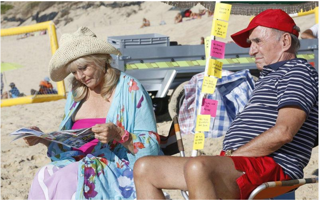
Лоретт Пик в фильме «Кемпинг 3», 2016 год