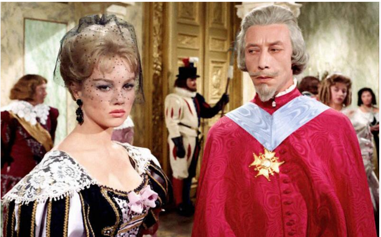
Миледи Винтер в фильме «Три мушкетёра», 1961 год