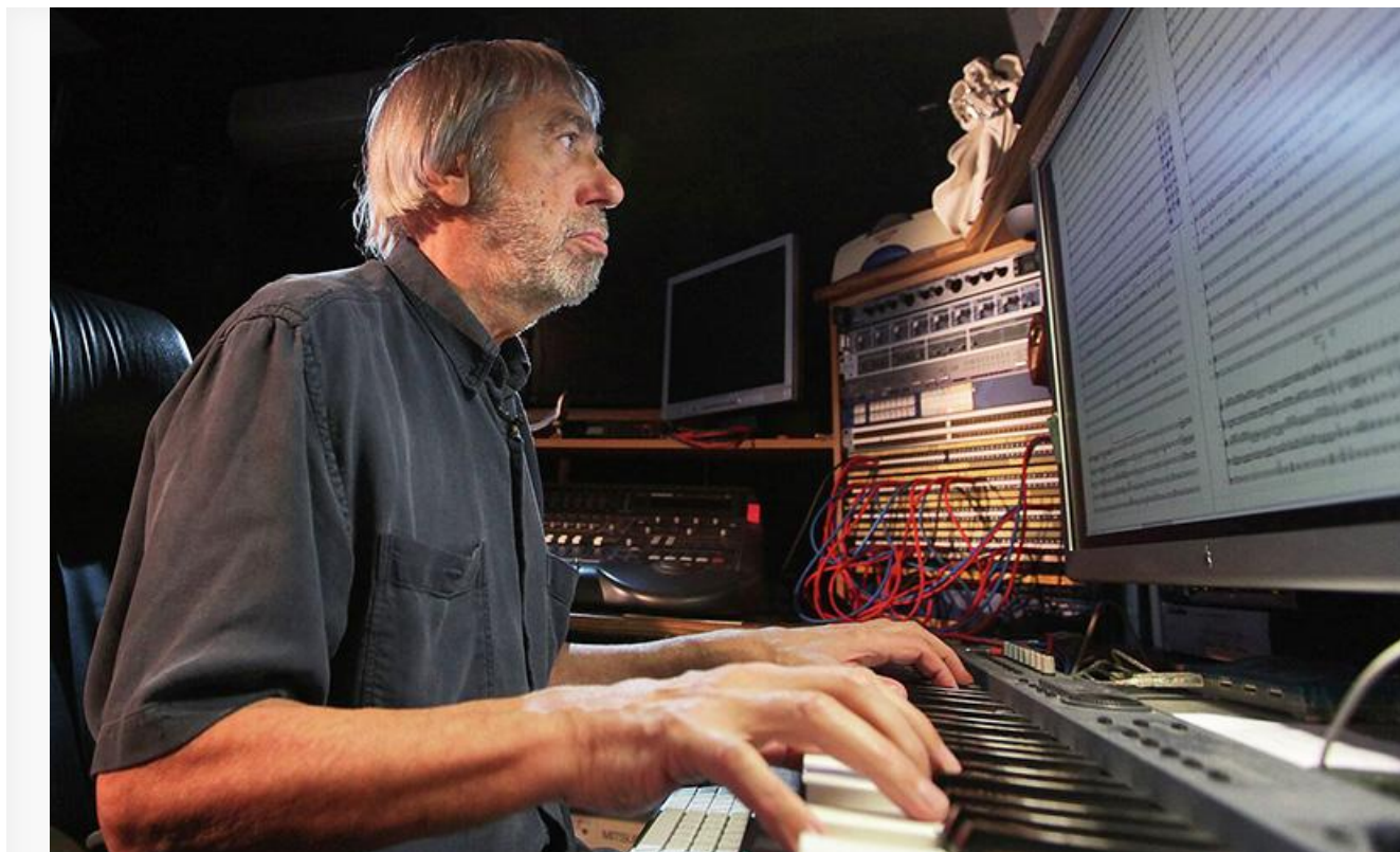
Эдуард Артемьев в домашней студии

30 ноября 85-летний юбилей отмечает выдающийся советский и российский композитор, лауреат Государственной премии РСФСР и четырёх Государственных премий России, четырёх премий «Ника», пяти премий «Золотой орёл» и Национальной театральной премии «Золотая маска», Герой Труда России, заслуженный деятель искусств РСФСР и народный артист Российской Федерации Эдуард Артемьев.