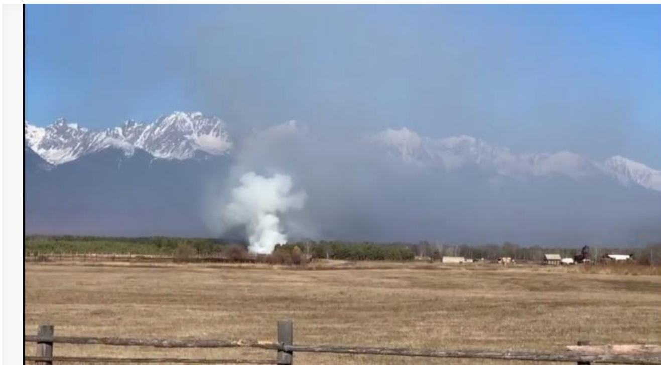
Пожар на тункинской свалке

После, уже в 2022 году, ликвидация свалки все же началась, но досталась эта работа томскому подрядчику АО «Полигон», который стал перевозить отходы с нарушениями.