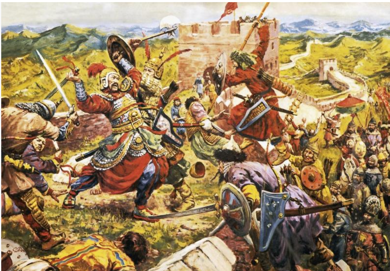
Битва монголов с чжурчжэнями на Великой китайской стене

В какой-то момент государство Си Ся настолько достали монголы, что оно пошло на примирение с ними.