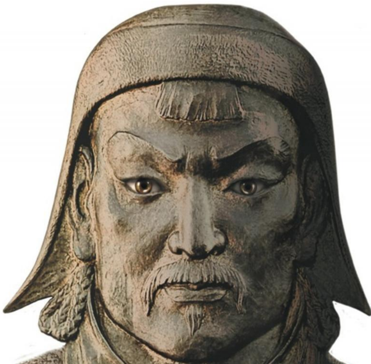
Примерно так выглядел сорокалетний Чингисхан

Кое-чего чжурчжэни не знали. 1206 год, Тэмуджину сорок лет, собирается курултай — съезд вождей всех племен, который Тэмуджина провозглашает Чингисханом — ханом всех монголов. Орда собрана, и для начала монголы пытаются найти что-то интересное на севере, но натываются лишь на странных «лесных людей» в Южной Сибири — дикарей, которые на тот момент живут еще в неолите. Грабить у них нечего. И тут монголы вспоминают, что у них под боком есть Китай. Причем Китай не единый, а всякий и разный. Они не сразу нападают на чжурчжэней, а сначала идут в государство Си Ся. У сорокалетнего Чингиса уже есть подросшие сыновья, которые потихоньку включаются в отцовскую систему завоеваний. Они начинают ходить с рейдами в Китай.