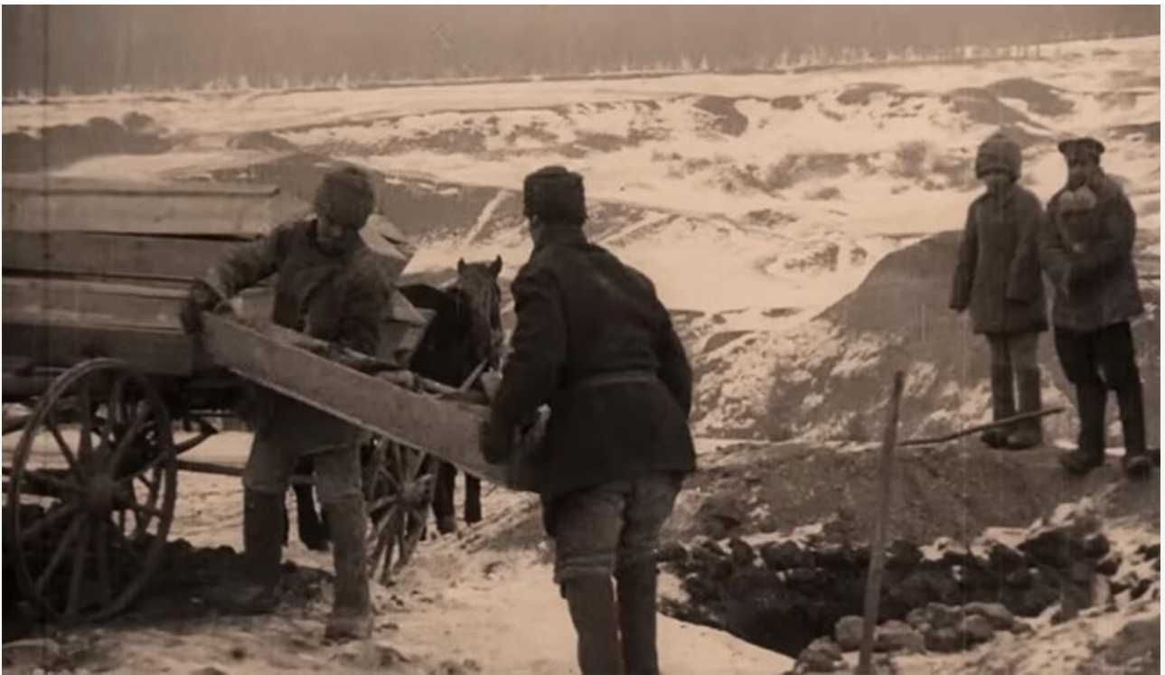
Кадр из фильма «Голод»

Откуда взялись «многочисленные жалобы» на не вышедший в прокат фильм и какая именно «запрещённая законодательством» информация была выявлена Минкультом, в ведомстве Ольги Любимовой не уточнили. Да и вряд ли смогли бы, ведь