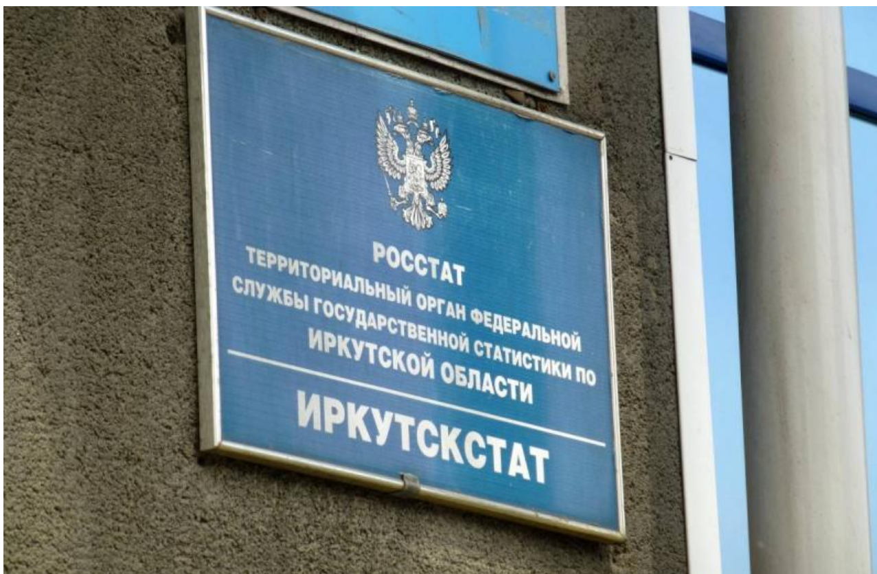
Фото с сайта «Иркутскстата»

Автор: Алина Саратова © Babr24.com ЭКОНОМИКА И БИЗНЕС, ИРКУТСК 👁 16520 18.11.2022, 08:33 📌 340