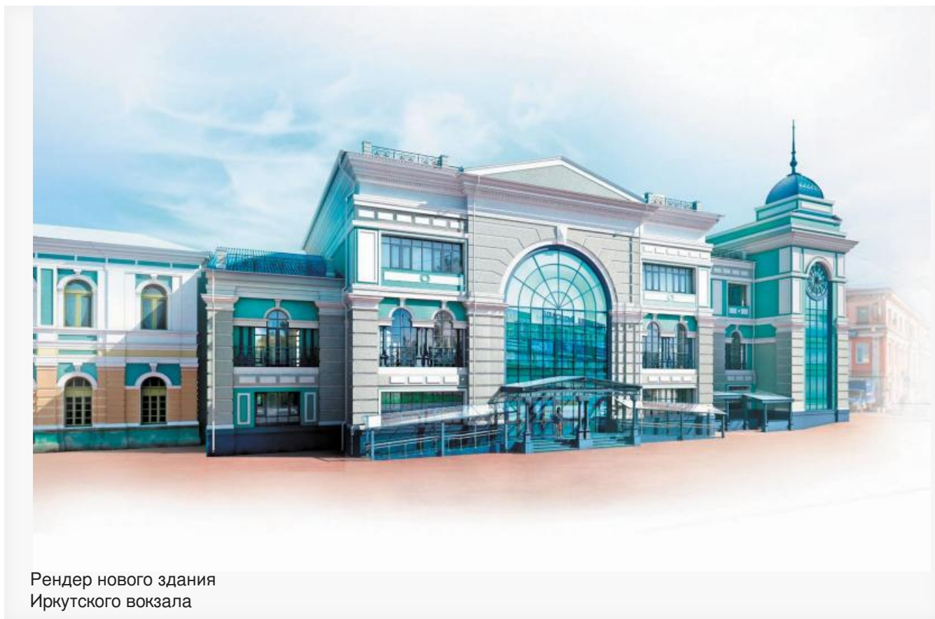
Рендер нового здания Иркутского вокзала

По изначальной задумке и официальным релизам пресс-службы ВСЖД новое здание должно было быть «архитектурно стилизованным под исторический облик вокзала». Однако еще на стадии проектирования стало ясно, что от исторического облика в новом вокзале планируют оставить чуть больше, чем ничего .