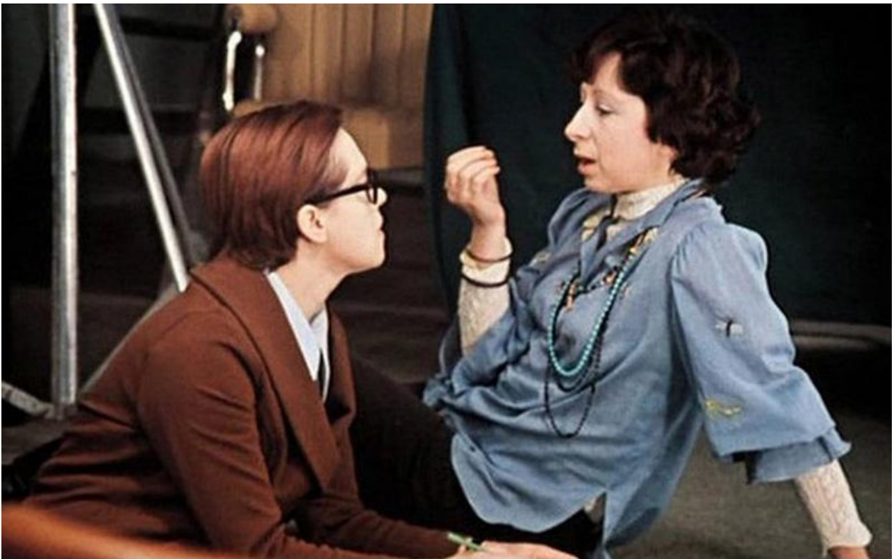
финальный эпизод Гоши и Катерины из комедийной мелодрамы Владимира Меньшова «Москва слезам не верит» (9 место с фразой « Как долго я тебя искала »).