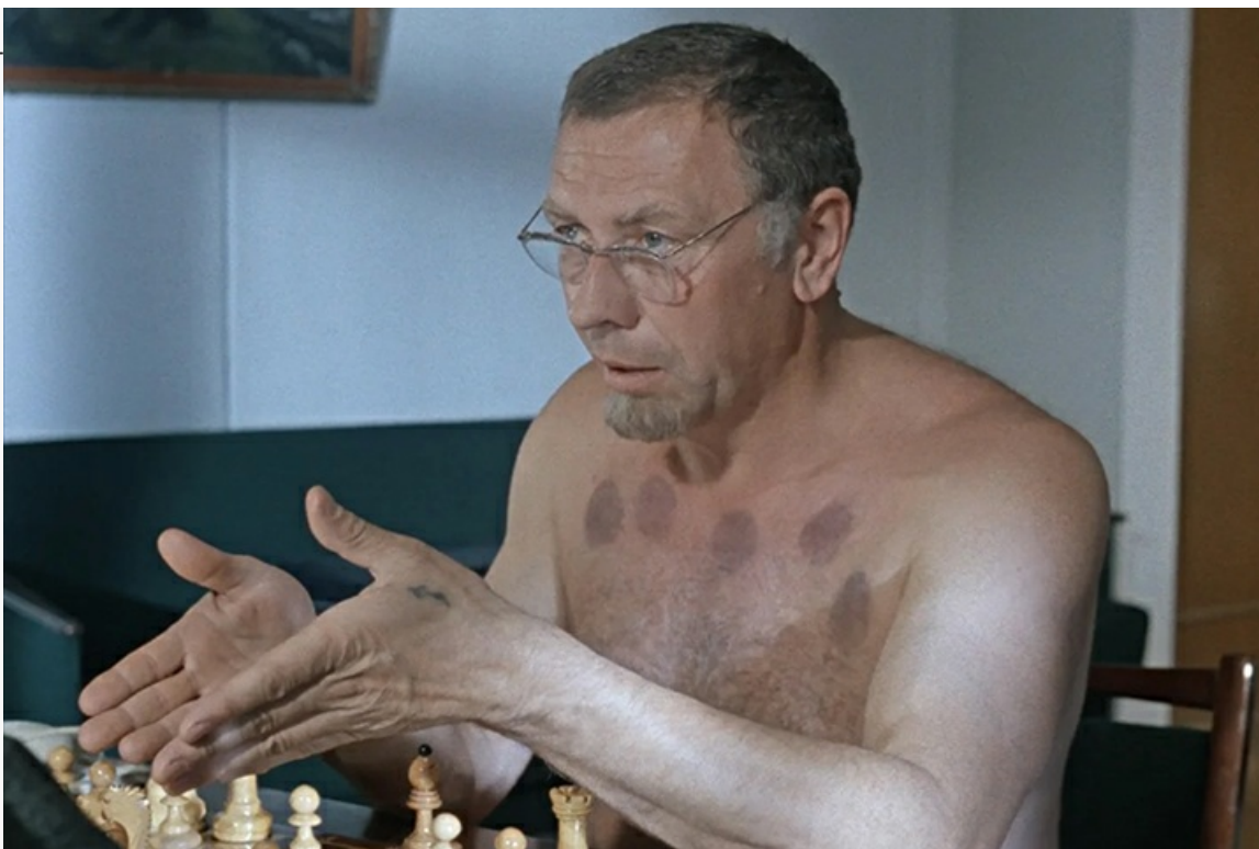
«Джентльмены удачи», 1971 год