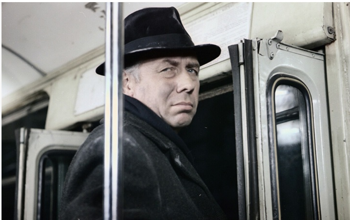
«Белорусский вокзал», 1970 год