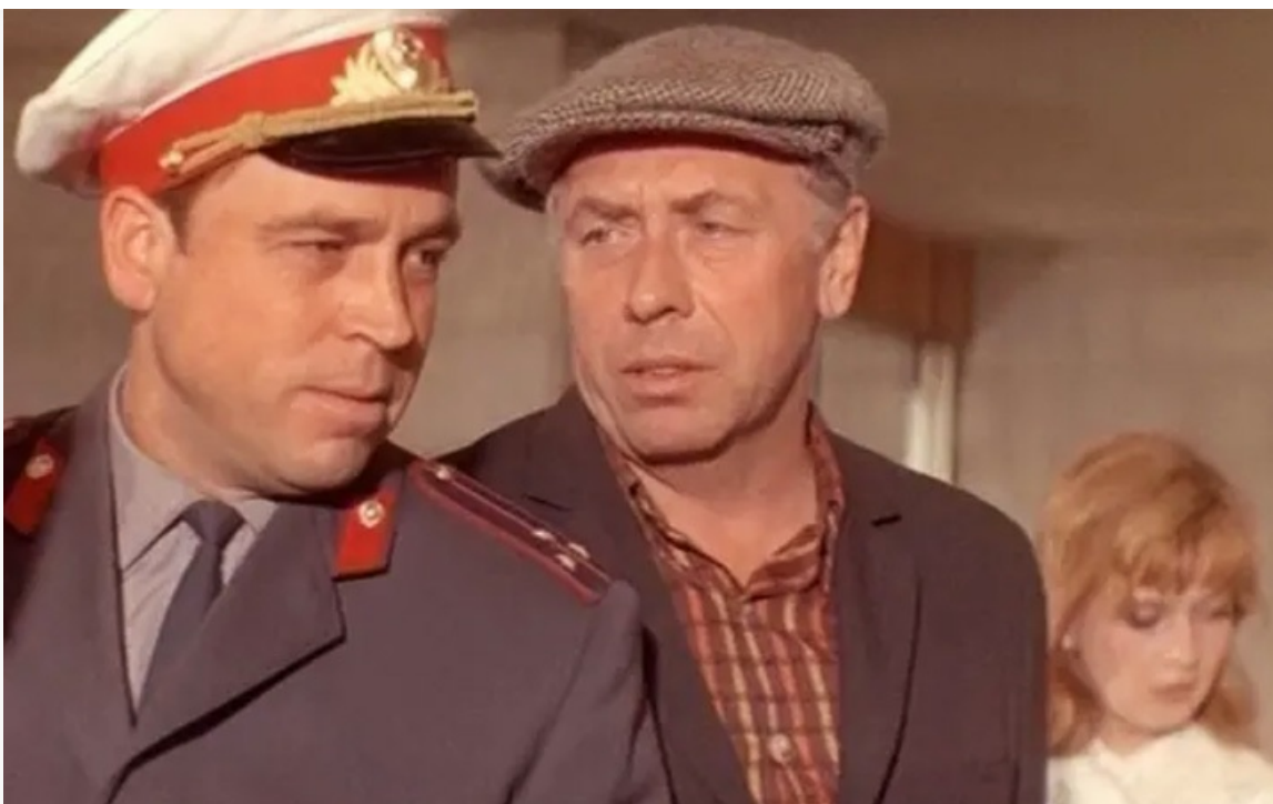
сердечные», 1973 год

В 1958 году Анатолий Папанов стал заслуженным артистом РСФСР. В 1966-м ему было присвоено звание «Народный артист РСФСР», в 1973-м – народный артист Советского Союза.