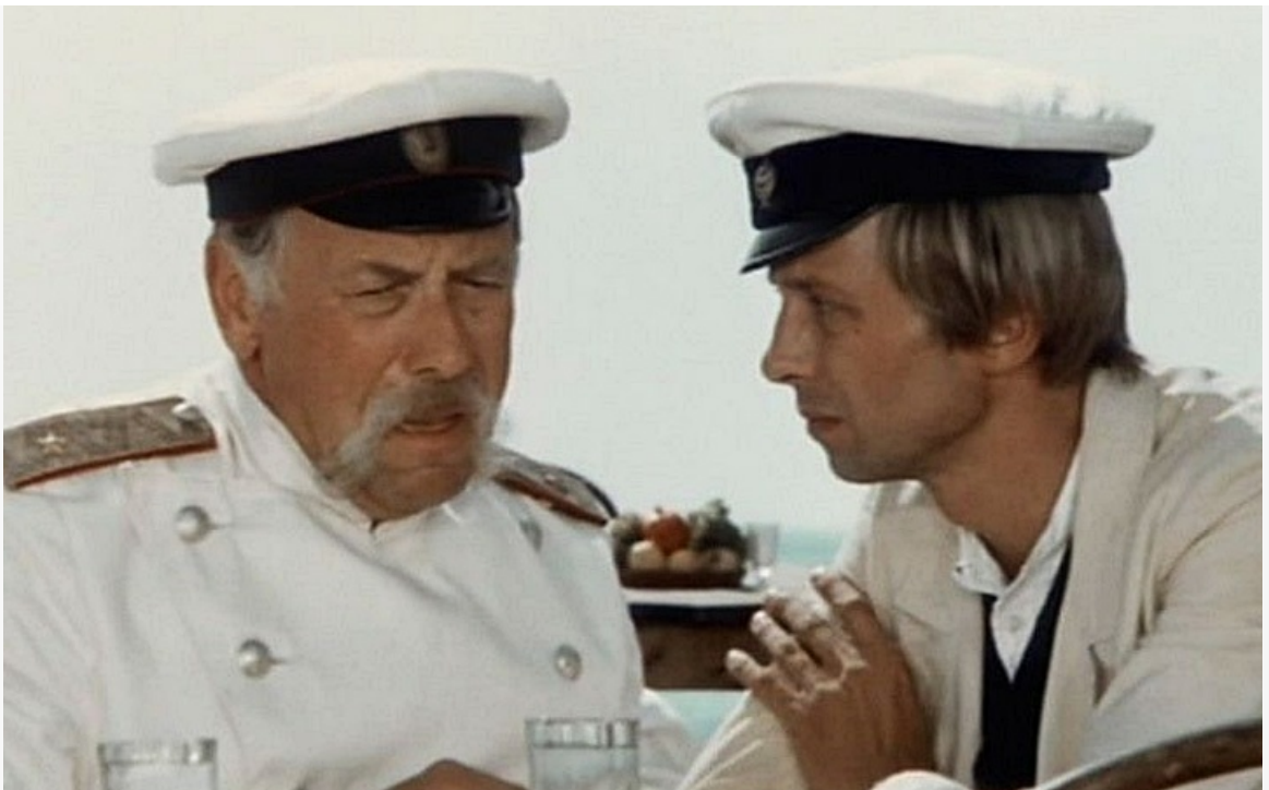
Самойленко в фильме «Плохой хороший человек», 1973 год