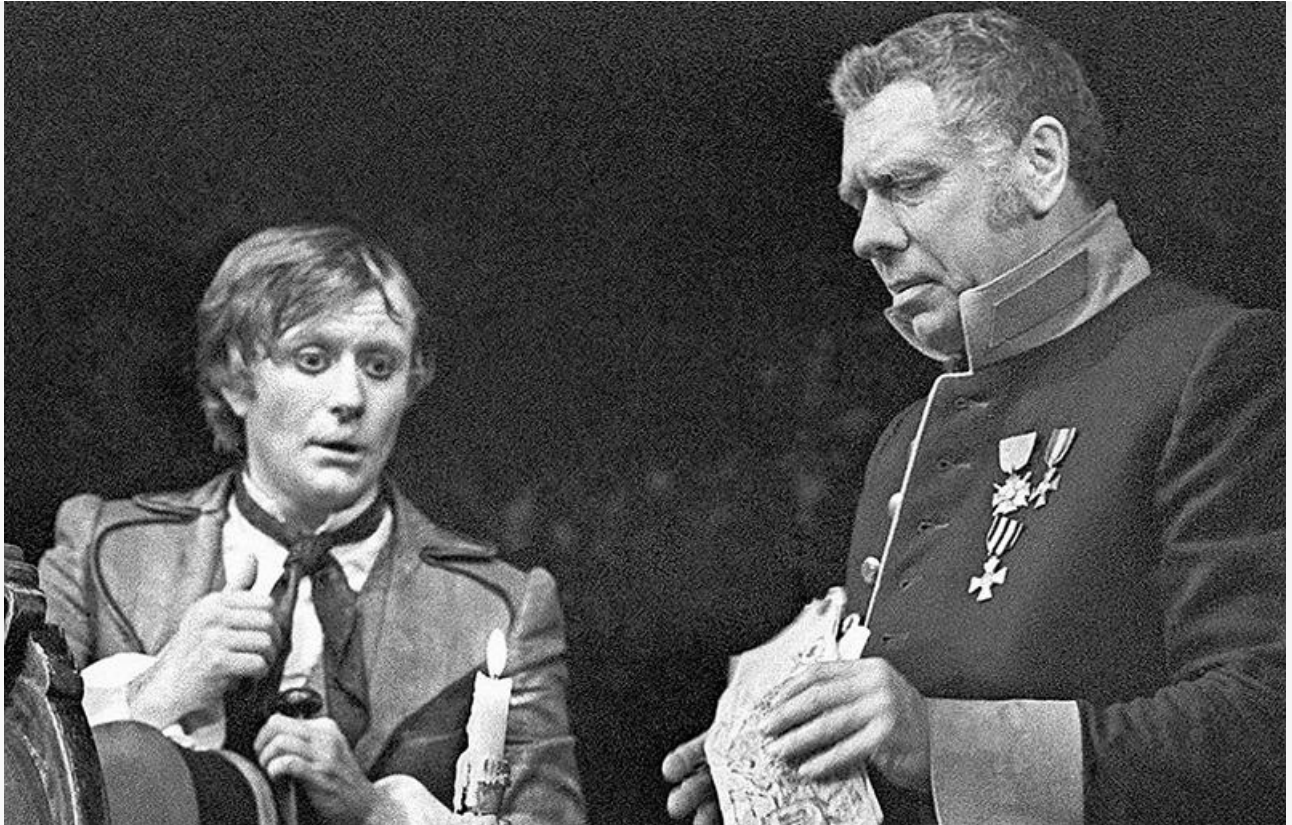
Городничий в спектакле «Ревизор». Театр сатиры, постановка 1972 года