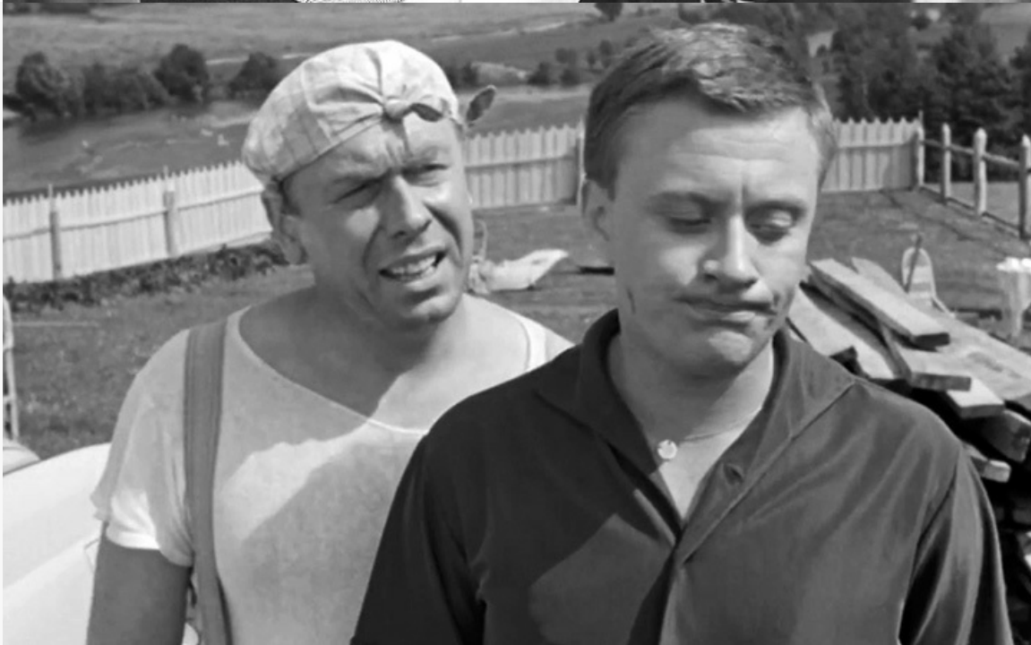
Васильевич Сокол-Кружкин в фильме «Берегись автомобиля», 1966 год