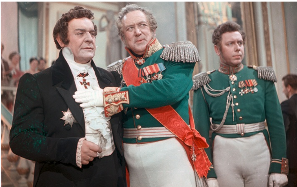
«Композитор Глинка», 1952 год