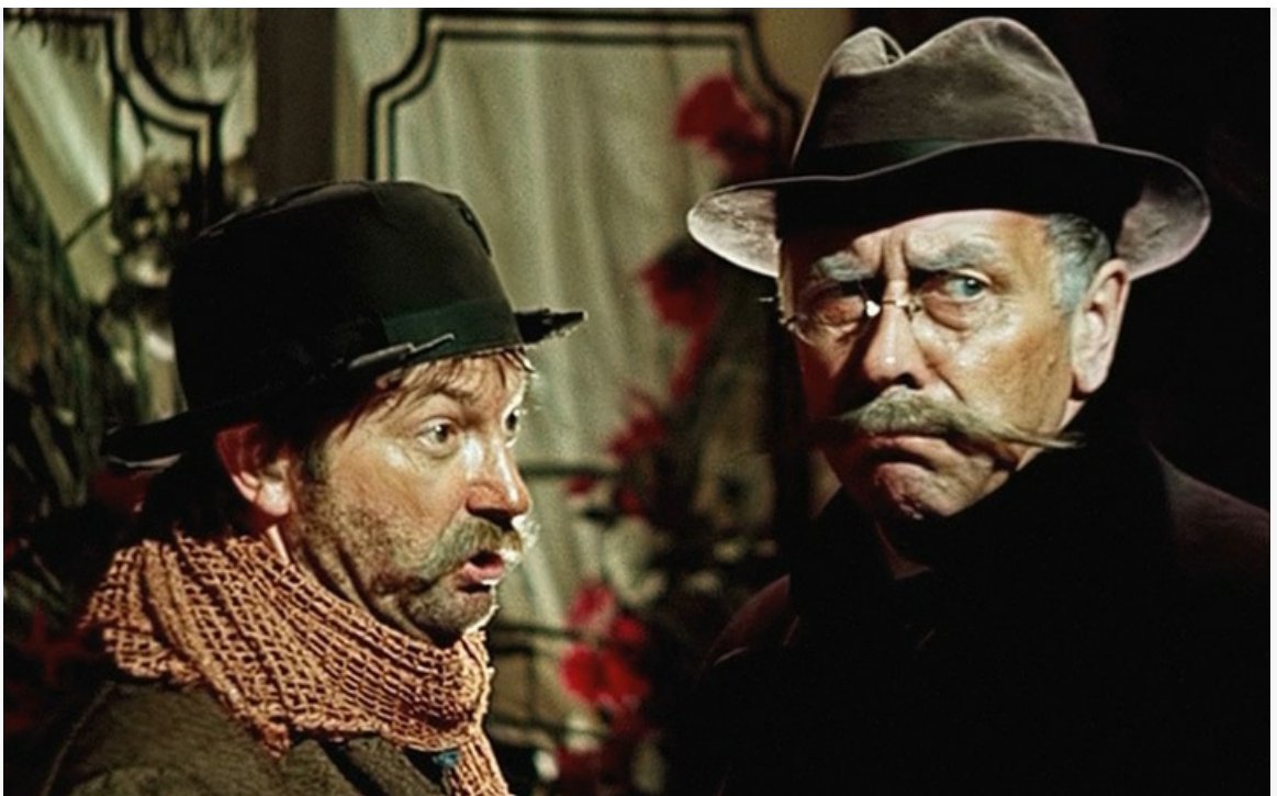
Воробьянинов в фильме «12 стульев», 1976 год