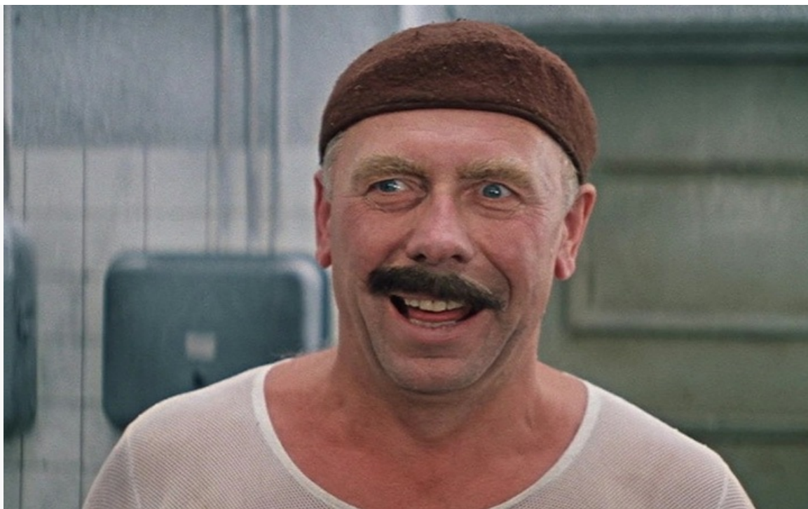
«Бриллиантовая рука», 1968 год