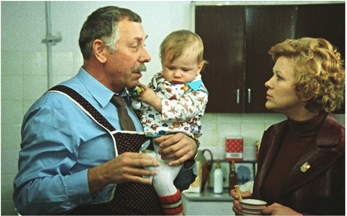
Пенсионер-нянька в фильме «По семейным обстоятельствам», 1977 год