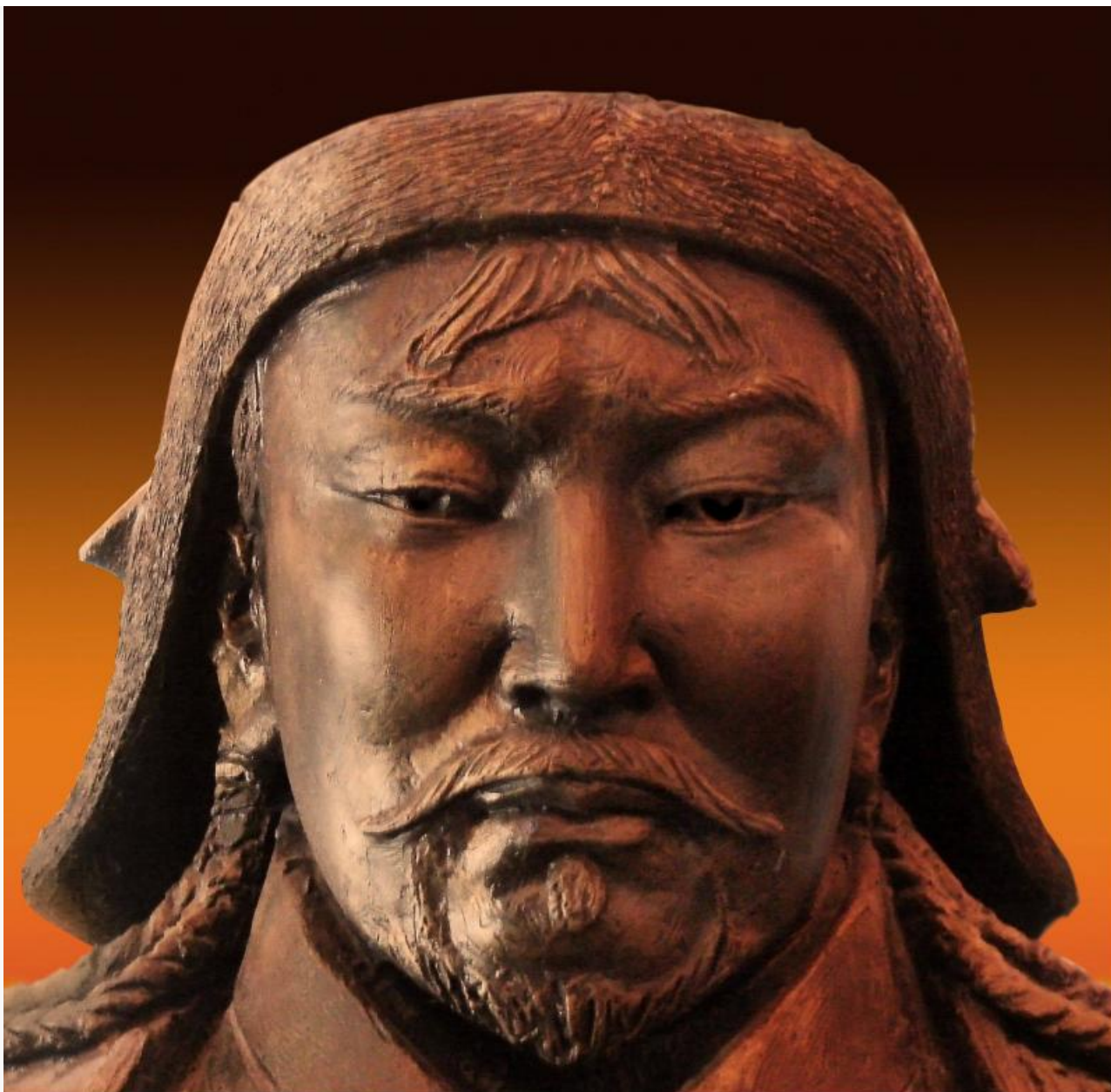
Примерно так выглядел Тэмуджин, когда его уже провозгласили Чингисханом

повлиявшего на монгольский мир, Тамерлана, который буквально строил после побед пирамиды из черепов убитых им людей, стоявшие десятилетиями.