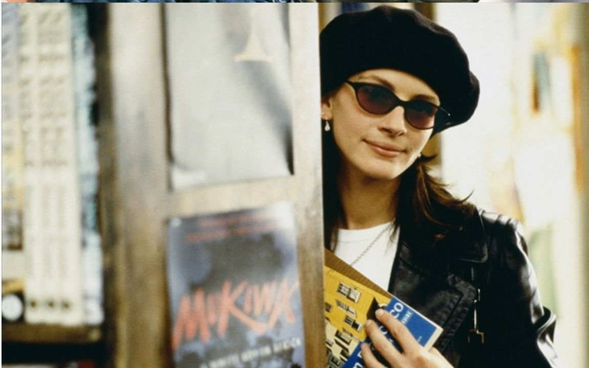
«Ноттинг-Хилл», 1999 год

В 2001 году Джулия Робертс была наконец-то удостоена премии «Оскар» в категории «Лучшая женская роль» за образ главной героини в биографической драме Стивена Содерберга «Эрин Брокович».