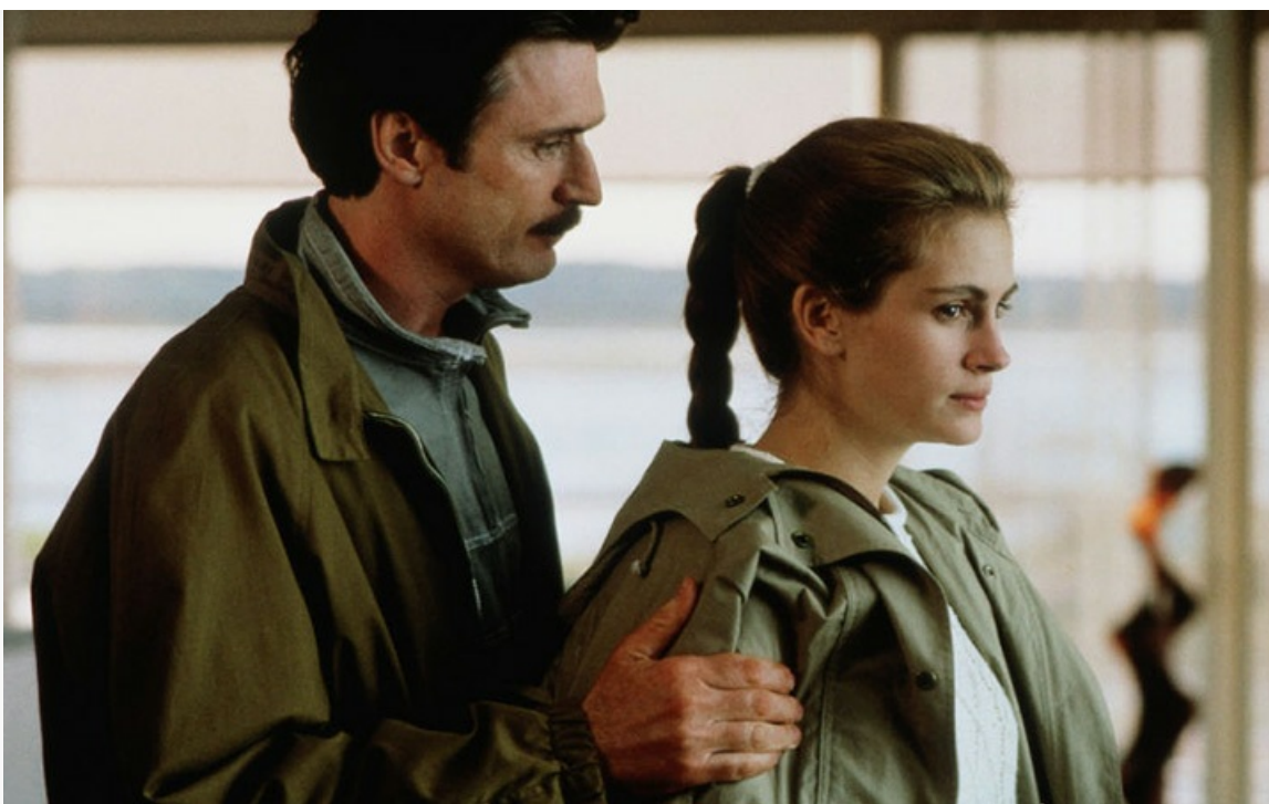
«В постели с врагом», 1991 год