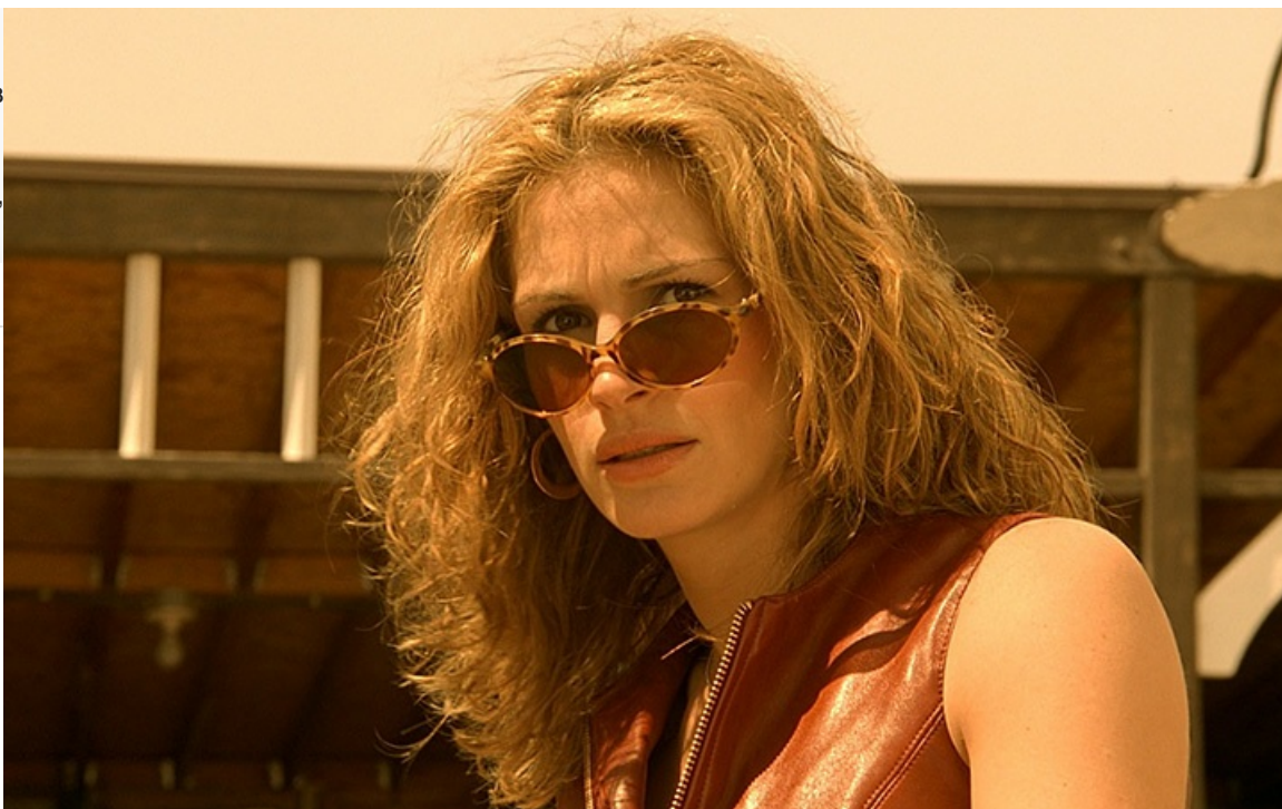
Саманта Бэрзел в фильме