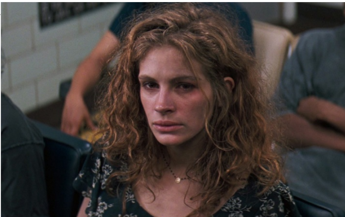
пеликанах», 1993 год