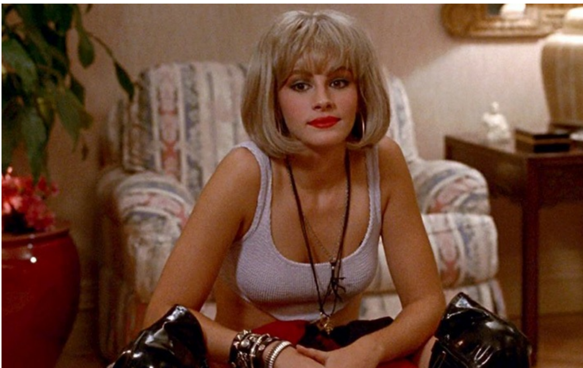
«Красотка», 1990 год

Закрепили успех юной актрисы вышедшие следом за «Красоткой» фантастический триллер «Коматозники» и мелодрама «Умереть молодым» Джоэла Шумахера, фэнтезийная комедия Стивена Спилберга «Капитан Крюк», психологический триллер Джозефа Рубена «В постели с врагом», криминальный триллер Алана Дж. Пакулы «Дело о пеликанах».