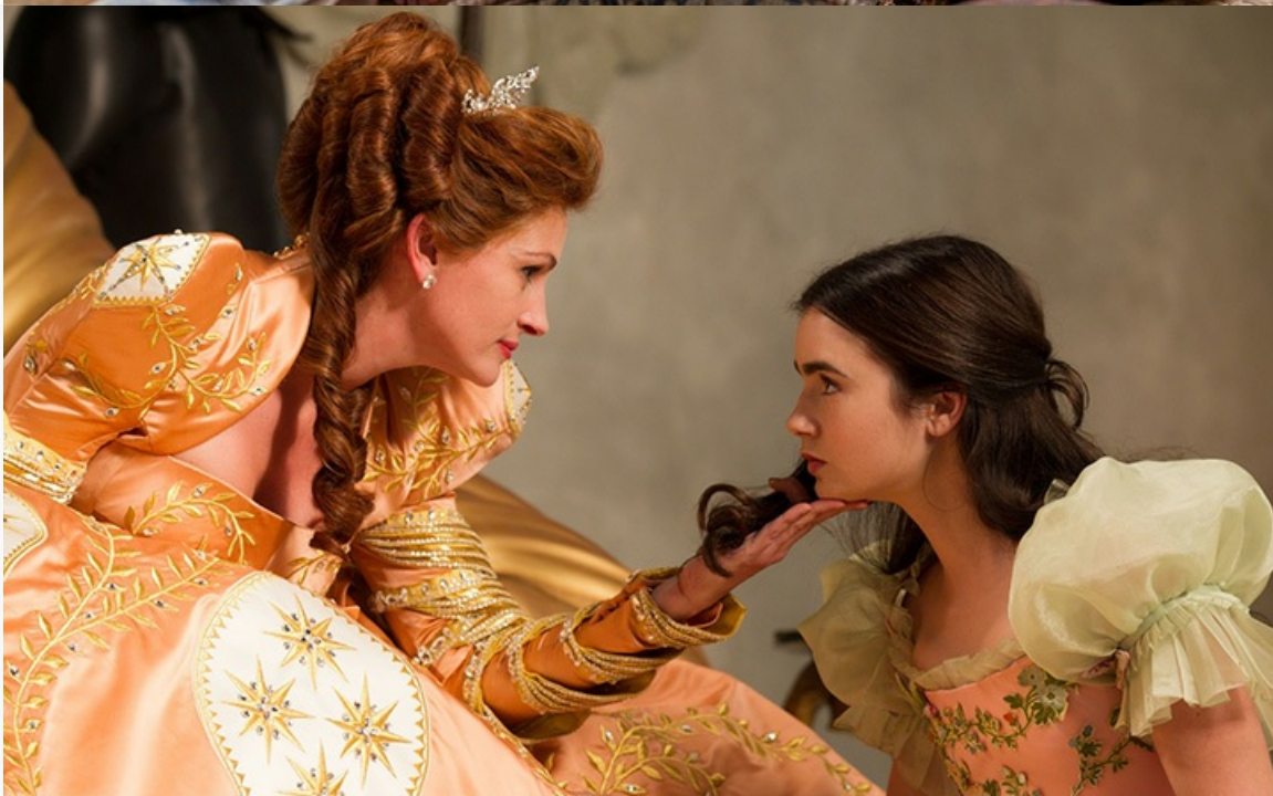
«Белоснежка: Месть гномов», 2012 год