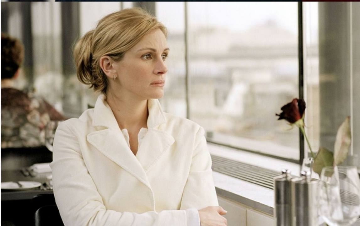
«Близость», 2004 год

Пять раз Джулия Робертс признавалась самым красивым человеком планеты по версии журнала People. В последний раз это произошло в 2017 году, когда звезда экрана готовилась отметить 50-летний юбилей. Чаще Робертс этого титула не удостоивался никто. Более того, лишь три актрисы в истории возглавляли список People дважды: Мишель Пфайффер, Дженнифер Энистон и Кейт Хадсон.