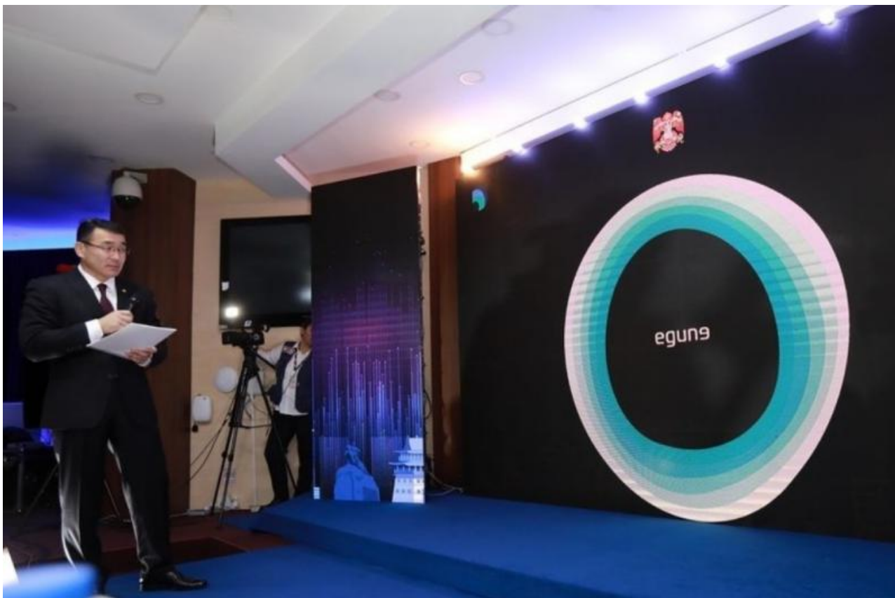
Фото: Gogo. mn

Автор: Денис Большаков © Babr24.com ИНТЕРНЕТ И ИТ, ПОЛИТИКА, ОБЩЕСТВО, МОНГОЛИЯ 👁 27425 28.10.2022, 16:45 📄 734