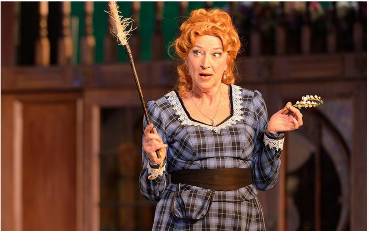
Мимоза в спектакле «Лето любви». Санкт- Петербургский театр музыкальной комедии, постановка 2015 года