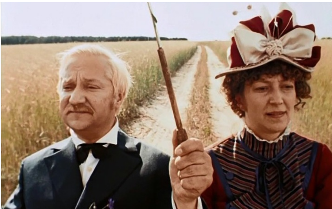
Полковница Дарья Иванова в фильме «Невероятное пари, или Истинное происшествие, благополучно завершившееся сто лет назад», 1984 год

Среди других заметных ролей Валентины Кособуцкой в кино – миссис Смит в детективе Игоря Масленникова «Шерлок Холмс и доктор Ватсон: Сокровища Агры», полковница Дарья Иванова в комедии Владимира Мотыля «Невероятное пари, или Истинное происшествие, благополучно завершившееся сто лет назад», завуч в драме Виталия Каневского «Замри – умри – воскресни!».