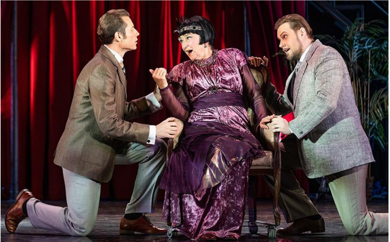
Артистка в спектакле «Сегодня, сто лет назад». Санкт- Петербургский театр музыкальной комедии, постановка 2022 года

В кино Валентина Кособуцкая дебютировала в 1973 году в роли Нонны в телефильме Льва Цуцуйковского «Чтобы быть счастливым!», снятом на студии «Лентелефильм». Всесоюзная слава пришла к актрисе спустя два года вместе с ролью Бабы-яги в невероятно успешном музыкальном фильме Геннадия Казанского и Игоря Усова «Новогодние приключения Маши и Вити».