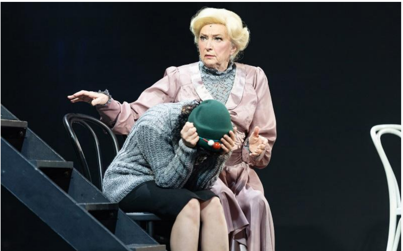
Миссис Пирс в спектакле «Моя прекрасная леди». Санкт-Петербургский театр музыкальной комедии, постановка 2021 года