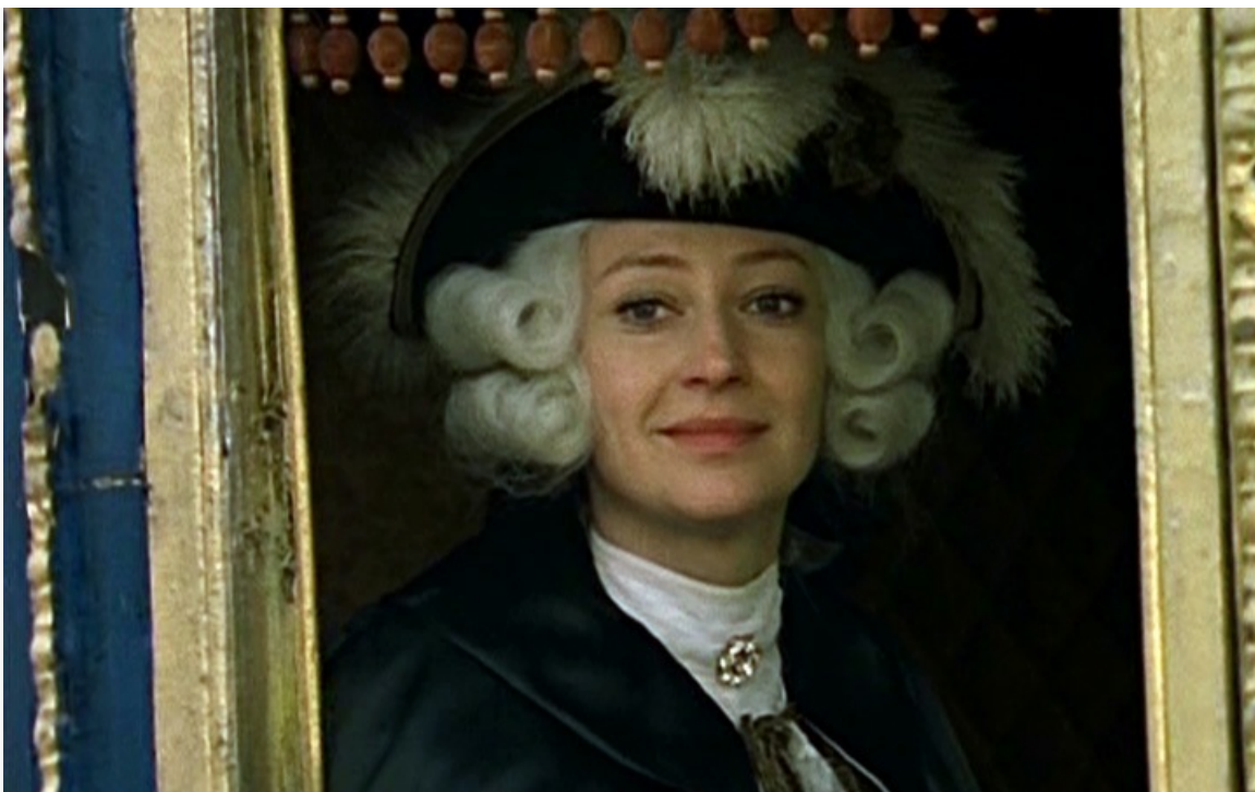
«Труффальдино из Бергамо», 1976 год

Среди других заметных ролей Валентины Кособуцкой в кино – миссис Смит в детективе Игоря Масленникова «Шерлок Холмс и доктор Ватсон: Сокровища Агры», полковница Дарья Иванова в комедии Владимира Мотыля «Невероятное пари, или Истинное происшествие, благополучно завершившееся сто лет назад», завуч в драме Виталия Каневского «Замри – умри – воскресни!».