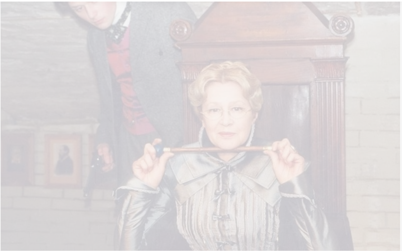
Кадр из фильма «Азазель», 2002 год

Действие новой версии экранизации конспирологического детектива Акунина происходит в альтернативной реальности современной России.