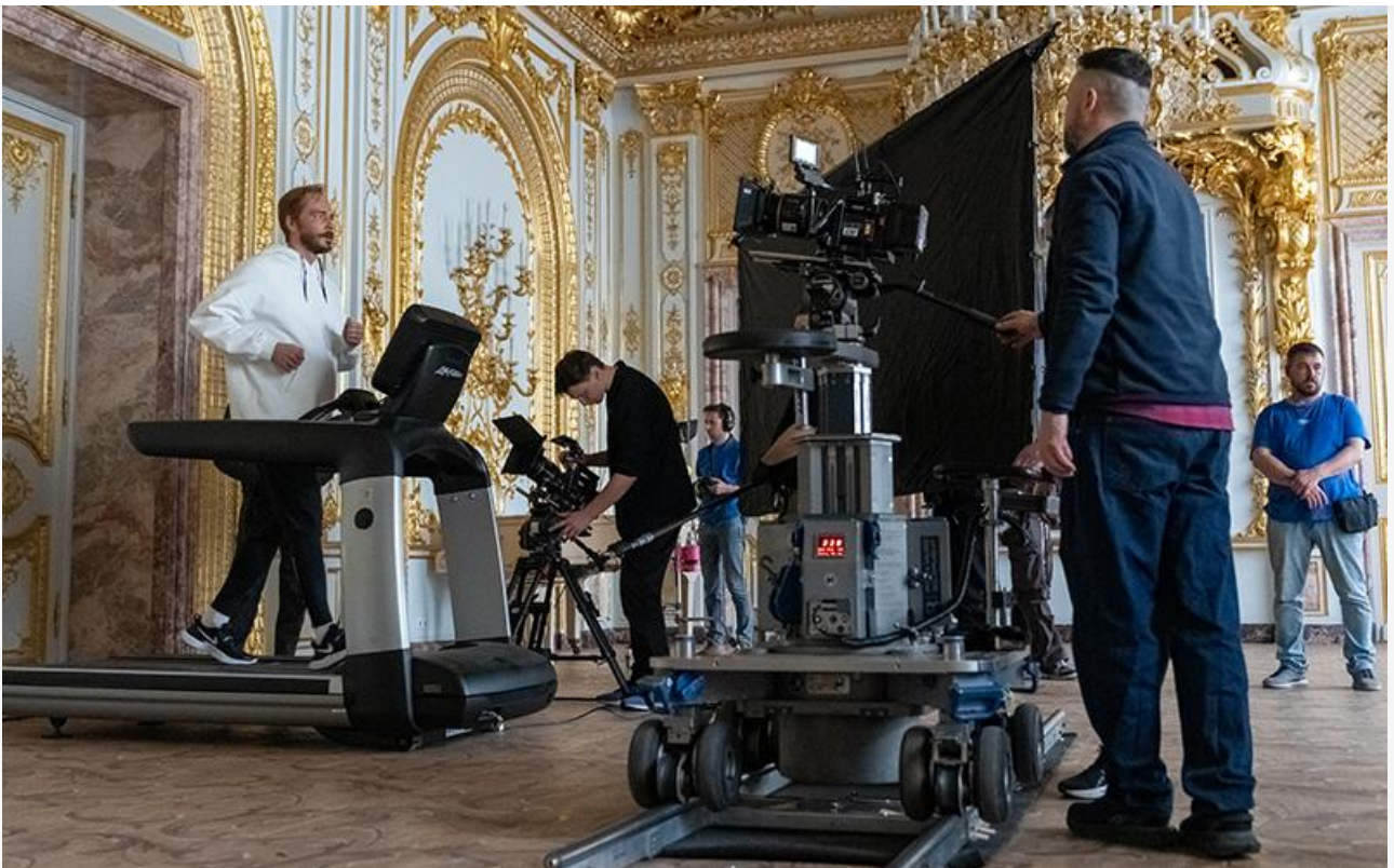
Максим Матвеев на съёмках фильма «Азazel»

Инициативы Ямпольской, или Духовное обострение