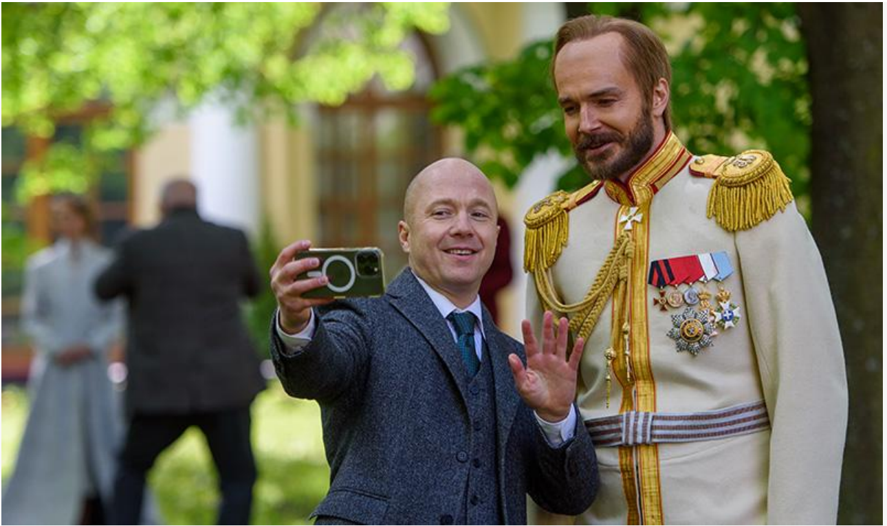
Евгений Стычкин и Максим Матвеев на съёмках фильма «Азazel»