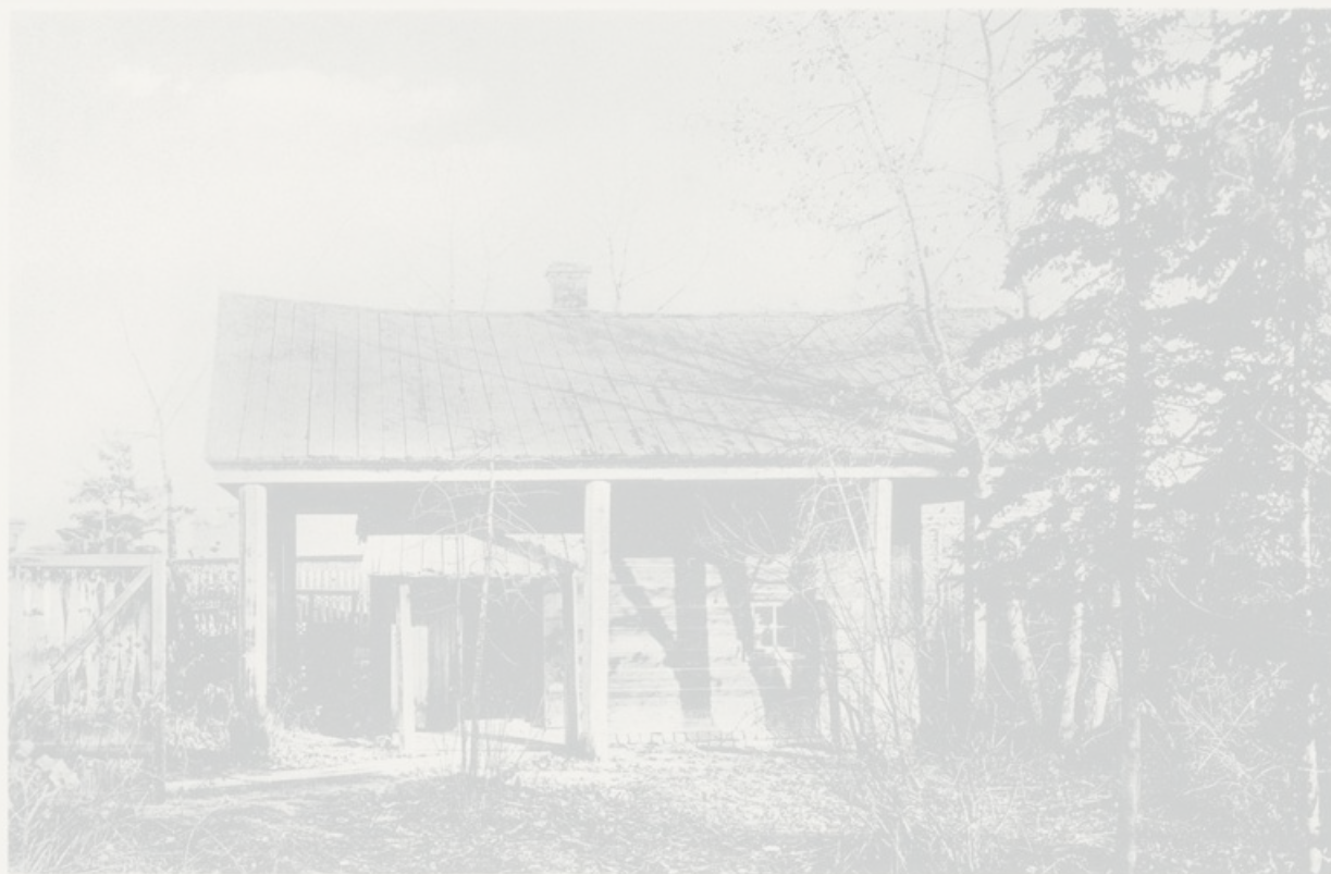
Наружный вид кельи старца Федора Кузьмича в Томске

Летом телеграм-канал «Томск. Дальше некуда» запустил исторические викторины – серию загадок о малоизвестных фактах из прошлого города и региона. В последней викторине, опубликованной 11 октября, мы вспоминали тайну старца Федора Кузьмича.