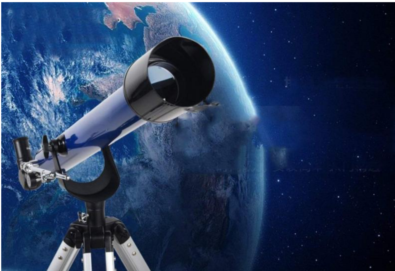
Фото: gas-kvas.com , kto-chno-gde.ru , placepic.ru , irk.ru , culture.ru , basik.ru , masyamba.ru , blog.hmstudio.com.ua , oir.mobi

Автор: Денис Миронов © Babr24.com КУЛЬТУРА, СОБЫТИЯ, ИРКУТСК 👁 28768 13.10.2022, 05:38 📌 633 URL: https://babr24.com/?IDE=235864 Bytes: 11672 / 9787 Версия для печати Скачать PDF