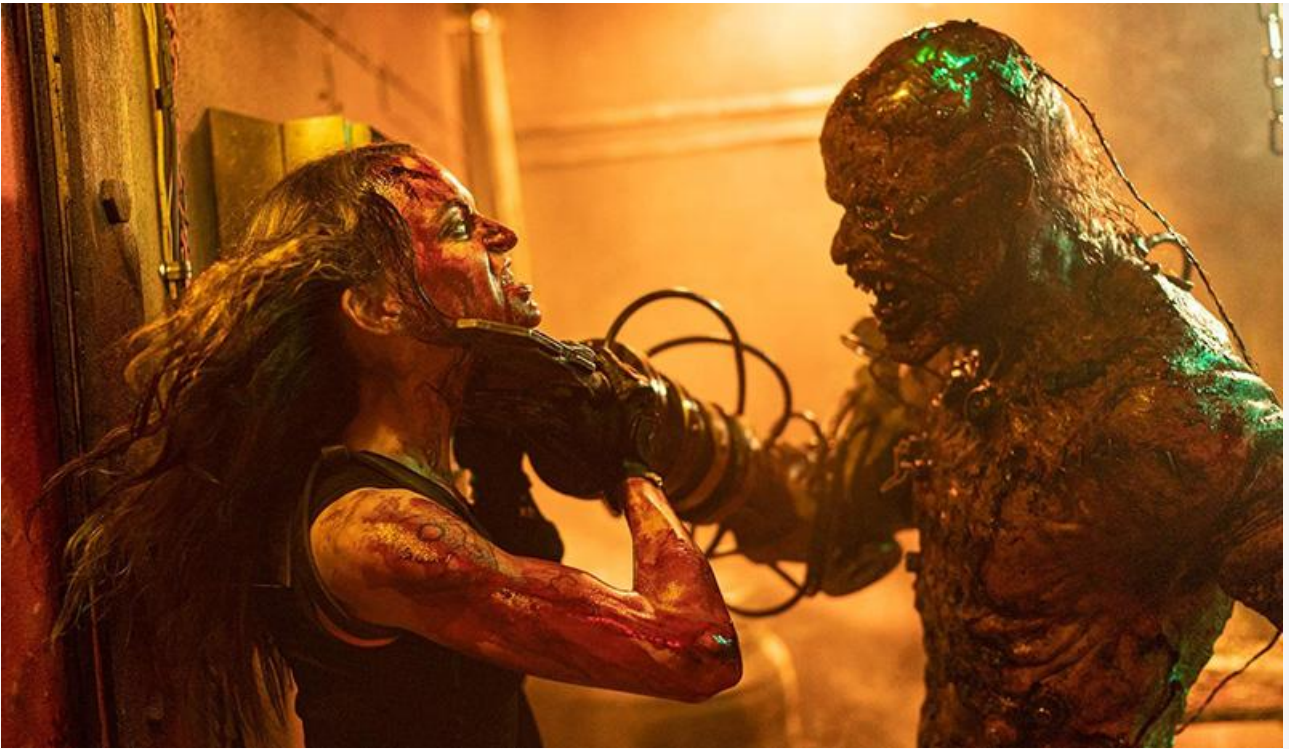
Кадр из фильма «Безумная дорога»