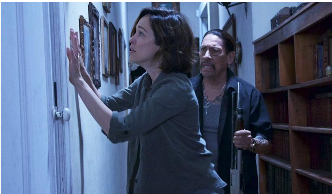
Кадр из фильма «Проклятие плачущей. Возвращение»