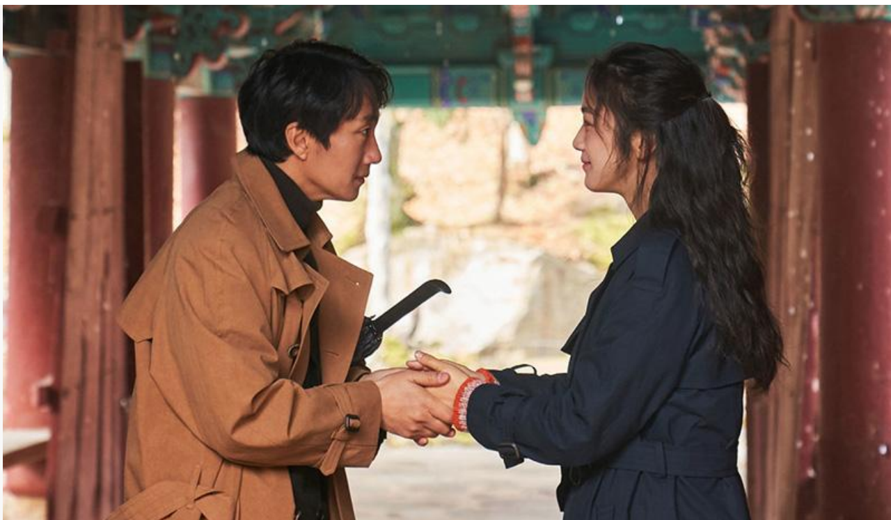
Кадр из фильма «Решение уйти»

когда фильм демонстрируется исключительно в Якутии, но занимает место в топ-10 общефедерального чарта, заставляет задуматься о благополучии российского кинопроката.