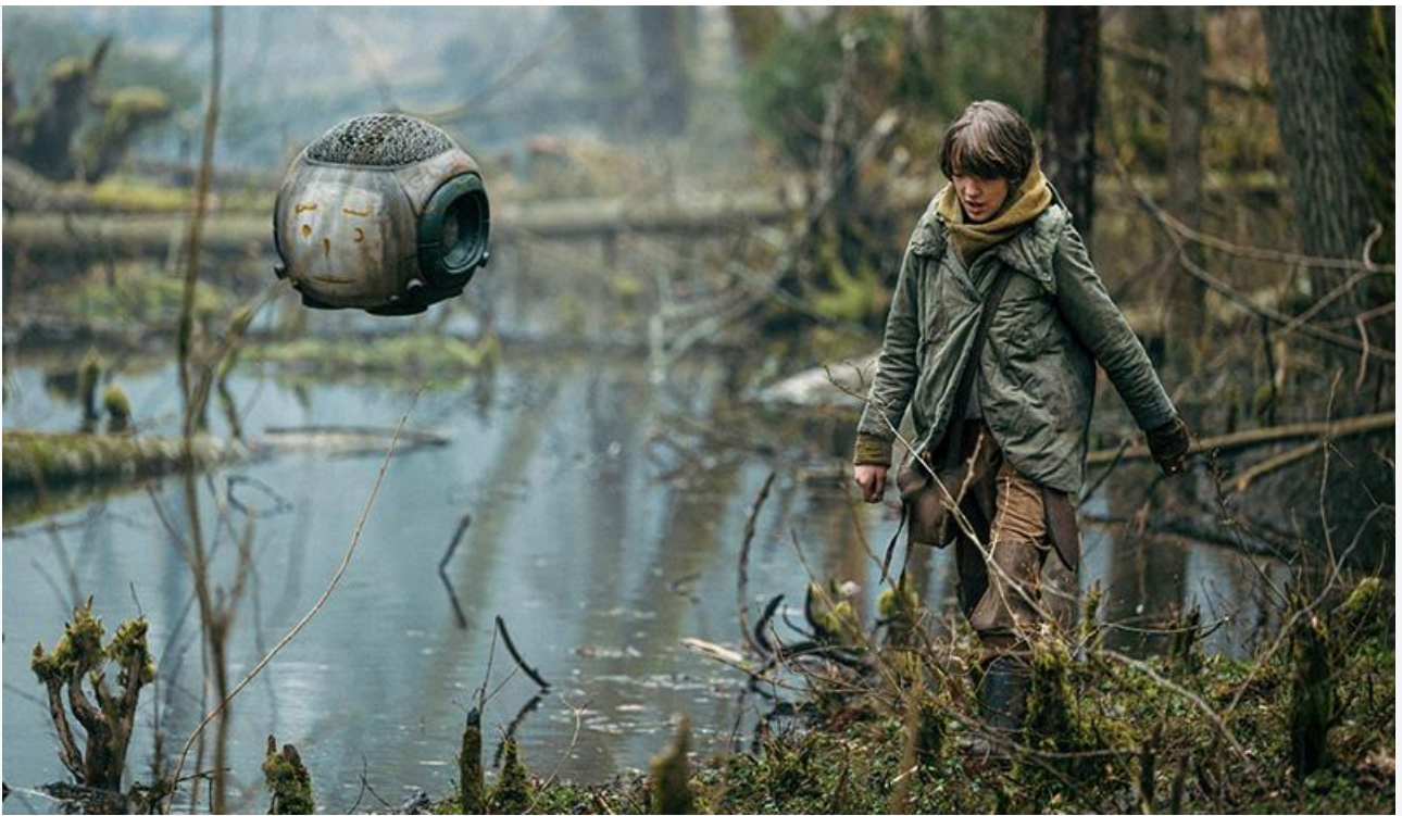
Кадр из фильма «Эра выживания»