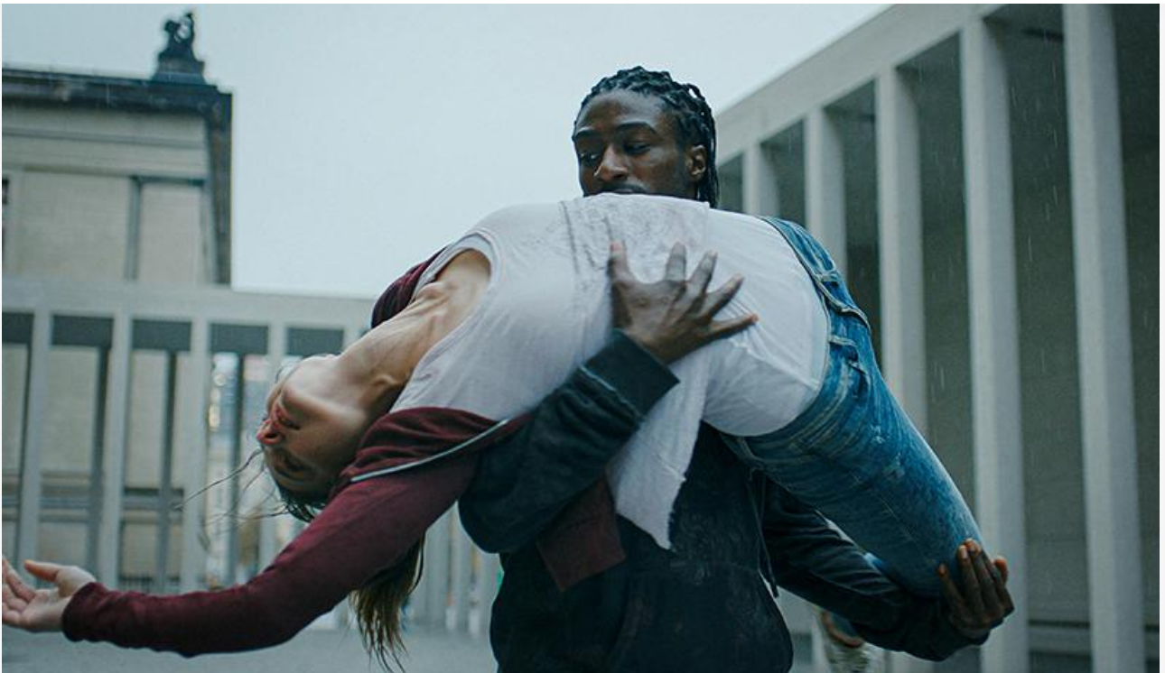
Кадр из фильма «Флай: Танец свободы»