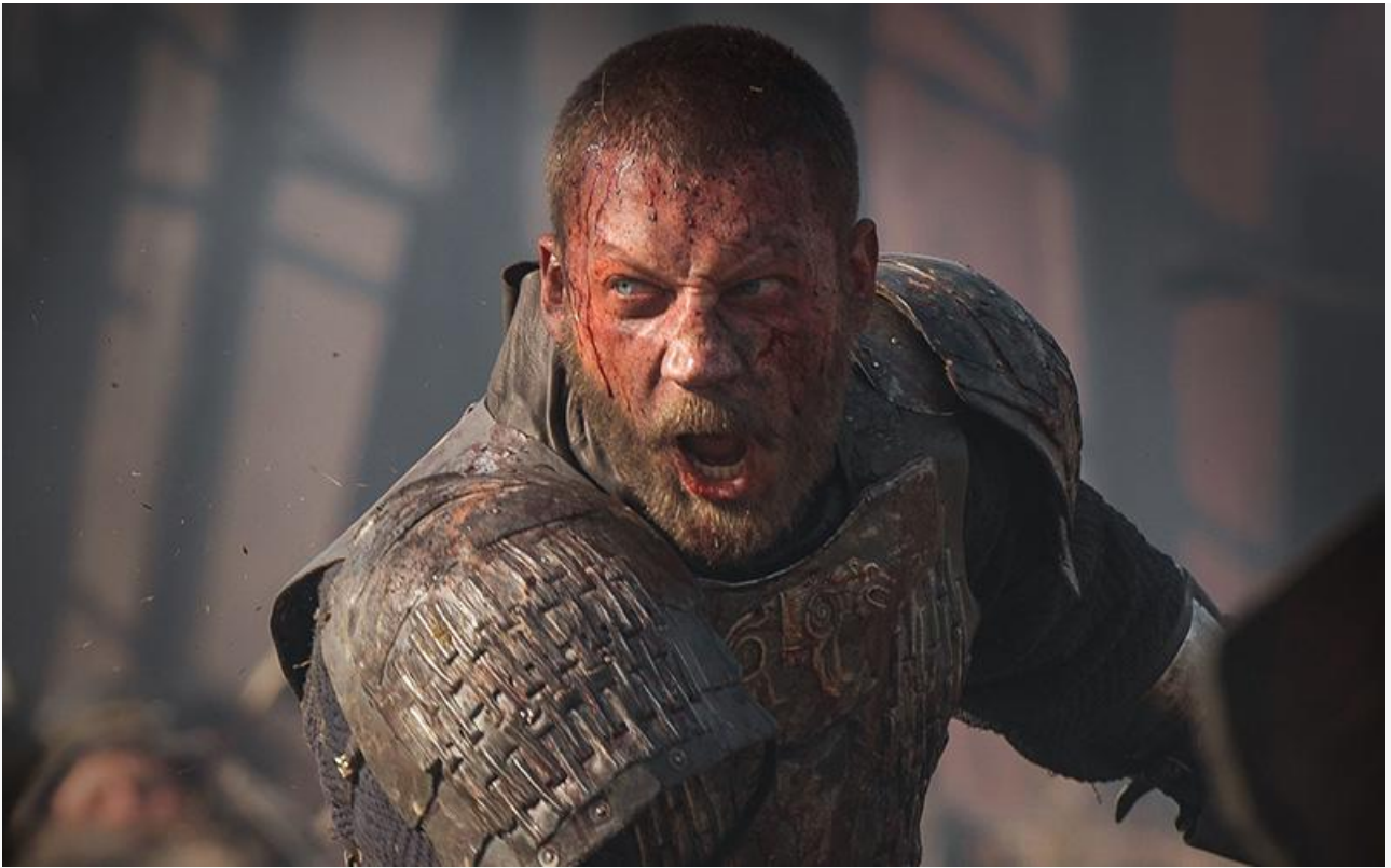
Постер к фильму «Сердце пармы»

Желающих конкурировать с «Сердцем пармы» оказалось немного.