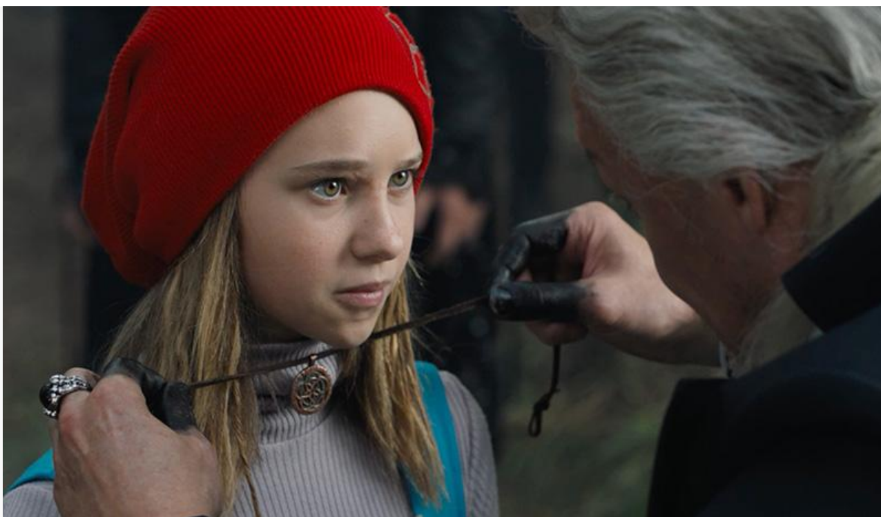
Кадр из фильма «Красная Шапочка»

На счету «Трёх тысяч лет желаний» 21,8 миллиона на 608 экранах (против 2 064 у «Красной Шапочки») и твёрдое второе место. Потеря в сборах фильма Джорджа Миллера за четвёртый уикенд проката составила весьма умеренные 25 %.