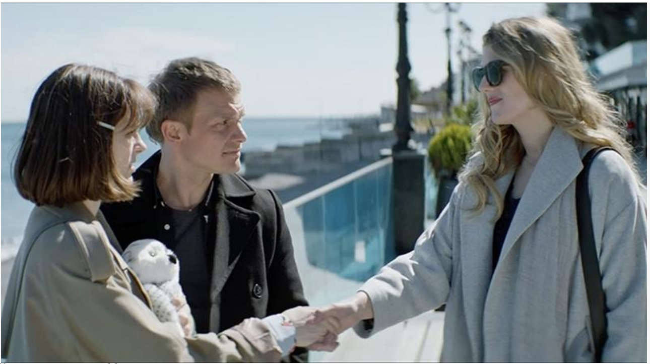
Кадр из фильма «Мать моего сына»

Третий месяц не покидает топ-10 проката анимационная комедия «Пёс-самурай и город кошек» . В свой 11-й уикенд британо-американский мультфильм добавил в копилку ещё 6,8 миллиона рублей, заработанных всего на 249 экранах. Также сохранил место в десятке лидеров российский фантастический фильм «Календарь ма(й)я» : 6 миллионов на 350 экранах и восьмое место.