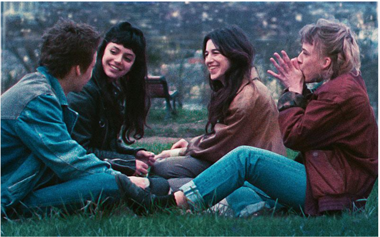
Постер к фильму «Пассажиры ночи»