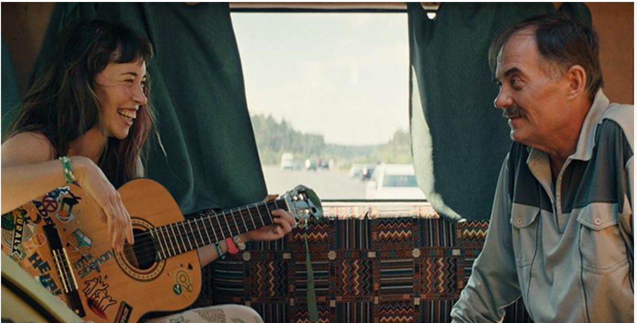
Кадр из фильма «Далёкие близкие»

У остальных новинок уикенда результаты гораздо скромнее: 6,1 миллиона и седьмое место у южнокорейского детективного триллера Пак Чхан-ука «Решение уйти» , 4,7 миллиона и десятое место у канадо-мексиканского хоррора Патриции Харрис Сили «Проклятие плачущей. Возвращение» , 4,5 миллиона и 11-е место у драмы Ильи Максимова «Мать моего сына» .