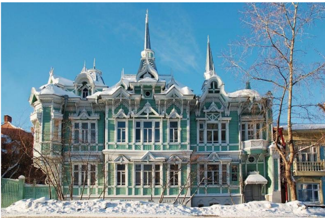
Дом архитектора Станислава Хомича (Белинского, 19)

Елань делится на две части – Верхнюю и Нижнюю. Верхняя включает в себя территорию, окружающую проспект Кирова, а Нижняя – пространство от улицы Гоголя до проспекта Ленина, южнее реки Ушайки. Здесь расположены самые знаменитые образцы томского деревянного зодчества – особняки архитекторов Станислава Хомича и Андрея Крячкова, усадьба купца Голованова, а также дом с драконами, дом с жарптицами и дом со шпилем.