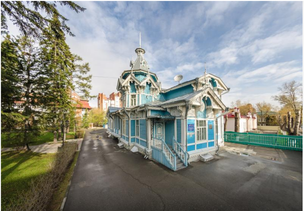
Особняк купца Георгия