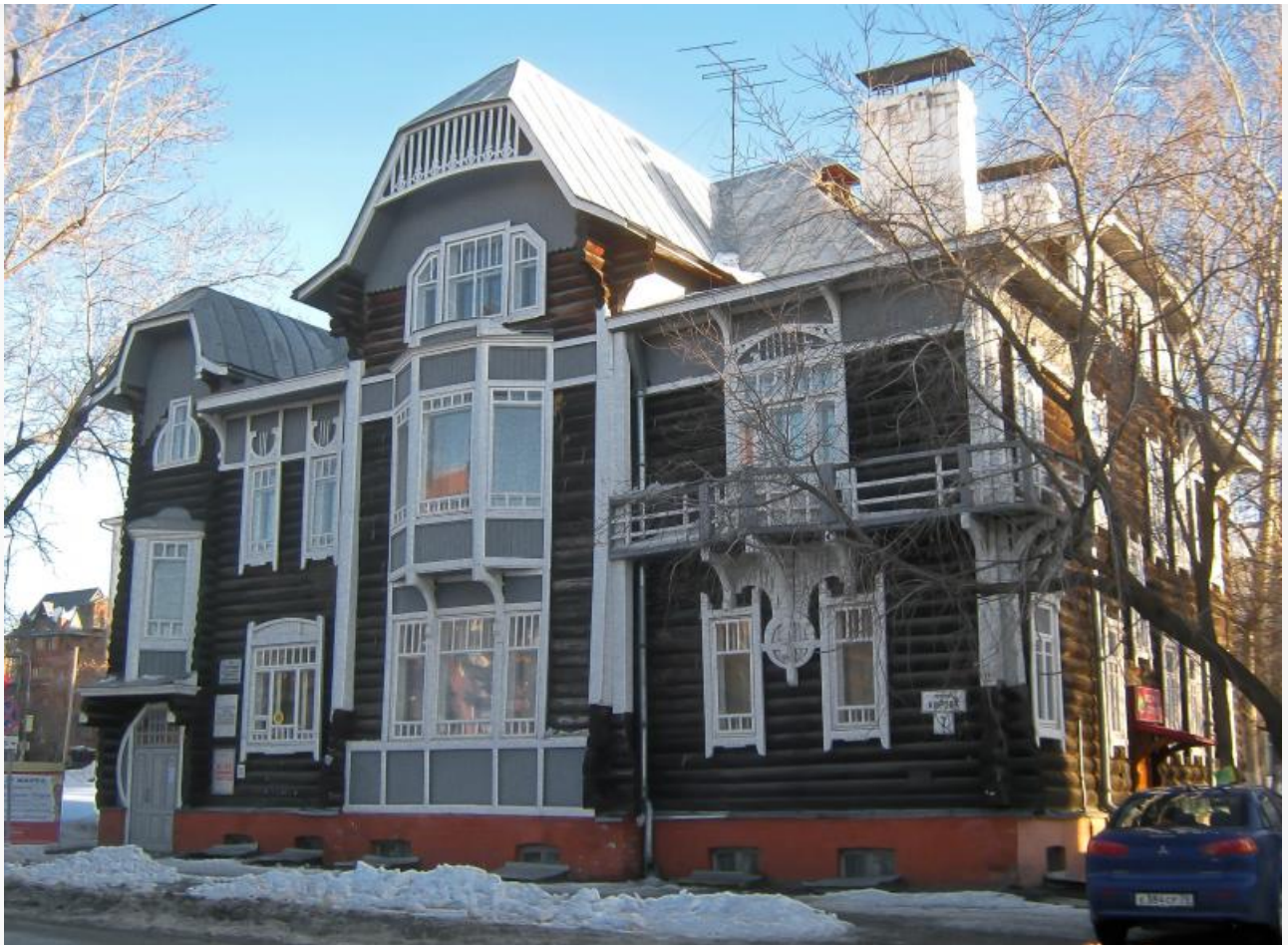
Дом архитектора Андрея Крячкова (Кирова, 7)