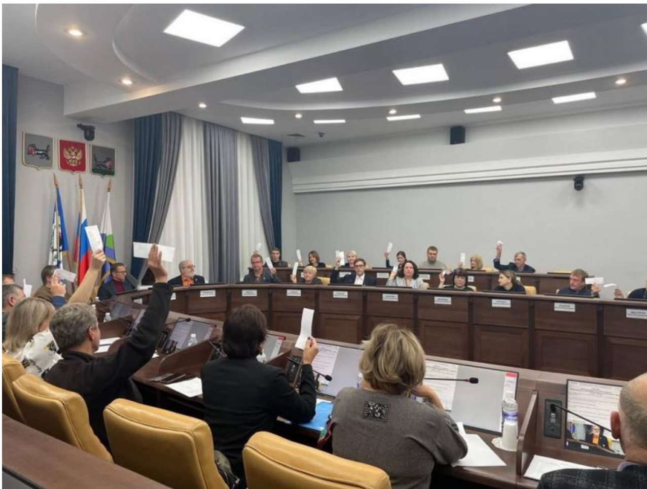
Фото пресс-службы администрации Иркутска

Автор: Алина Саратова © Babr24.com ПОЛИТИКА, ОБЩЕСТВО, ОФИЦИОЗ, ИРКУТСК 👁 22805 03.10.2022, 19:08 📄 588