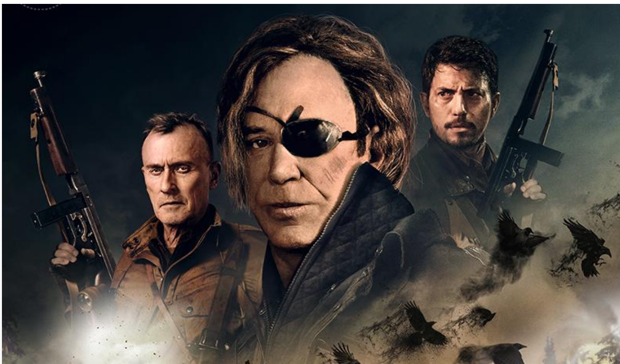
Постер к фильму «Охота на ведьм»