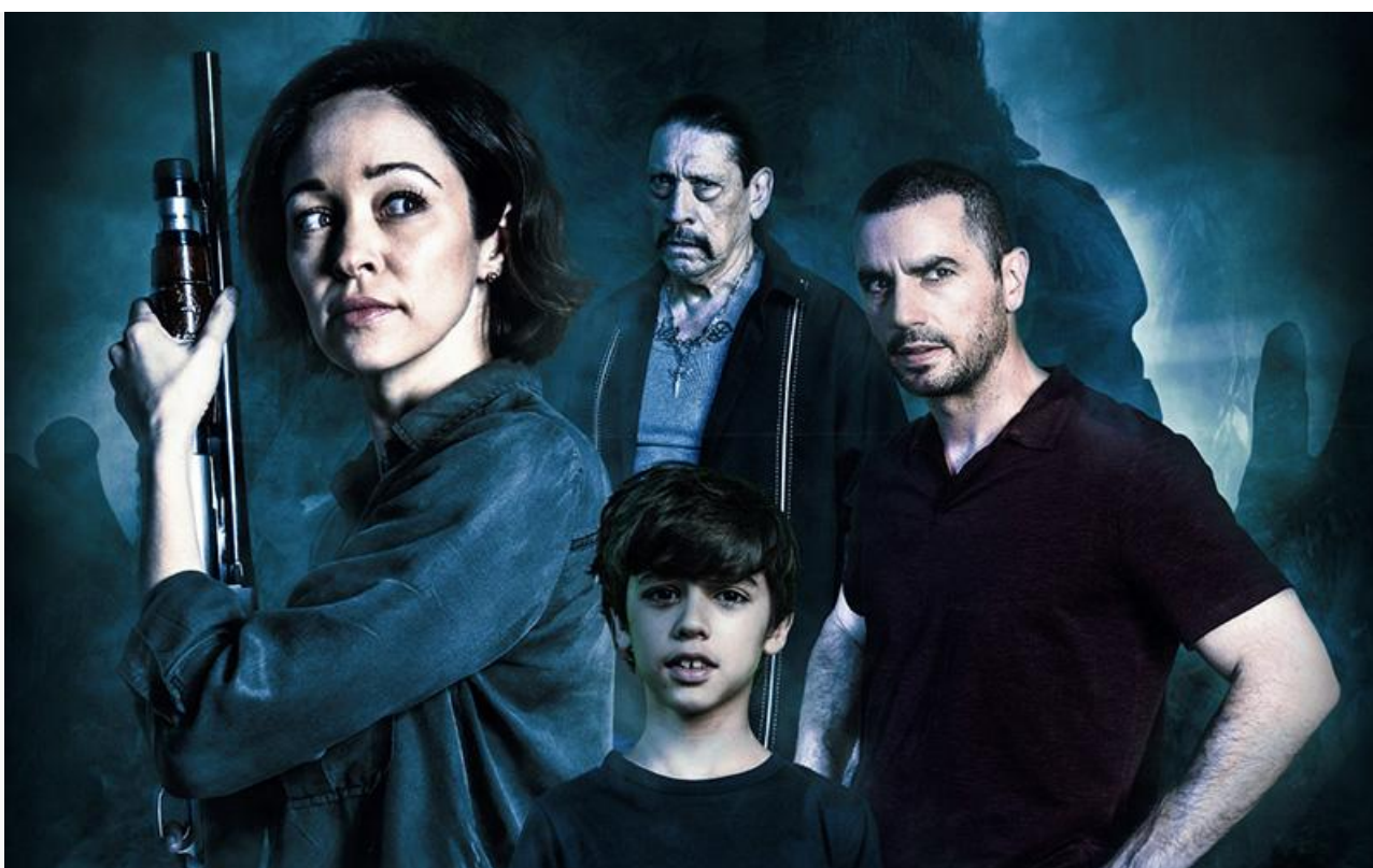
Постер к фильму «Проклятие плачущей. Возвращение»