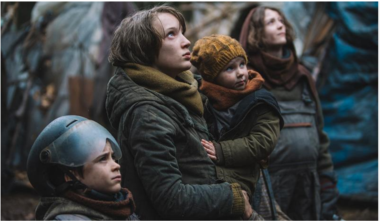
Кадр из фильма «Эра выживания»