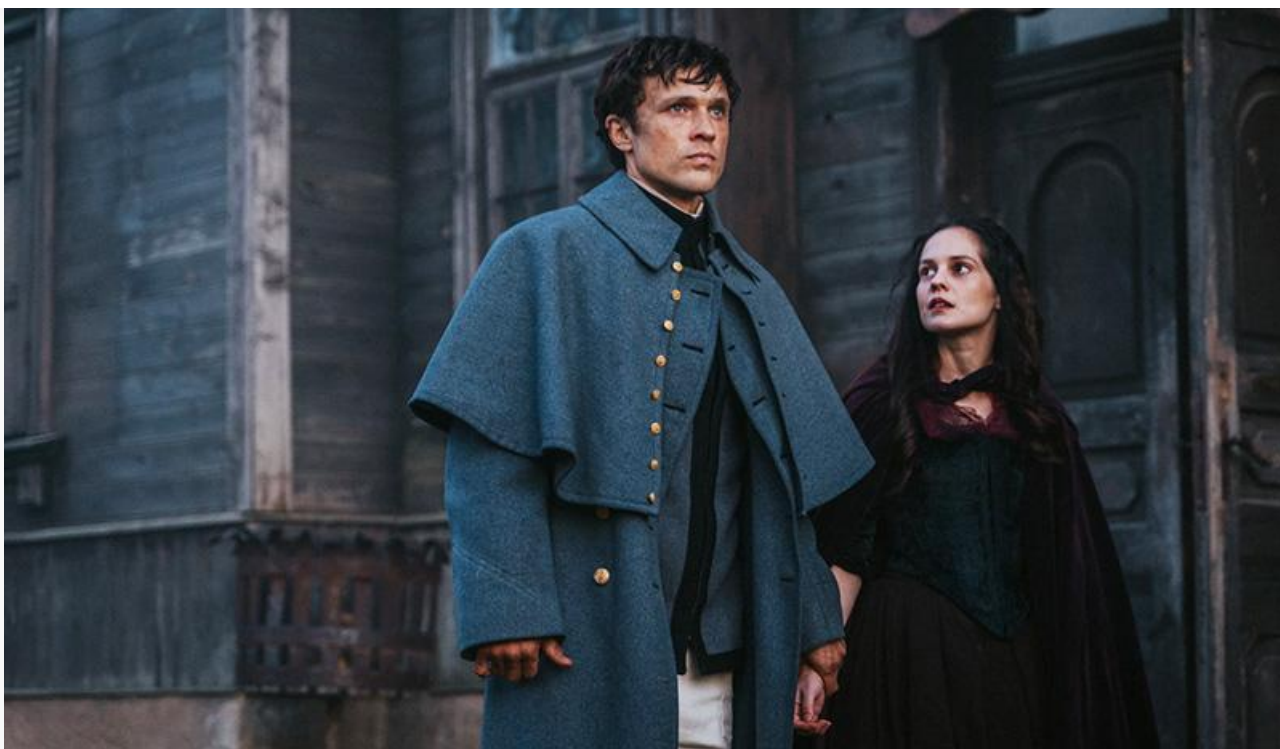
Кадр из фильма «Воронья лощина»