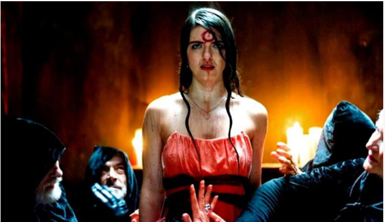
Кадр из фильма «Джиперс Криперс: Возрождённый»

Сразу четыре премьеры смогли в прошедшем уикенде попасть в топ-10 проката. Это уже упомянутая «Красная Шапочка», криминальный боевик Ричарда Хьюза « Барракуда » с Антонио Бандерасом и Кейт Босворт (9,4 миллиона и четвёртое место), триллер Кристофера Хаттона « Воронья лощина » (6,6 миллиона на шестое место) и фантастическая мелодрама Грега Бьоркмана « Время между нами » (5,1 миллиона и девятое место).