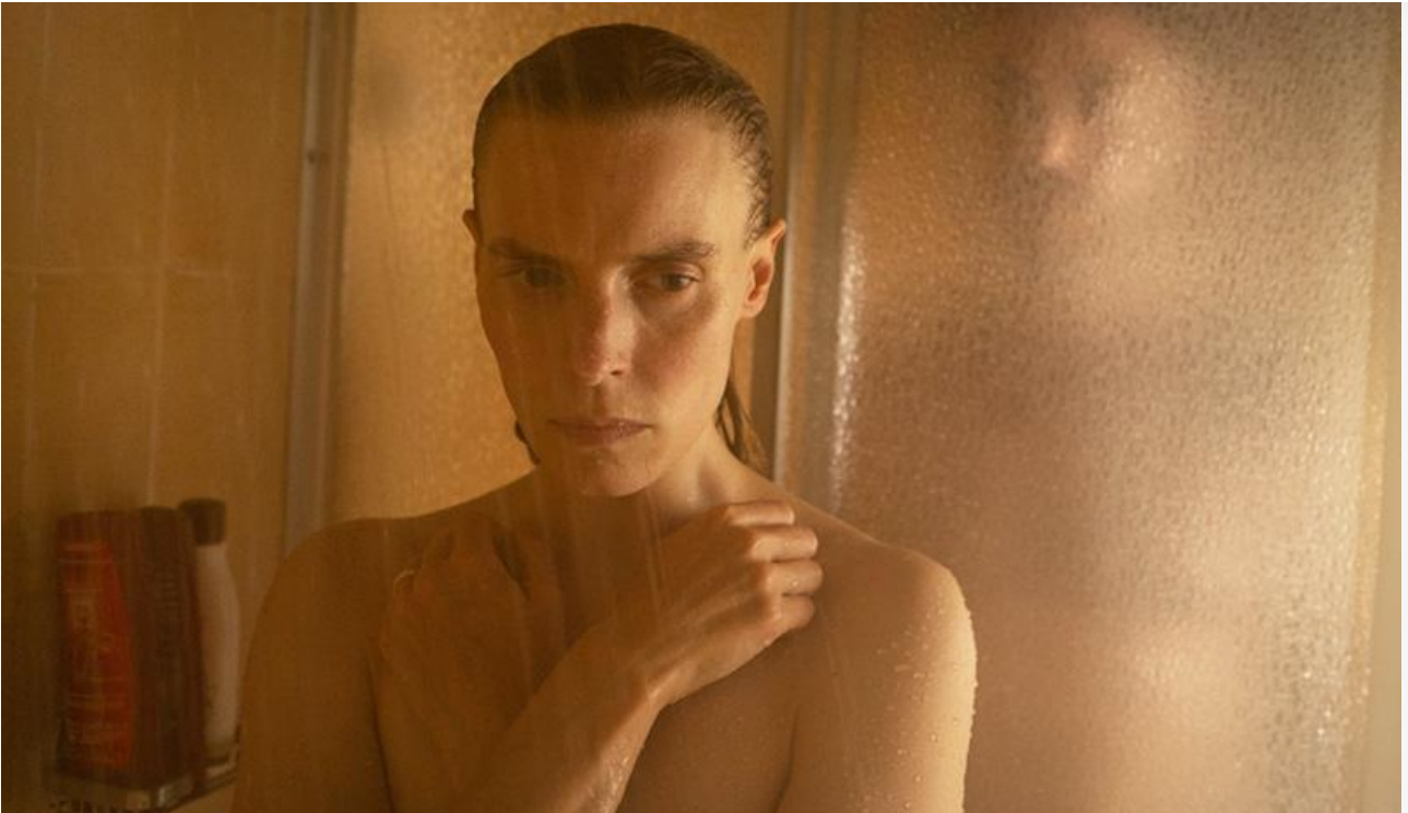
Кадр из фильма «Не говори никому»