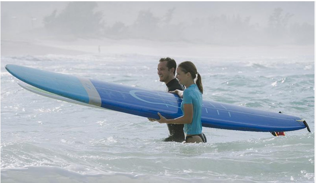
Кадр из фильма «Время между нами»

Общая касса топ-20 фильмов уикенда, по информации «Бюллетеня кинопрокатчика», составила 163 миллиона рублей. Это на 2,4 % меньше по сравнению с предыдущими выходными и на 71,9 % ниже показателя аналогичного уикенда прошлого года.