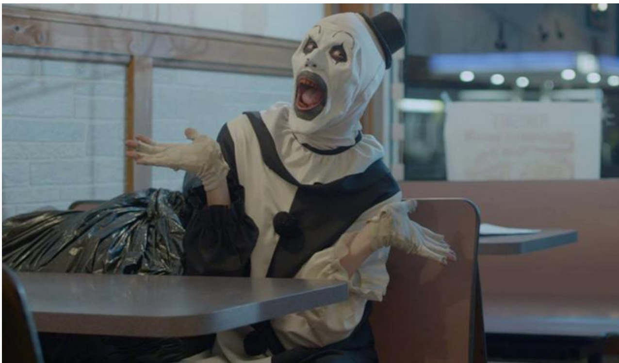
Кадр из фильма «Ужасающий»