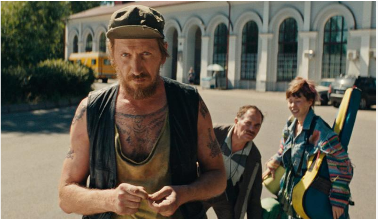
Кадр из фильма «Далёкие близкие»

Неплохие шансы на попадание в топ-10 по итогам уикенда у драмы Ильи Максимова «Мать моего сына» (18+) с Дарьей Жовнер, Евгением Ткачуком и Марьяной Спивак, датско-нидерландского триллера Кристиана Тафдрупа «Не говори никому» (18+), южнокорейского детективного триллера Пак Чхан-ука «Решение уйти» и канадо-мексиканского хоррора Патриции Харрис Сили «Проклятие плачущей. Возвращение» .