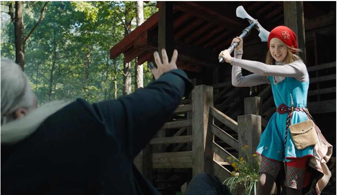
Кадр из фильма «Красная Шапочка»

«Красная Шапочка» стартовала успешнее таких отечественных семейных релизов, как «Артек. Большое путешествие» и «Календарь ма(й)я», и показала лучший старт среди российских премьер с начала лета.