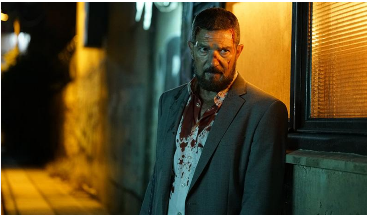
Кадр из фильма «Барракуда»

Сохранили места в топ-10 фильмов проката «Календарь ма(й)я» (7,6 миллиона и пятое место), «Пёс-самурай и город кошек» (6,4 миллиона и седьмое место), «Начать сначала» (5,8 миллиона и восьмое место) и «Барбоскины Team», с выручкой 4,7 миллиона замкнувшие десятку лучших.