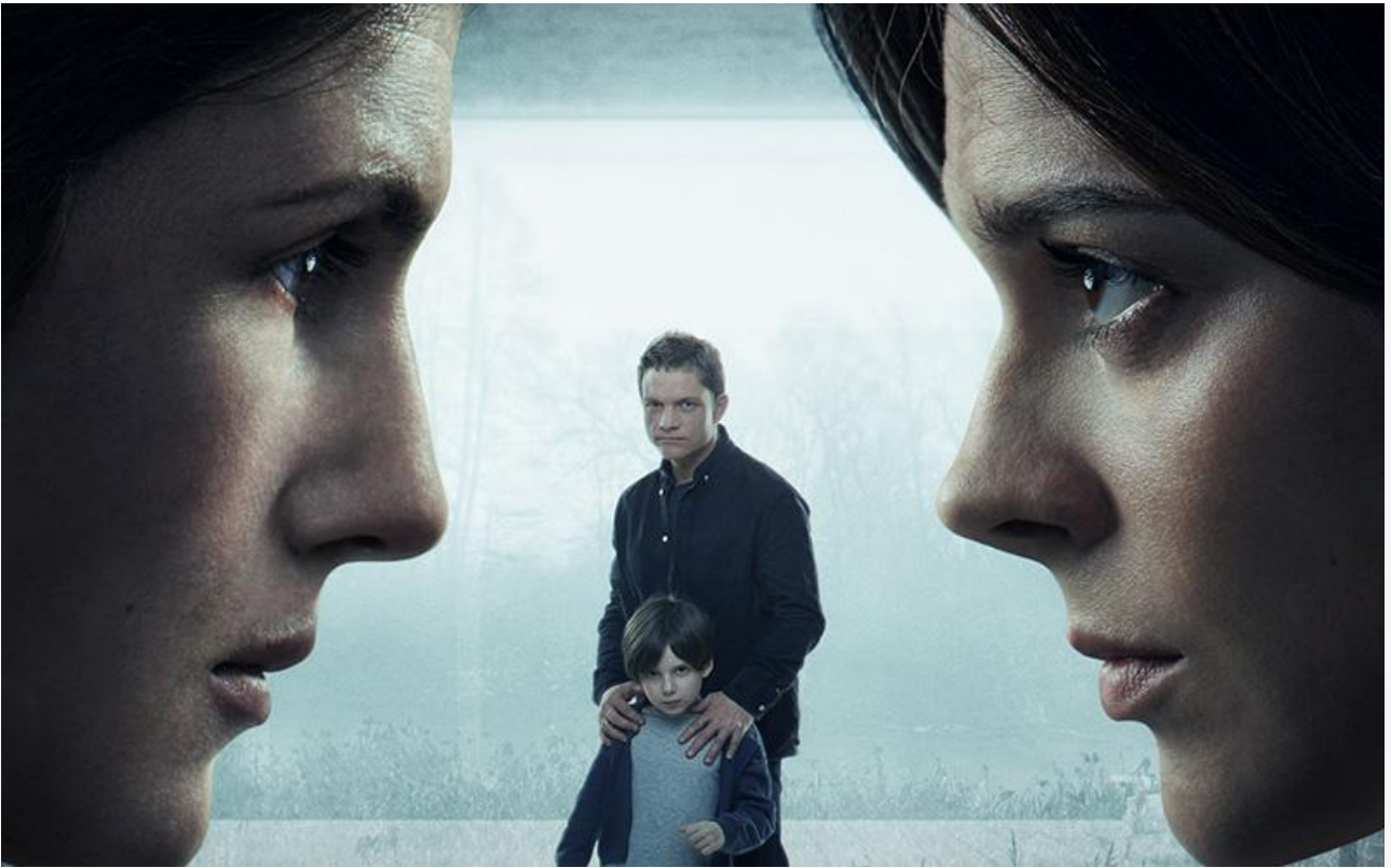
Постер к фильму «Мать моего сына»