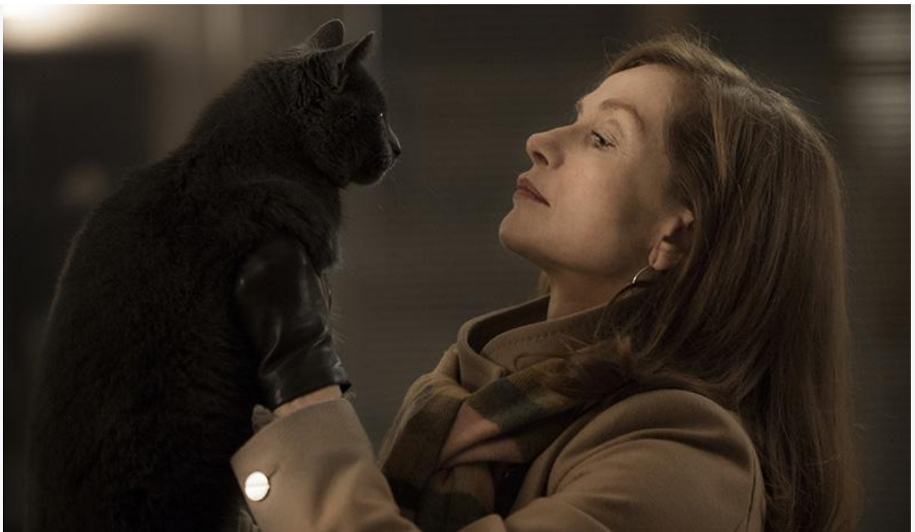
Кадр из фильма «Она»