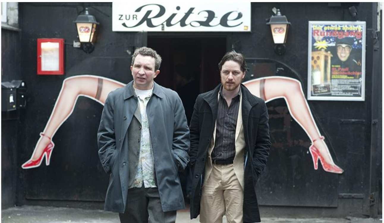
Кадр из фильма «Грязь»