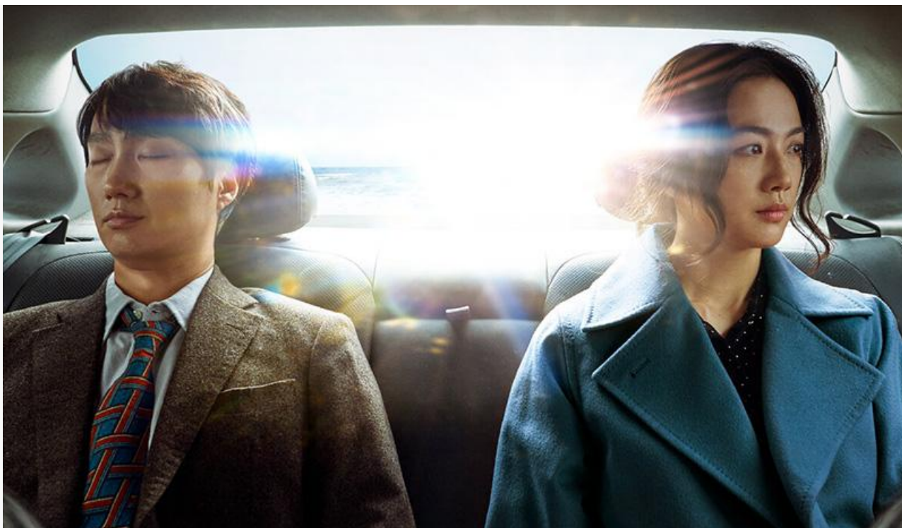
Постер к фильму «Решение уйти»