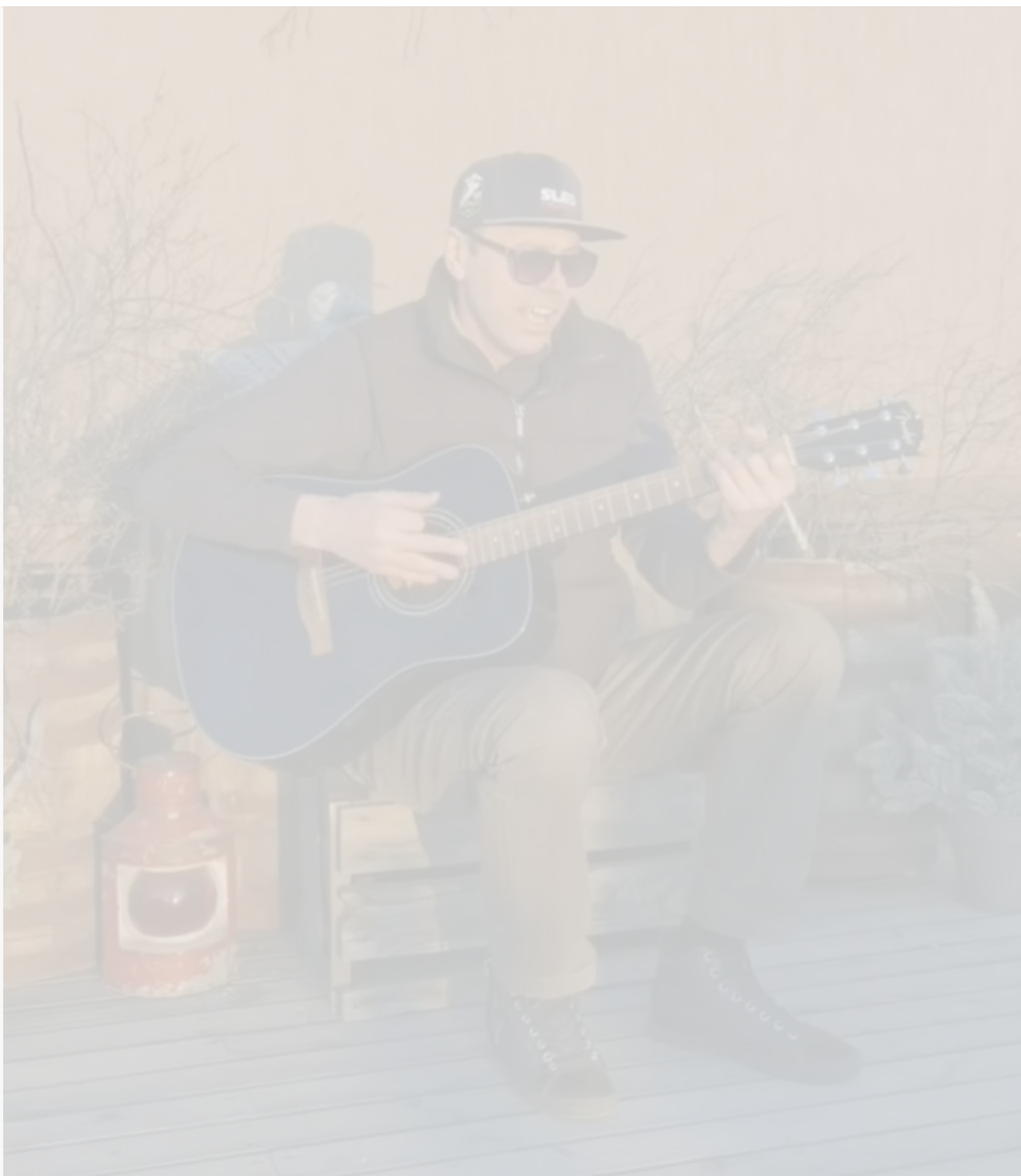
Иркутск. Дальше некуда (@irk_24):