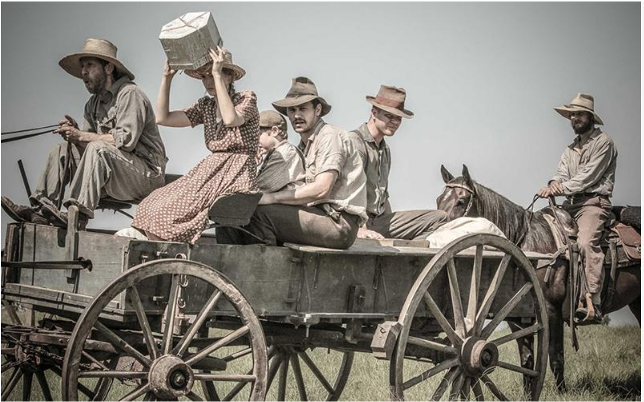
Кадр из фильма «Когда я умирала». США, 2013 год

Юбилеи писателей мы традиционно отмечаем публикацией цитат из их произведений. Сегодня это несколько циничные и не всегда благосклонные к роду человеческого мысли автора и фразы его героев из романов «Солдатская награда», «Шум и ярость», «Когда я умирала», «Свет в августе» и «Осквернитель праха».