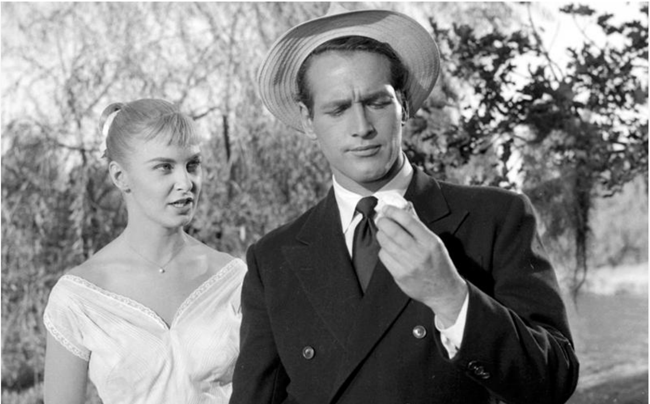
Кадр из фильма «Долгое жаркое лето». США, 1958 год