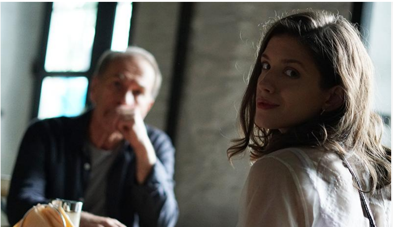
Кадр из фильма «Французский мастер»