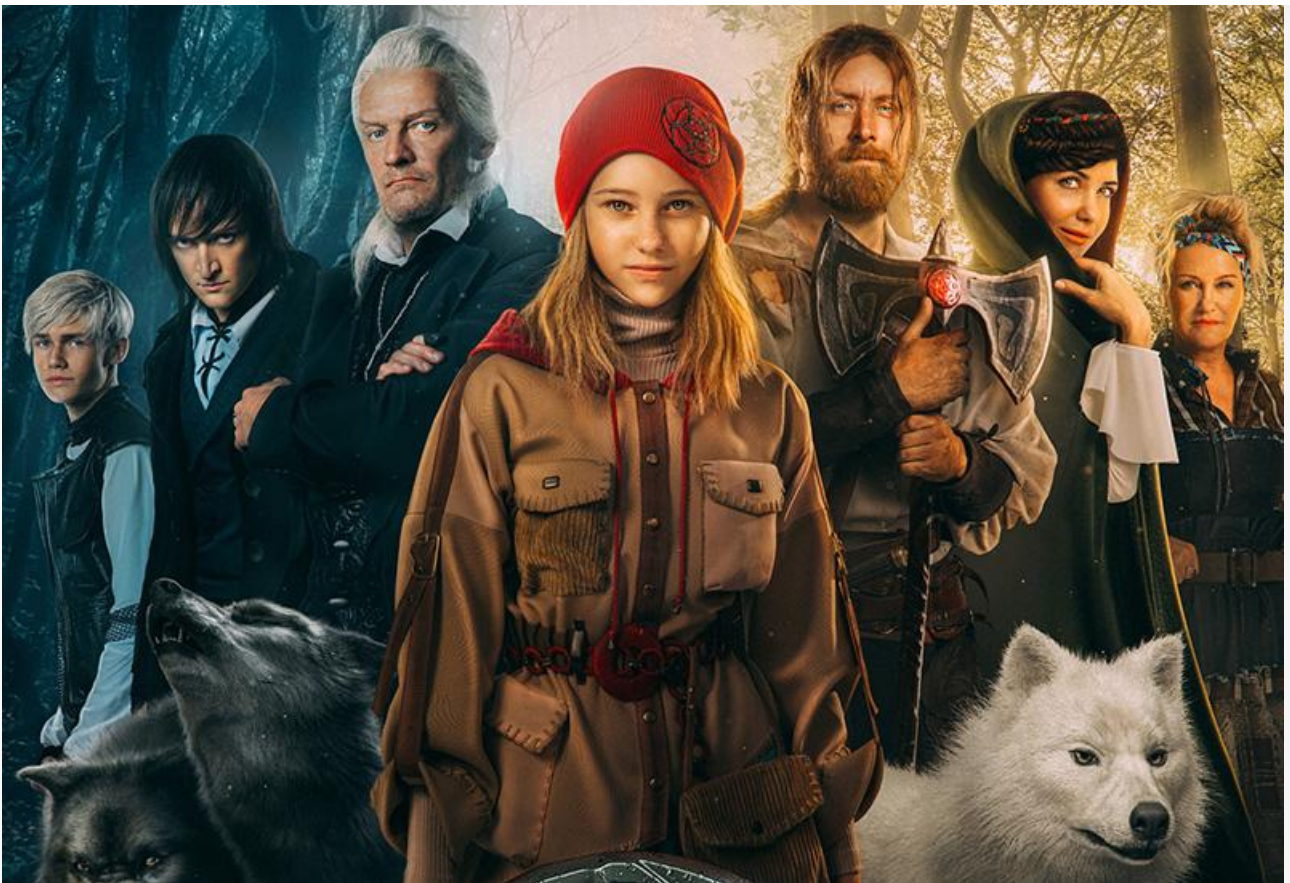
Постер к фильму «Красная шапочка»