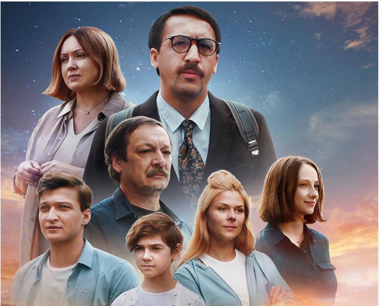
Постер к фильму «Вместе веселее»