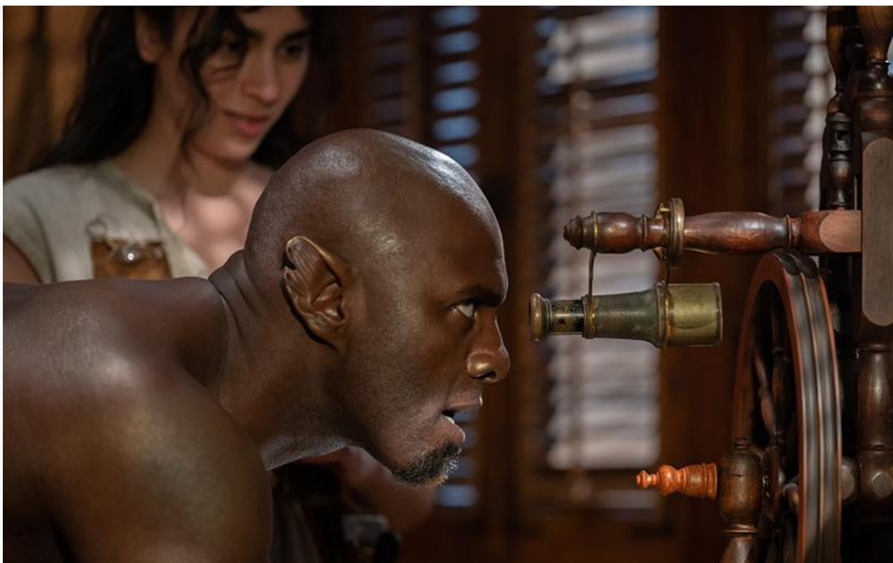
Кадр из фильма «Три тысячи лет желаний»

Отметим разницу «сарафанов» двух лидеров, и многое станет ясным. Рейтинг фэнтези Миллера на портале «КиноПоиск» – 7,0, рейтинг хоррора Вуоренсолы – всего 3,7.