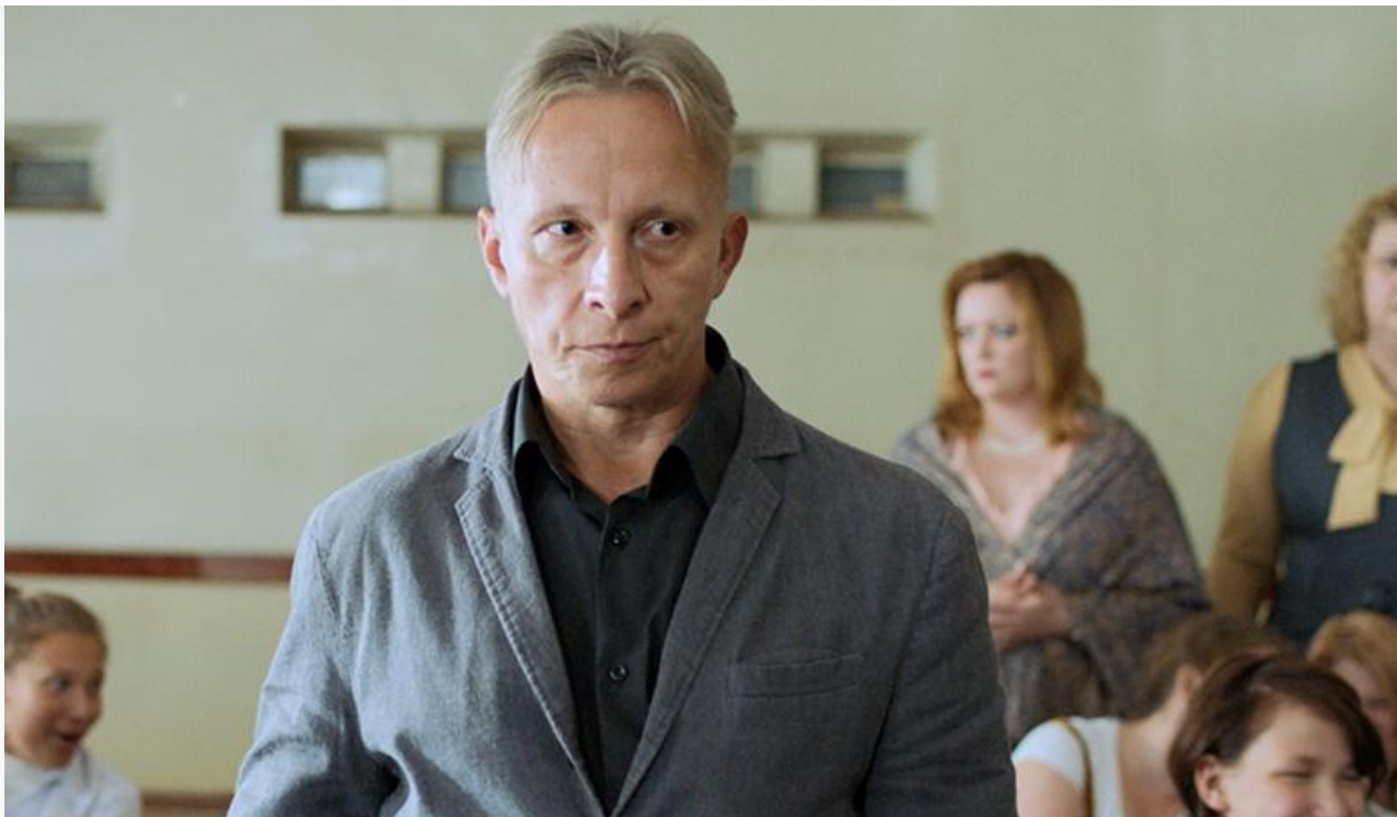
Кадр из фильма «Недетский дом»

Феерично проваливается в российском прокате «Ирония судьбы в Голливуде» . В своём втором уикенде американская комедия российского режиссёра Марюса Вайсберга умудрилась на рекордном числе экранов (1 804) показать рекордное же падение сборов (минус 58 %). Как результат – 6,6 миллиона и восьмое место.