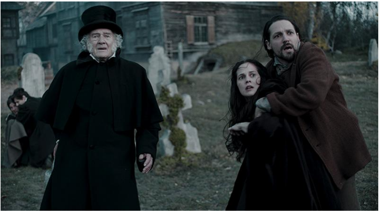
Кадр из фильма «Воронья лощина»