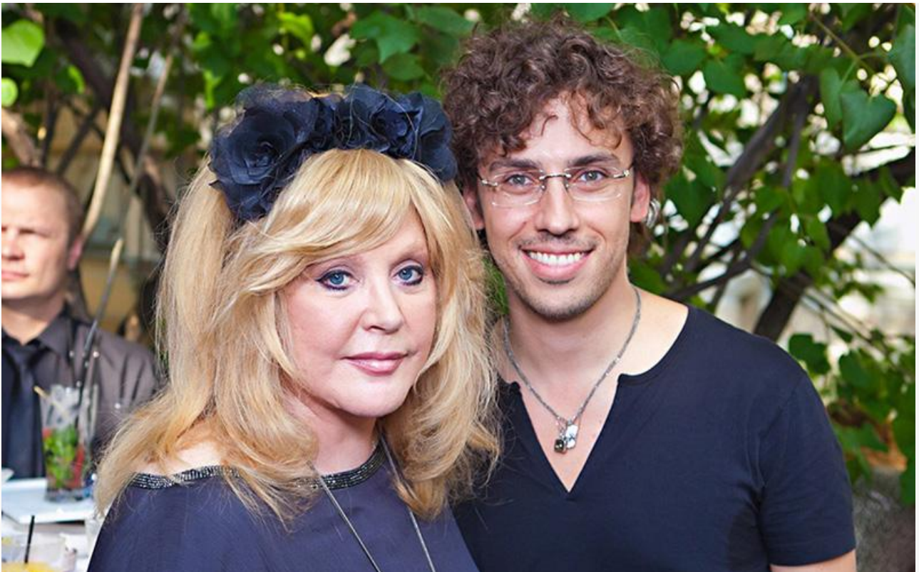
Чета «иноагентов»: действующий и потенциальный

Произошло это вскоре после того, как к иностранным агентам причислили её мужа – известного юмориста и телеведущего Максима Галкина.