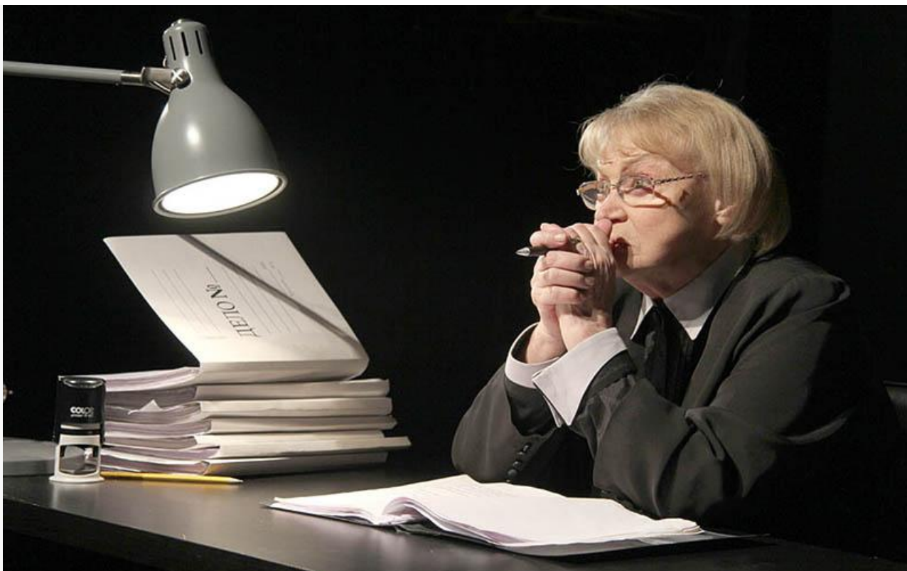
Кошон в спектакле «Жаворонок». МХТ имени Чехова, постановка 2012 года