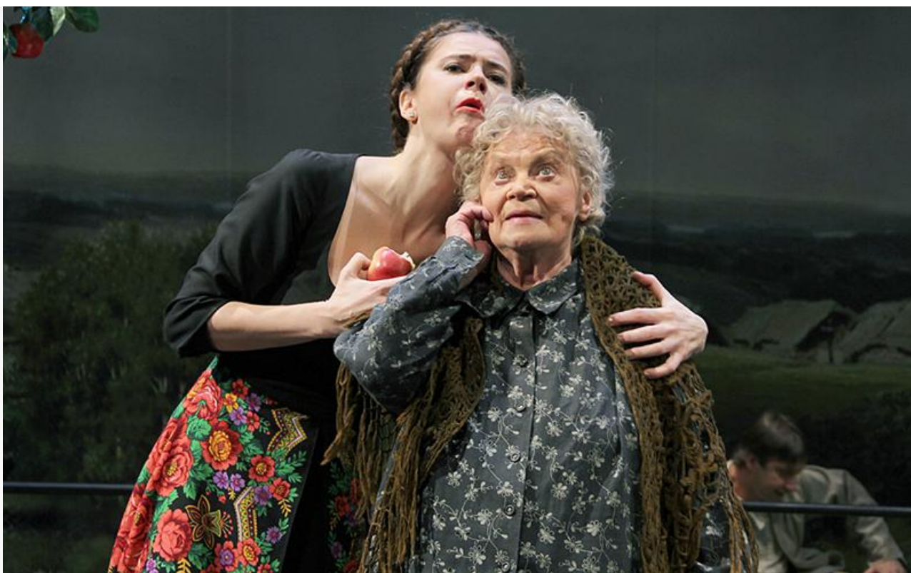
Филицата в спектакле «Правда – хорошо, а счастье лучше». МХТ имени Чехова, постановка 2015 года