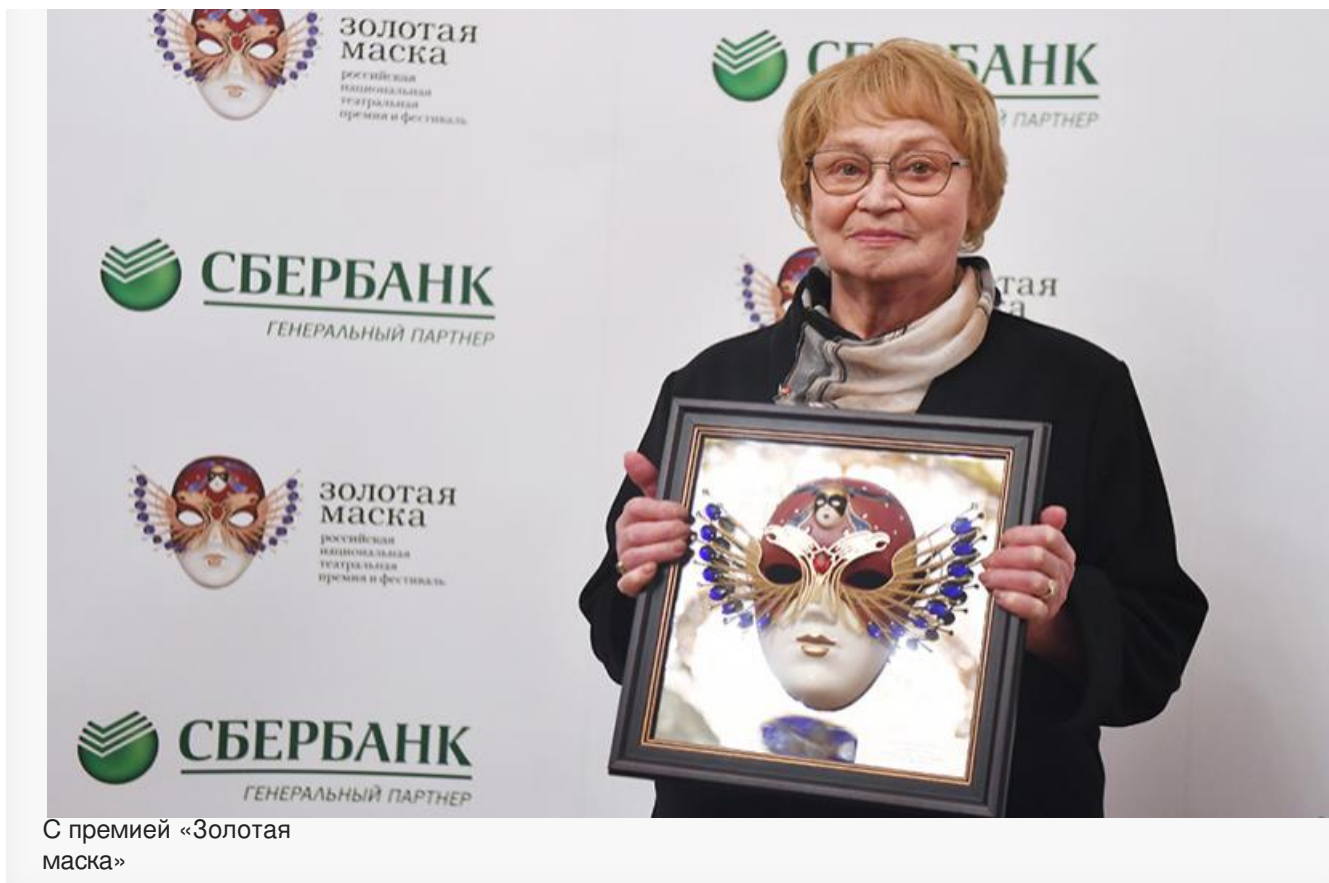
С премией «Золотая маска»

Легендарной актрисы нет с нами уже более трёх лет. Алла Борисовна Покровская скончалась 25 июня 2019 года на 82 году жизни. После церемонии прощания в Художественном театре народную артистку похоронили на Троекуровском кладбище Москвы рядом с могилой матери.