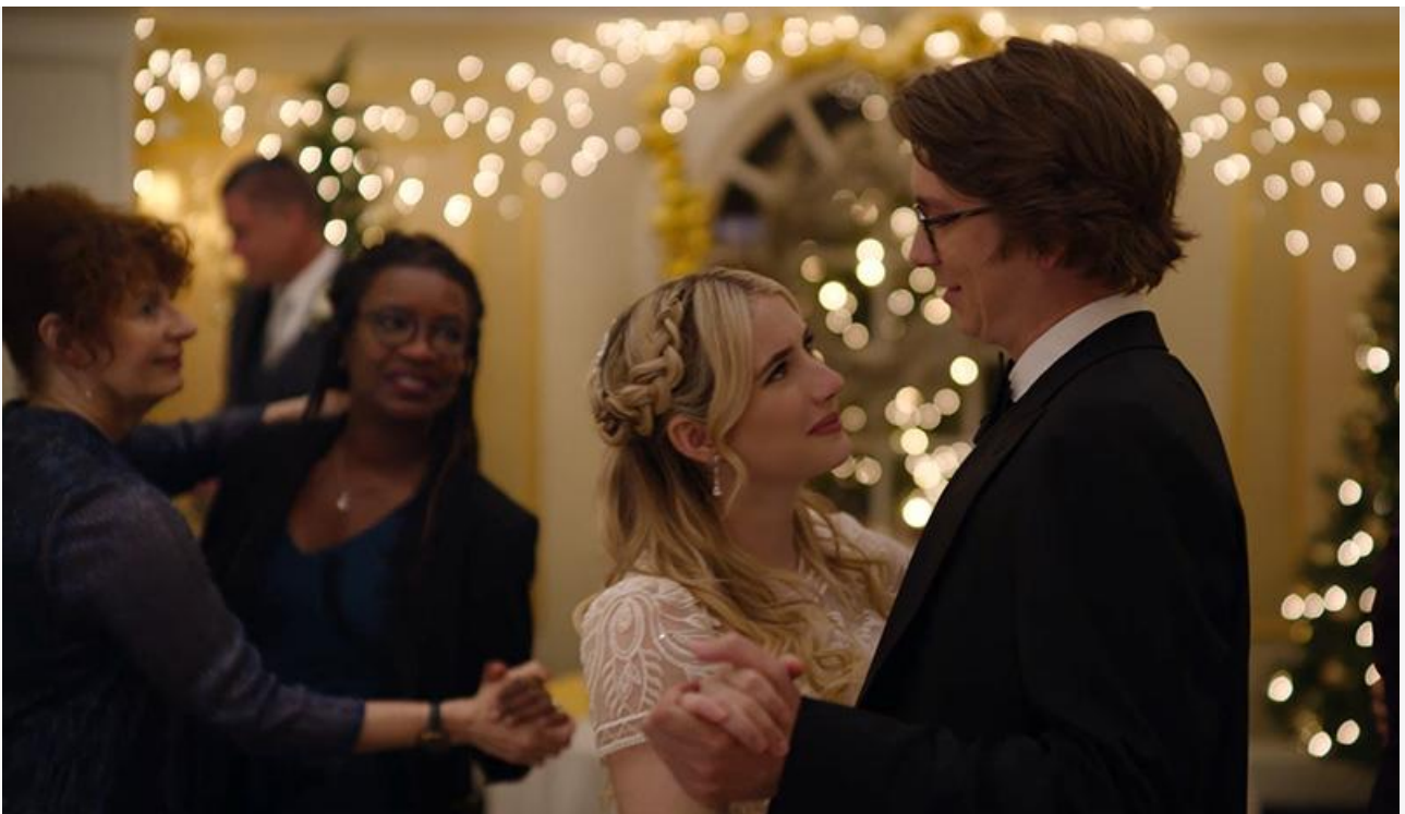
Кадр из фильма «Ирония судьбы в Голливуде»

Посмотрим, каким будет «сарафан» и как сильно упадут сборы американской «Иронии» после второго уикенда. Пока рейтинг фильма на портале «КиноПоиск» замер на оценке 5,9. По сравнению с другими «шедеврами» Вайсберга – не самый плохой результат.