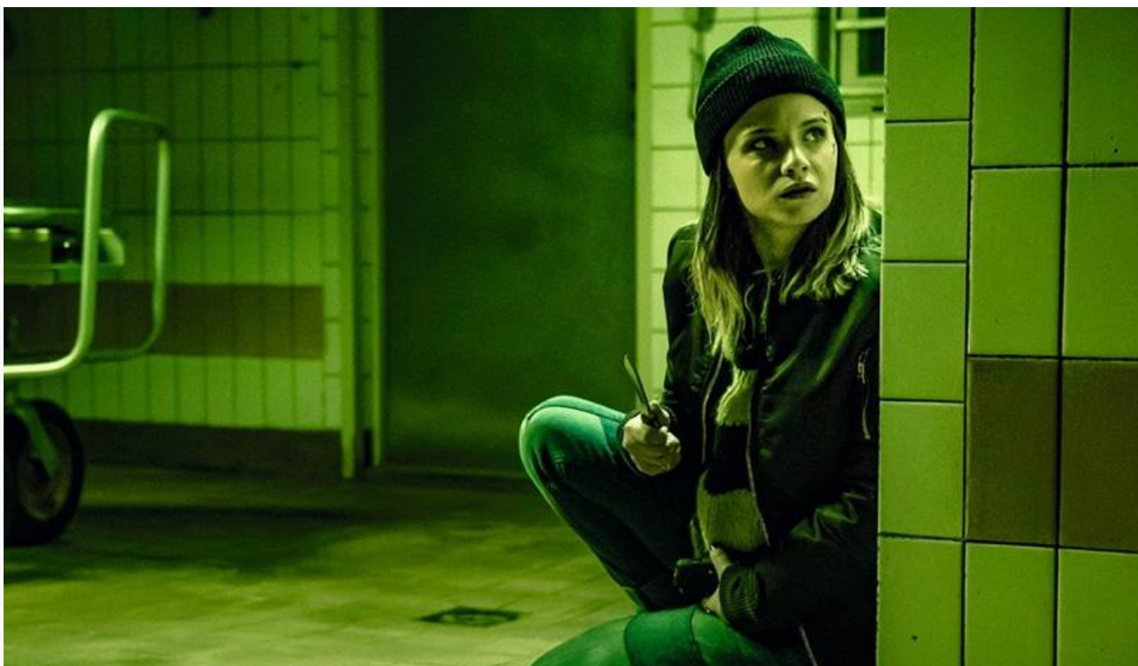
Кадр из фильма «Звонок мертвецу»