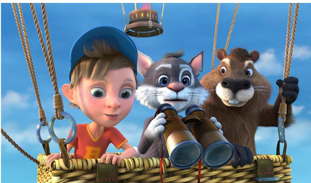
Кадр из фильма «Два хвоста»