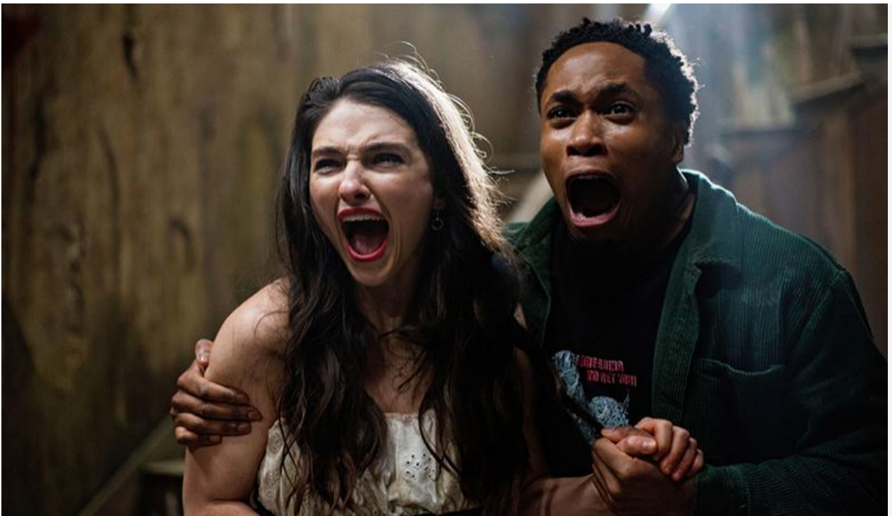
Кадр из фильма «Джиперс Криперс: Возрождённый»