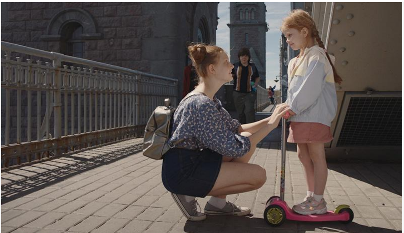
Кадр из фильма «Календарь ма(й)я»

Сохранили места в топ-10 «Барбоскины Team» (9,8 миллиона и шестое место), «Вышка» (8,4 миллиона и седьмое место), «Пёс-самурай и город кошек» (6 миллионов и восьмое место) и «Турбозавры, вперёд!» (4,3 миллиона и десятое место).