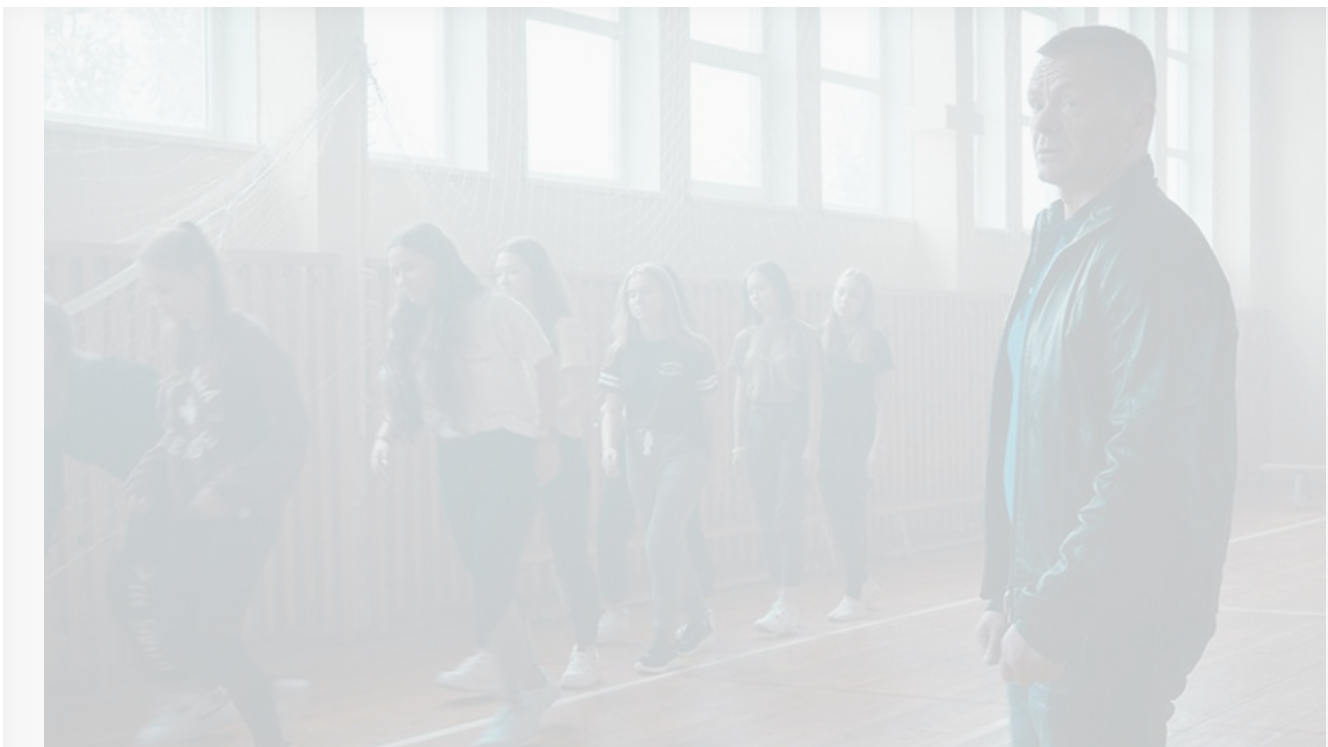
Кадр из фильма «Начать сначала»

Ну а лидером проката с огромным отрывом от конкурентов стала романтическая фэнтезийная мелодрама Джорджа Миллера «Три тысячи лет желаний» . Австралийско-американской новинке было выделено всего 1 057 экранов и присвоена возрастная маркировка «18+», что не помешало ей заработать за свои первые выходные в России 49,5 миллиона рублей.