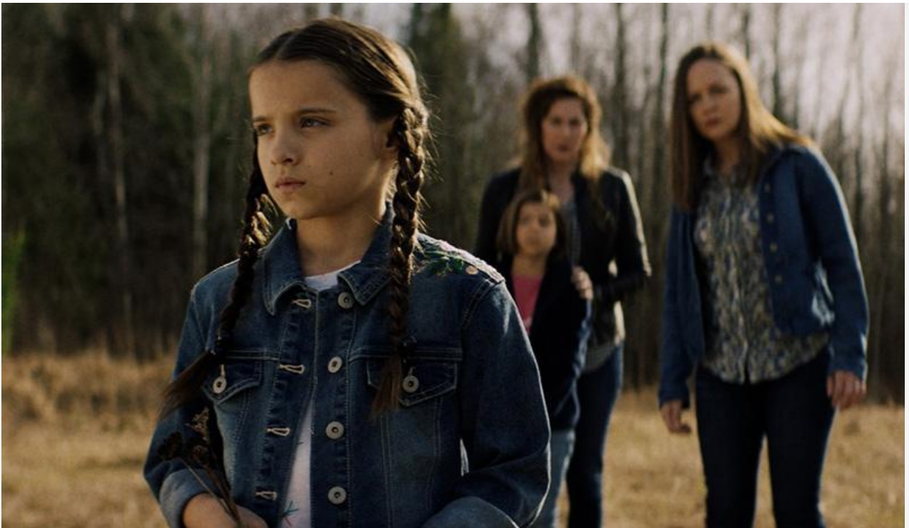
Кадр из фильма «Проклятая»

Общая касса топ-20 фильмов уикенда, по информации «Бюллетеня кинопрокатчика», составила 164 миллиона рублей. Это на 8 % меньше по сравнению с предыдущими выходными и на 61,3 % ниже показателя аналогичного уикенда прошлого года.