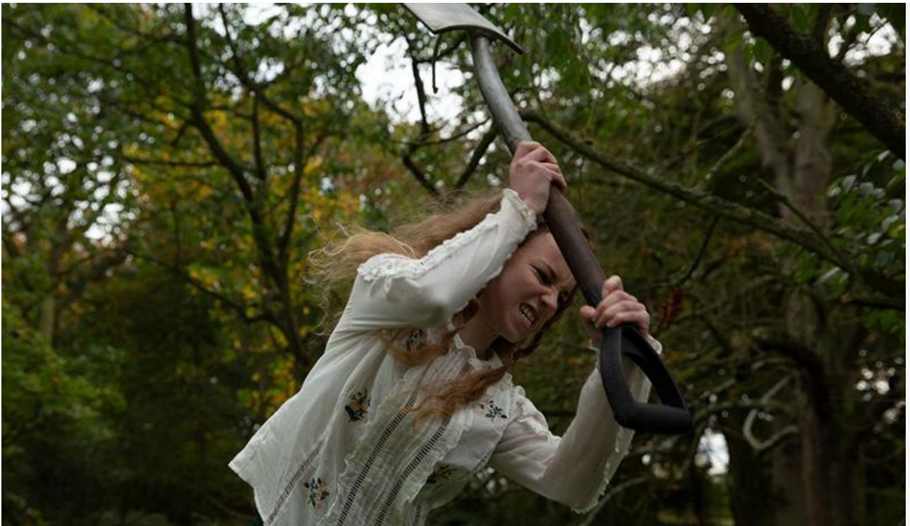
Кадр из фильма «Проклятие мачехи»