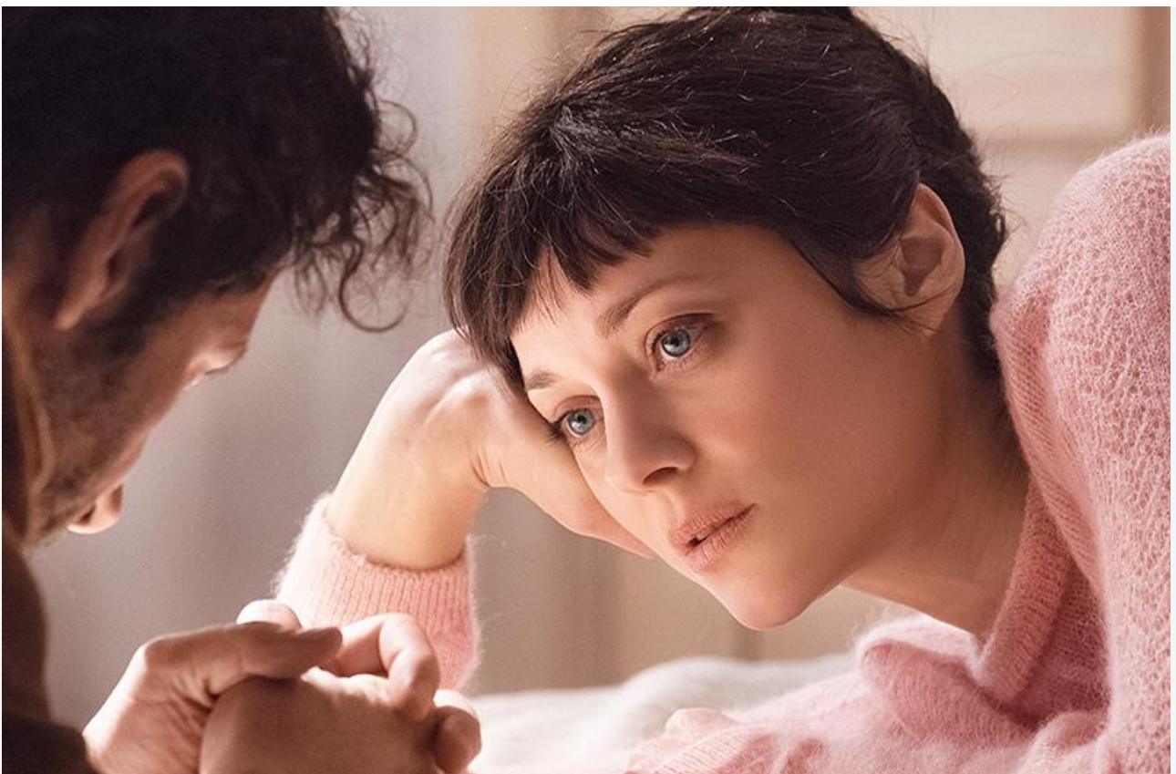
Постер к фильму «Брат и сестра»

Впервые будут показаны в российских кинотеатрах фэнтезийное аниме Хиромасы Ёнэбаяси «Воспоминания о Марни» , снятое в 2014 году, и музыкальная драма Тома Лоу 2018 года «Пробуждение» .