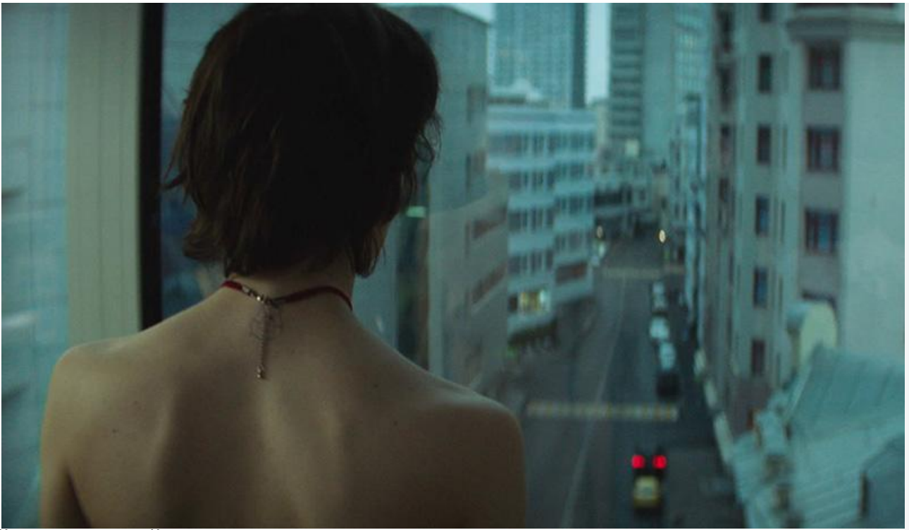
Кадр из фильма «Кэт»