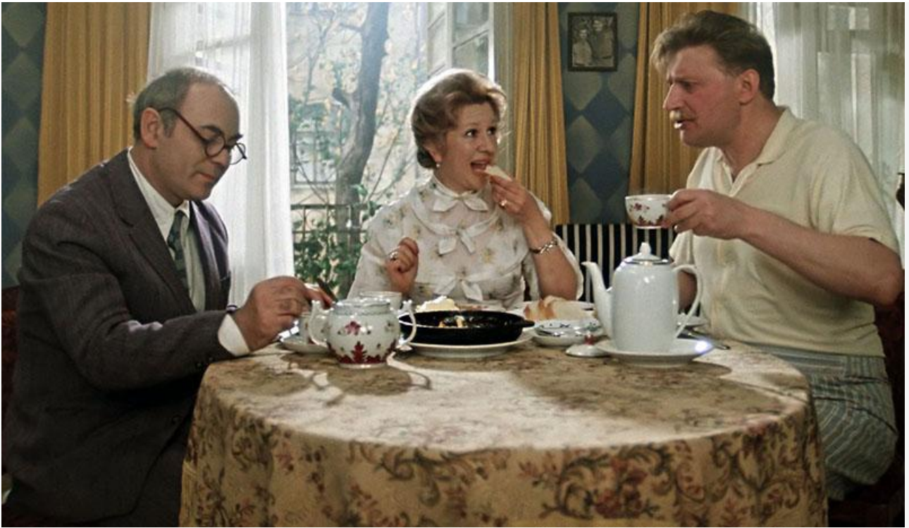
Кадр из фильма «Покровские ворота»