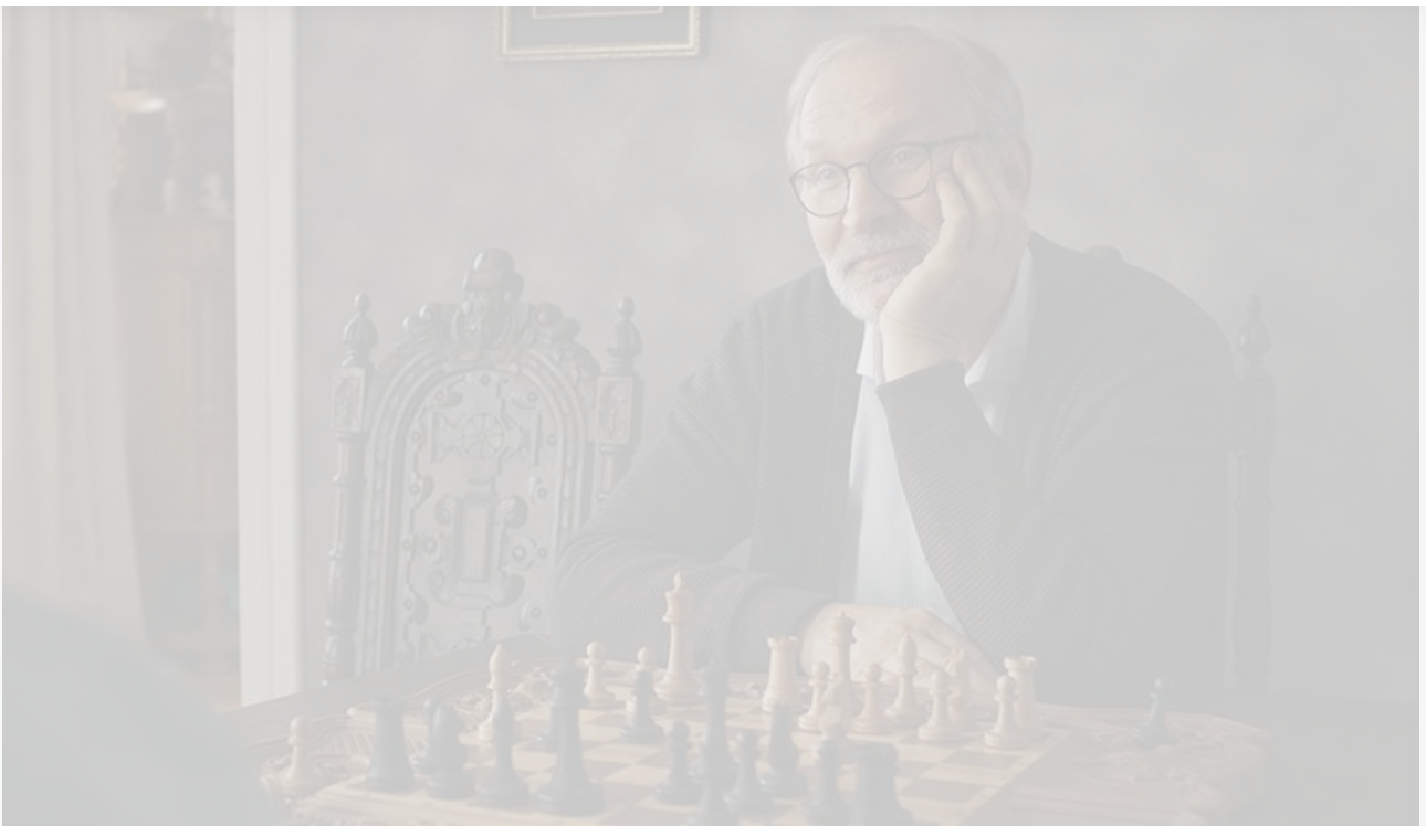
Кадр из фильма «Календарь ма(й)я»

На показателях лидера прошлого уикенда – американской мелодрамы Кастиль Лэндон « После. Долго и счастливо » – не мог не сказаться отрицательный «сарафан»: рейтинг картины на портале «КиноПоиск» всего 5,1. В результате сборы фильма упали сразу на 46 %, и после 64 миллионов на старте проката за свой