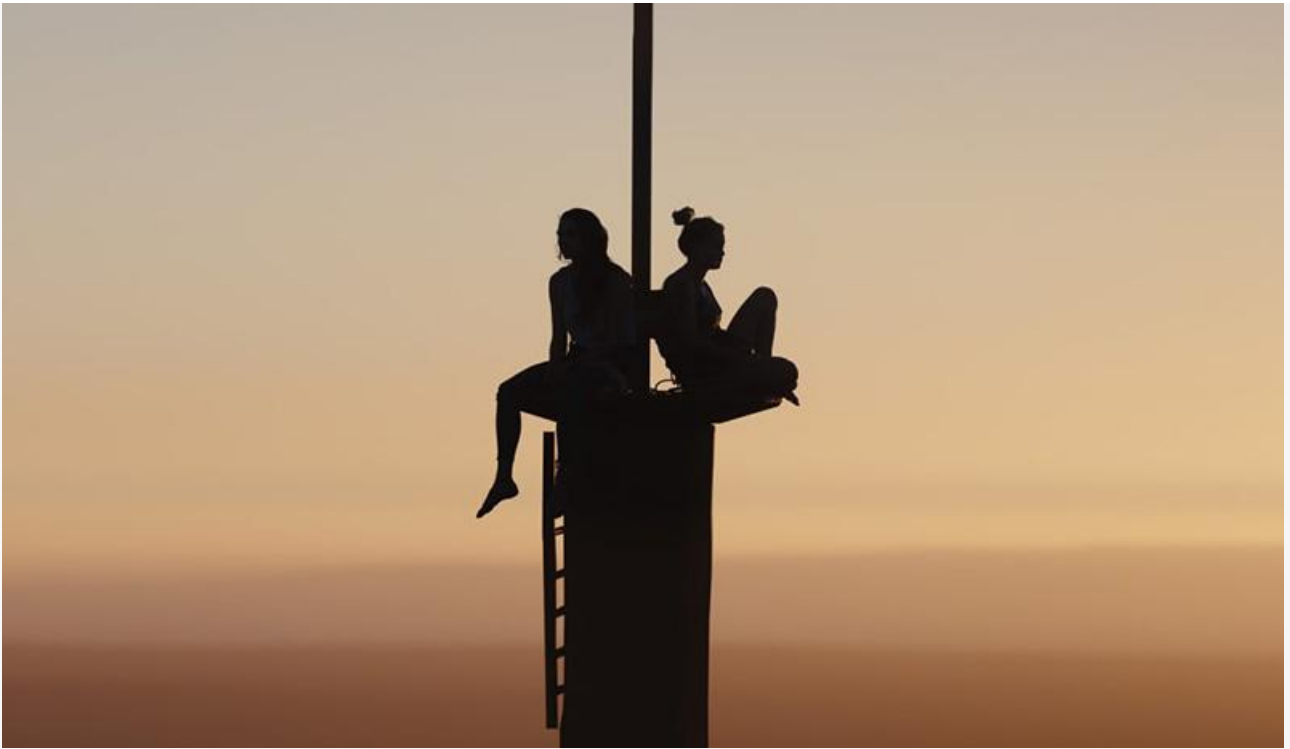
Кадр из фильма «Вышка»