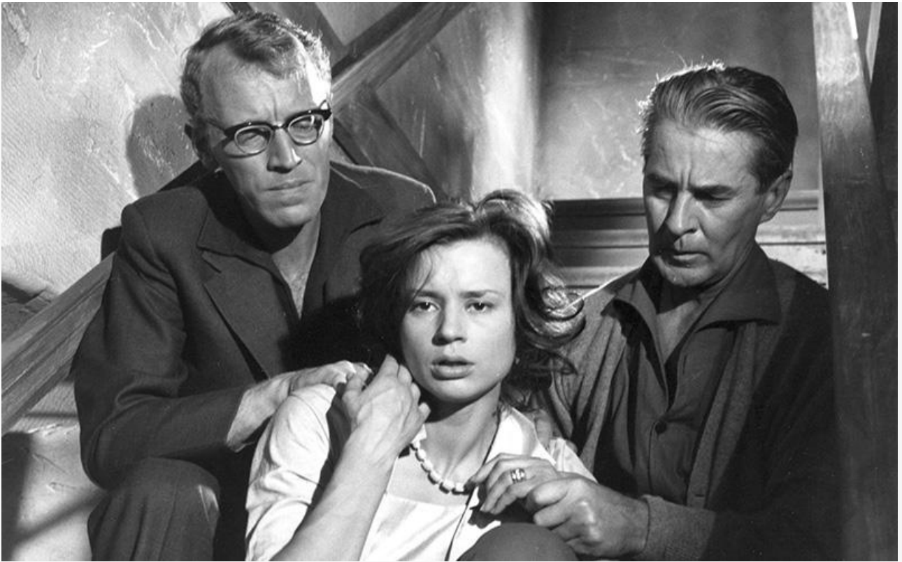
Кадр из фильма «Сквозь тёмное стекло»