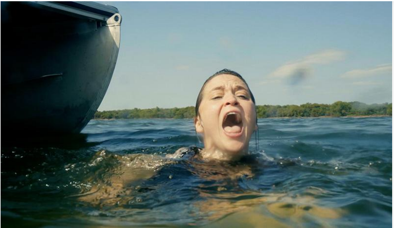
Кадр из фильма «Тихое озеро»

Кроме того, в наступившем уикенде впервые на большом экране россияне смогут увидеть знаменитые кинодрамы Ингмара Бергмана «Сквозь тёмное стекло», «Молчание» (18+), «Шёпоты и крики» (18+) и «Осенняя соната», снятые соответственно в 1961, 1963, 1972 и 1978 годах, но не выходившие в советский прокат, а также культовую комедийную мелодраму Михаила Козакова 1982 года «Покровские ворота», которая ранее демонстрировалась исключительно по телевидению и на онлайн-платформах.