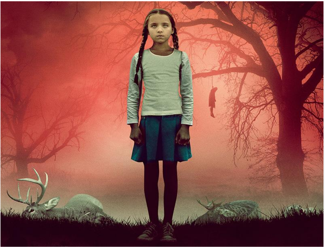
Постер к фильму «Проклятая»