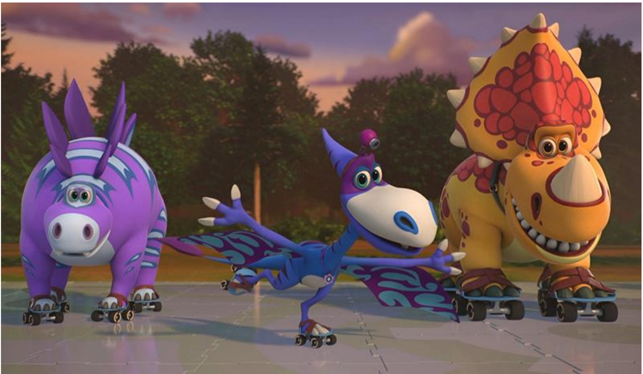
Кадр из фильма «Турбозавры, вперёд!»