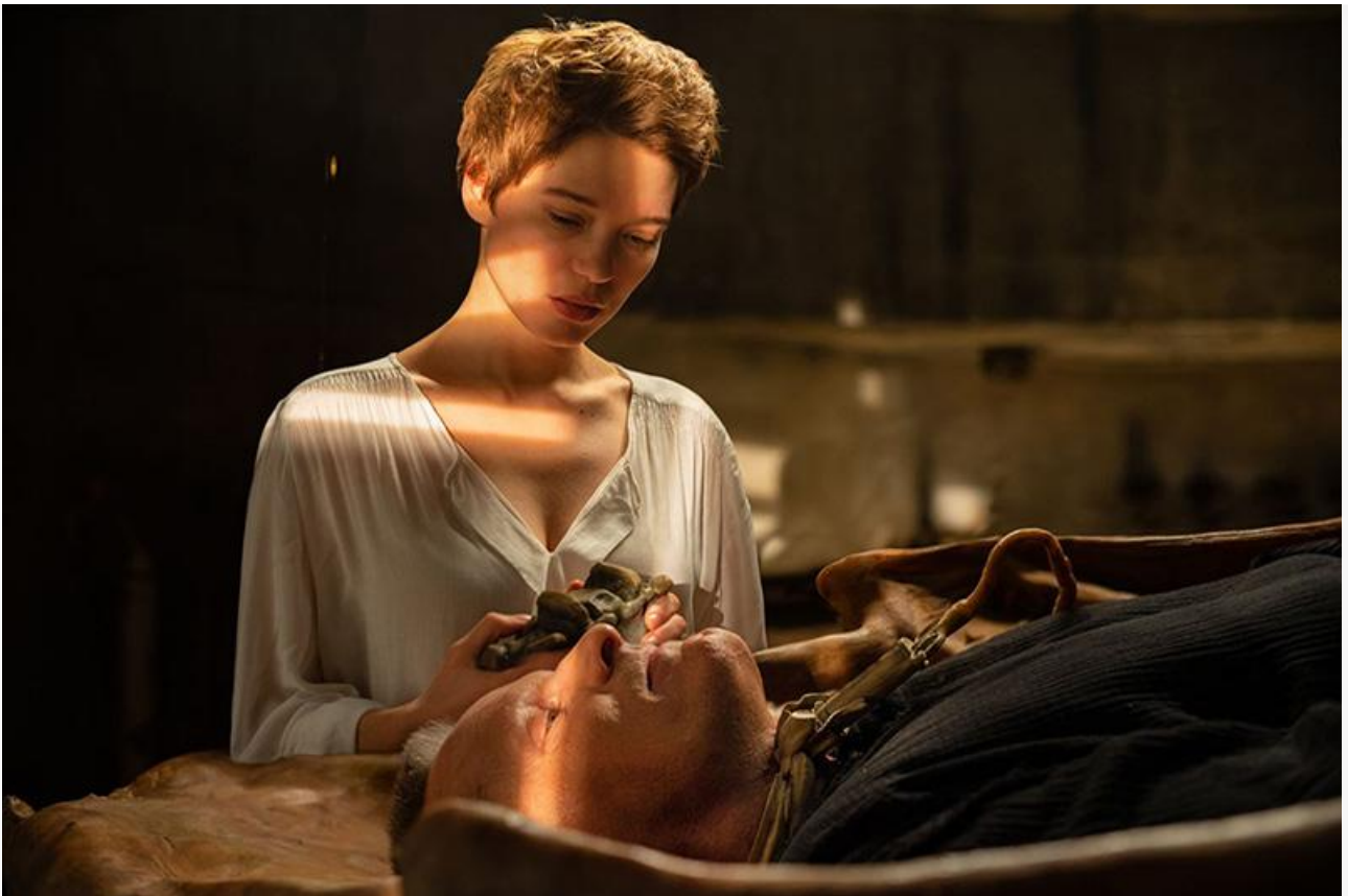
Кадр из фильма «Преступления будущего»