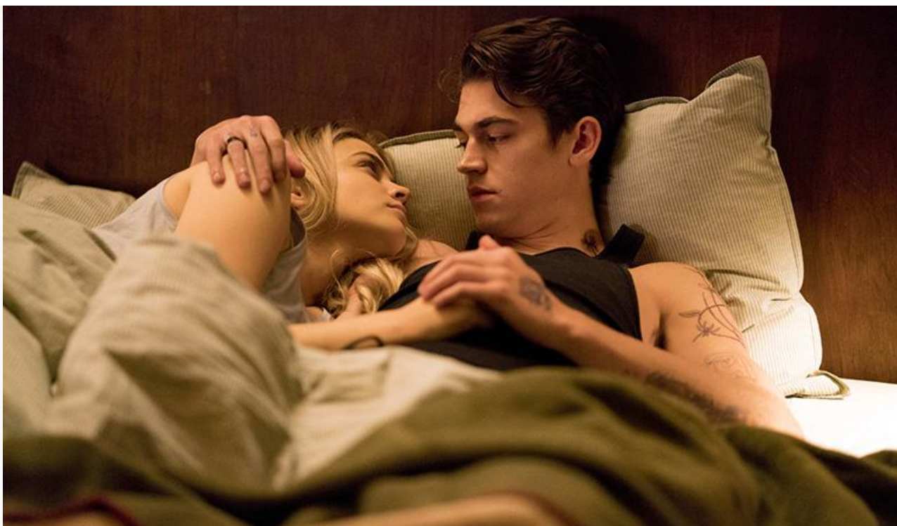
Кадр из фильма «После. Долго и счастливо»

Замкнули тройку лидеров с прибылью 19,4 миллиона рублей мультипликационные « Барбоскины Team ».