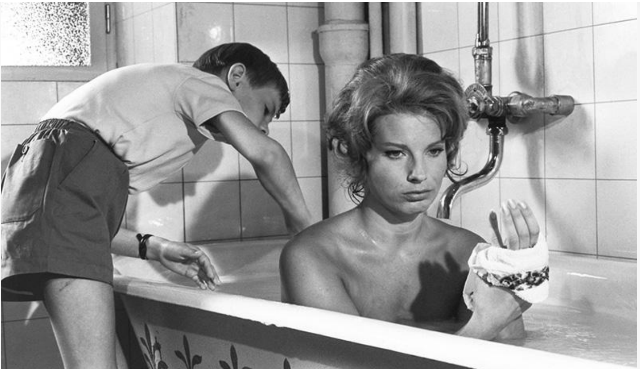
Кадр из фильма «Молчание»