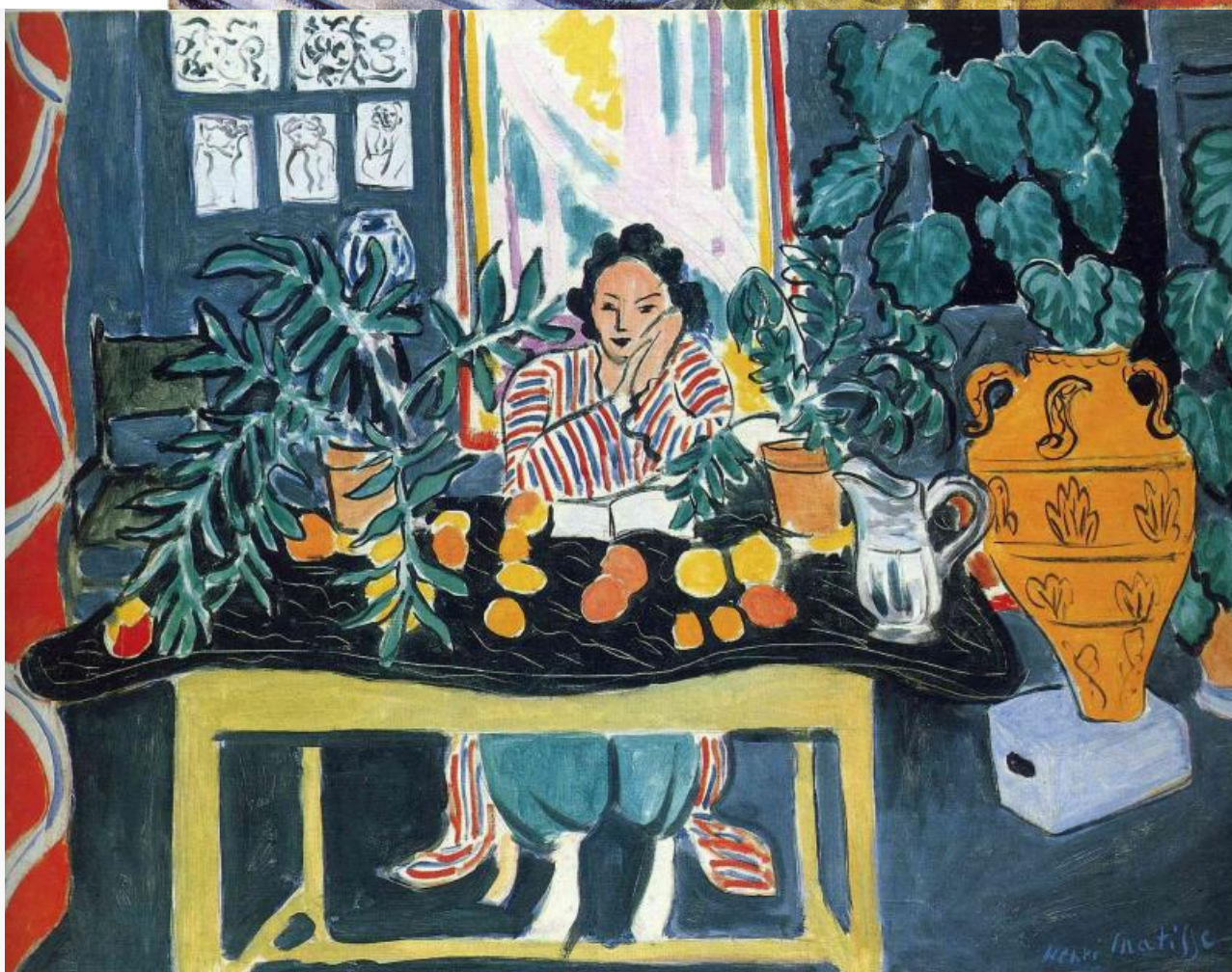
«Интерьер с этрусской вазой», Анри Матисс. 1940