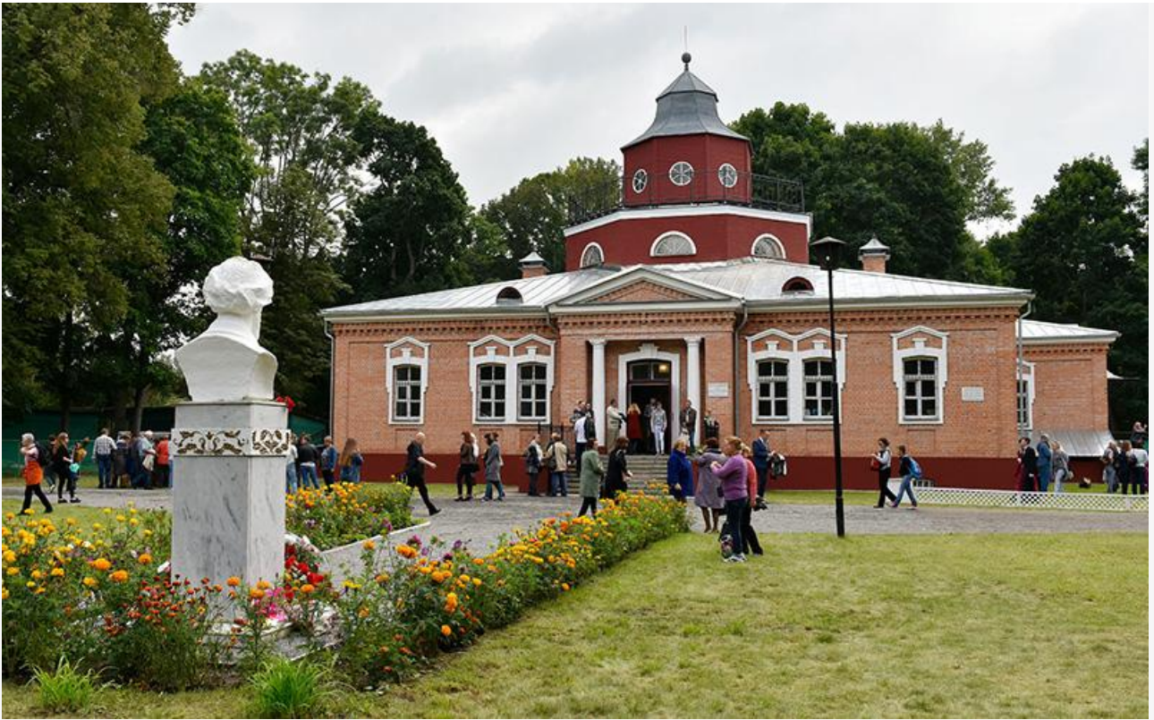
Дом-музей А. К. Толстого в селе Красный Рог Брянской области

Литературную деятельность будущий член-корреспондент Императорской Санкт-Петербургской академии наук начал с фантастических рассказов на французском языке «Семья вурдалака» и «Встреча через триста лет». Однако дебютным произведением писателя считается готическая повесть «Упырь», опубликованная Алексеем Константиновичем Толстым в 1841 году под псевдонимом Красногорский.