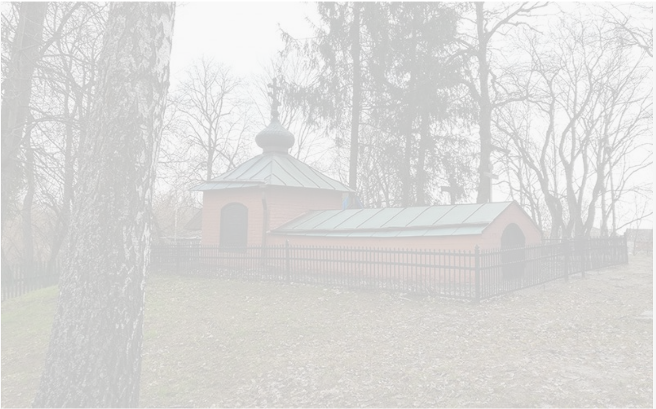
Часовня-усыпальница А. К. Толстого и его супруги Софьи Андреевны в селе Красный Рог

Юбилеи писателей мы традиционно отмечаем публикацией цитат из их произведений. Сатирическая поэма в 83 стихах «История государства российского от Гостомысла до Тимашева» была написана Толстым в 1868 году и получила широкое распространение в обществе. Однако из-за цензурных ограничений официально поэма была опубликована лишь спустя 15 лет, когда её автора уже не было в живых.