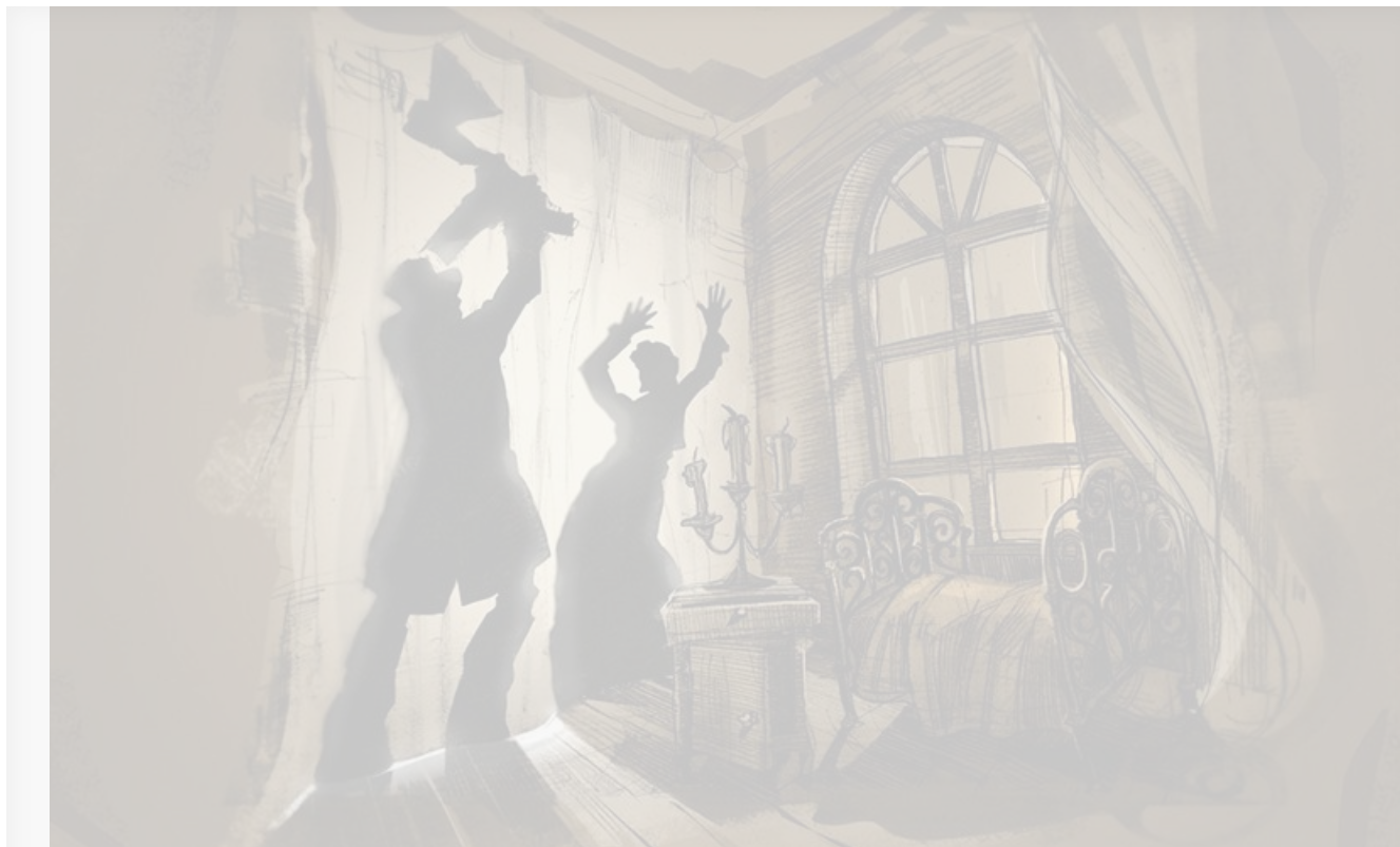
Иллюстрация к роману «Преступление и наказание»

Из России, где в школах изучают «Преступление и наказание» Достоевского с кровавым двойным убийством, истязанием детей, жестоким обращением с животными, пьянством, проституцией, домогательствами, самоубийствами и прочими «триггерами», наблюдать за происходящим за рубежом смешно. У нас через «стрессогенный кордон» не прошли бы ни «Пиковая дама», ни «Анна Каренина», ни «Гроза» с «Бесприданницей», ни Достоевский с Куприным в полном собрании.