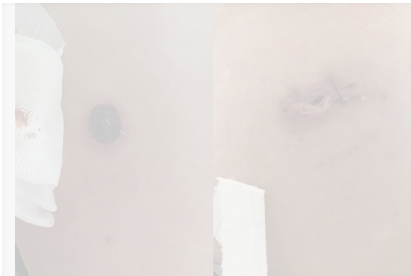
Пулевые ранения от охранников компании «Байкалкварцсамоцвет ы»

В Окинском районе Бурятии бьют тревогу. Охранники геолого-промышленной компании якобы обстреливают местных жителей, оскорбляя их по национальному признаку. По словам очевидцев, подобное случилось и ранее. Один раз дошло до убийства.